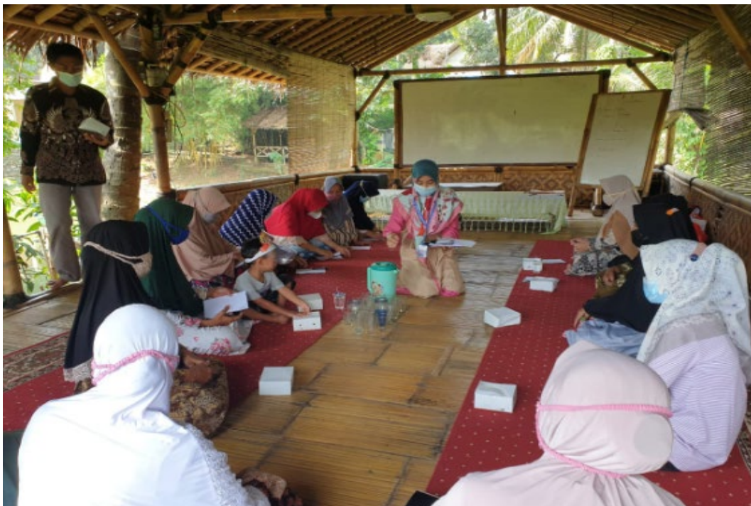
Gambar 1.2 Foto Tim Pengabdian dan Peserta

Pelaksanaan pengabdian dilakukan pada hari Jumat sampai dengan Minggu tanggal 18-20 Juni 2021 dengan menerapkan protokol kesehatan. Selama kegiatan pemahaman terkait usaha yang mereka tekuni dan pembukuannya menggunakan bahasa keseharian. Hal ini dimaksudkan agar para UMKM tersebut lebih mudah memahami dan mudah dicernakan. Selain pemahaman, para pelaku UMKM juga diajarkan untuk melakukan simulasi pembukuan.