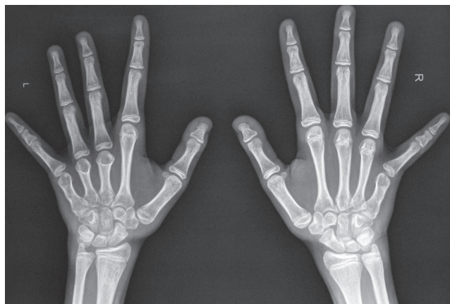
Рис. 5. Рентгенограмма пациентки с брахиметакарпией обеих кистей. Отмечается изменение формы эпифизарной пластинки укороченных пястных костей по типу «воронки», снижение рентгенологической контрастности головок пораженных костей и гипоплазия ногтевых фаланг первых пальцев

Также для оценки функции кисти мы использовали опросник неспособностей верхних конечностей DASH, средняя оценка по которому до лечения была равна 8 баллам.