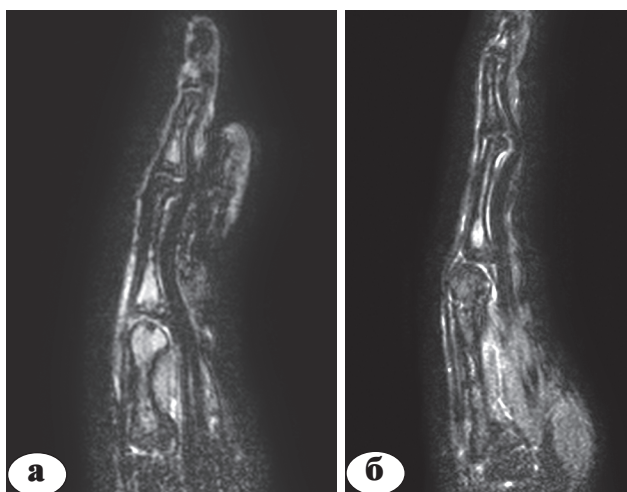
Рис. 7. Срез компьютерной томограммы кисти пациентки с брахиметакарпией на уровне укороченной III пястной кости: а – до лечения; определяется диастаз между суставными поверхностями пястной кисти и фаланг; б – после лечения; определяется децентрация пястно-фалангового сустава, снижение высоты его суставной щели и отсутствие суставной щели межфаланговых суставов; сгибание в пястно-фаланговом и дистальном межфаланговом суставах и переразгибание в проксимальном межфаланговом суставе (симптом «лебединой шеи»)