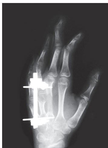
Рис. 6. Рентгенограмма кисти в косой проекции пациентки с брахиметакарпией после удлинения III пястной кости. Состояние на этапе лечения. Определяется деформация III луча по типу «лебединой шеи»

Осложнения отмечены у двух пациентов на трех кистях: у одной пациентки (№ 2) отмечалась инфекция мягких тканей вокруг спиц, которая была купирована в процессе лечения с помощью курса антибиотикотерапии и не потребовала преждевременного демонтажа distraction-аппарата. У другой пациентки (№ 1) осложнения были получены в процессе удлинения контрактуры пястно-фаланговых и межфаланговых суставов на обеих кистях, при чем на III луче левой кисти развилась деформация по типу «лебединой шеи» (рис. 6). Сравнение срезов компьютерной томографии до удлинения и после показало снижение высоты суставной щели пястно-фалангового и межфаланговых суставов пальца после distraction (рис. 7).