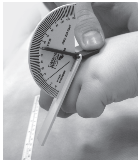
Рис. 4. Измерение объема активного сгибания в пястно-фаланговом суставе пораженного луча у пациентки с брахиметакарпией. Угол сгибания равен 50°