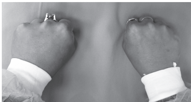
Рис. 3. Внешний вид кистей пациентки с брахиметакарпией обеих кистей. Определяется западение головок V пястной кости справа и IV пястной кости слева