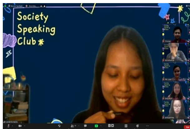
Gambar 1. Foto MC membuka acara SSC

Sesi pertama kegiatan Society Speaking Club dilaksanakan pada hari Jumat, 19 Februari 2021 pada pukul 16.00-17.30 WIB melalui Zoom meeting. Total peserta di sesi pertama adalah 27 peserta. Acara dibuka oleh MC dengan memperkenalkan garis besar program SSC dan tema diskusi kepada para peserta. MC juga memperkenalkan fasilitator yang akan mendampingi para peserta dalam berlatih speaking dan narasumber. Setelah sesi pembukaan oleh MC selama 10 menit, acara dilanjutkan dengan sesi pertama yang menghadirkan narasumber seorang Dosen Psikologi dari USD, yaitu Bapak C. Siswa W., M.Psi.