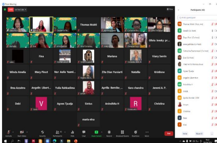
Gambar 4. Foto Peserta SSC Seri Ketiga

Antusiasme para peserta inipun berlanjut di ruang diskusi kecil dimana dengan bantuan fasilitator peserta membagikan pengalaman mereka dan hal-hal sederhana yang sudah mulai mereka terapkan terkait dengan lingkungan. Peserta nampak sudah sangat menikmati menggunakan Bahasa Inggris dalam membagikan pengalaman dan tips-tips menjaga lingkungan. Diskusi seri ini tidak hanya melatih keterampilan berbicara dalam Bahasa Inggris namun juga menambah wawasan peserta tentang pentingnya menjaga lingkungan. Dengan memahami dampak-dampak yang bisa terjadi di masa depan, kesadaran peserta untuk menjaga lingkungan serta turut aktif mengkampanyekan isu-isu lingkungan mulai muncul. Seri ini berlangsung cukup seru, terbukti dari para peserta yang dengan sukarela menjadi perwakilan untuk mempresentasikan hasil pembahasan diskusi kelompok kecil dalam kelompok besar.