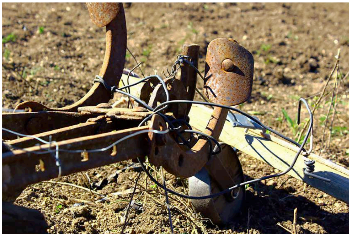
FOTO 2 – A invenção do cotidiano. Máquina adaptada pelo agricultor. (2016).