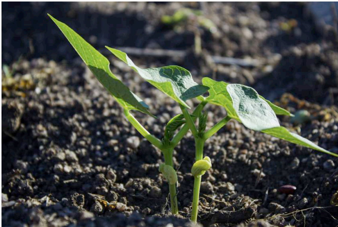
FOTO 9 – Crescer. Planta de feijão na lavoura com vinte e cinco dias após o plantio. (2016)