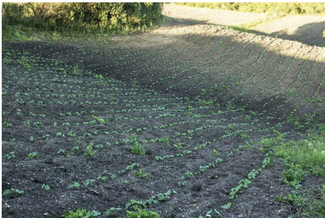
FOTO 10 – Coletivo de não-humanos. Lavoura de feijão com cerca de vinte dias após o plantio. (2016)