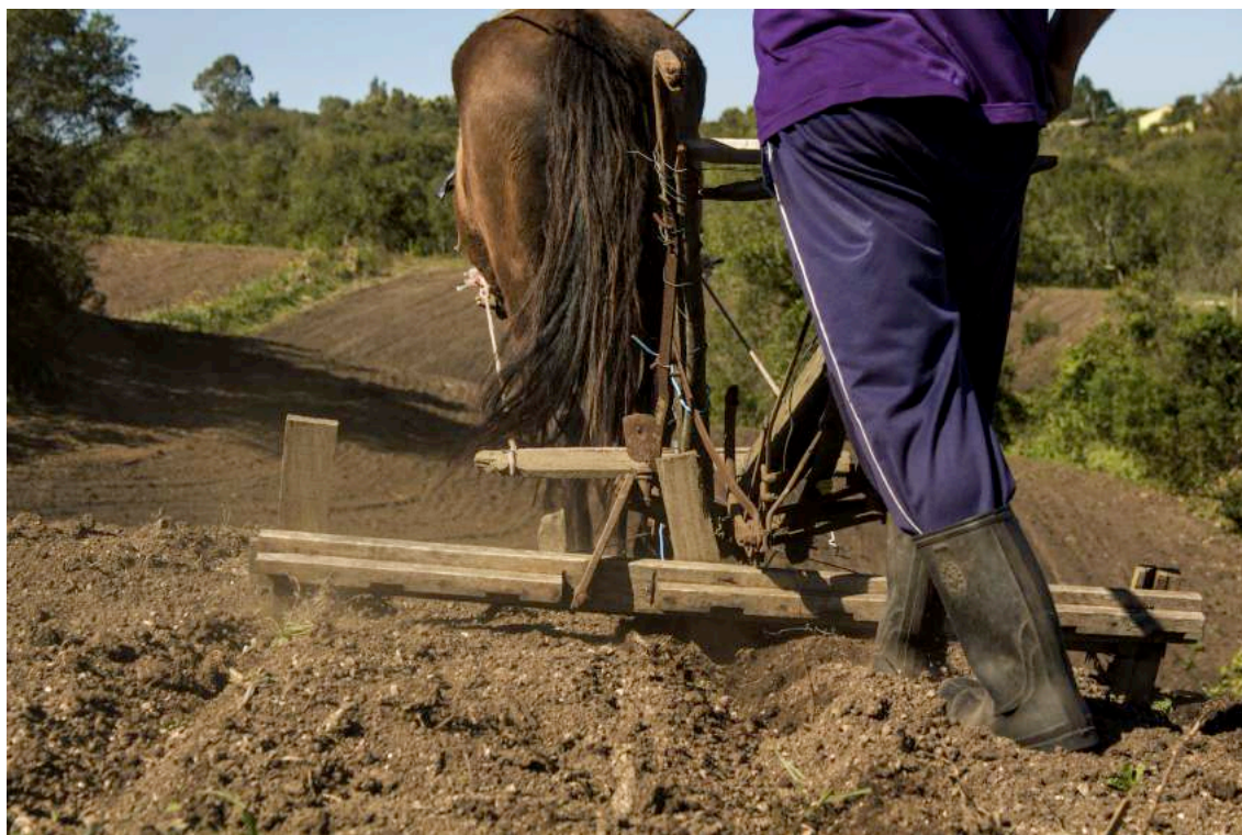
FOTO 1 – Seres (e) máquinas: Onécio, conjuntamente com o cavalo, utilizando a trilhadeira para fazer os canteiros onde serão plantados os feijões. (2016)