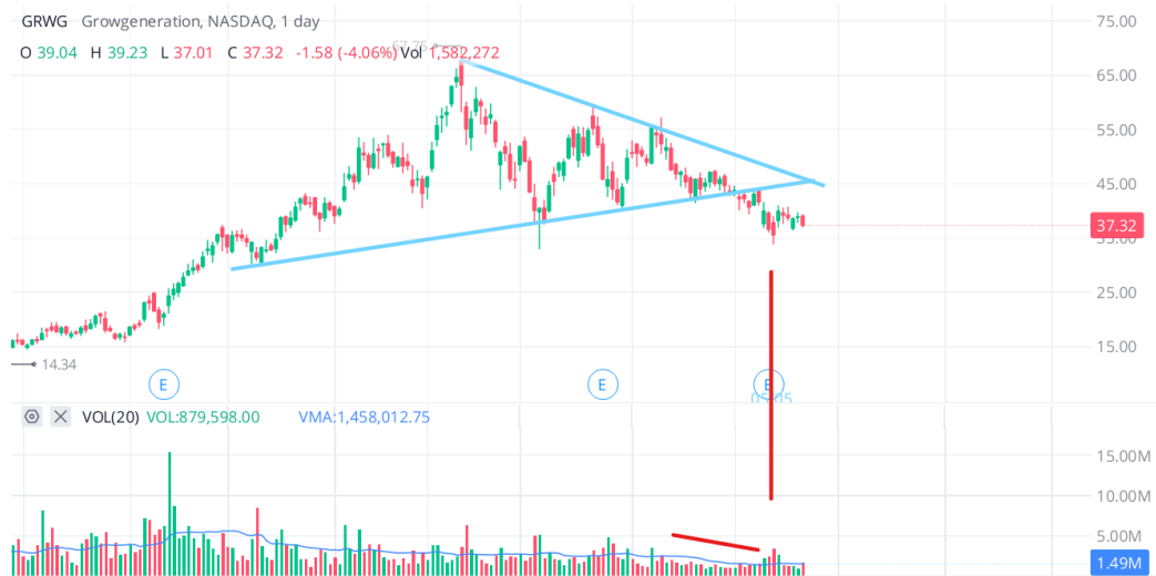
Figura 3.7 Triángulo en Growgeneration