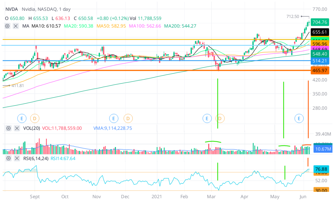
Imagen 5.7. Análisis técnico de Nvidia

Una vez visto cómo podemos hacer una búsqueda rápida para filtrar el tipo de empresas que nos interesa, pasamos a su gráfico técnico para ver las correlaciones con todos los aspectos ya vistos: