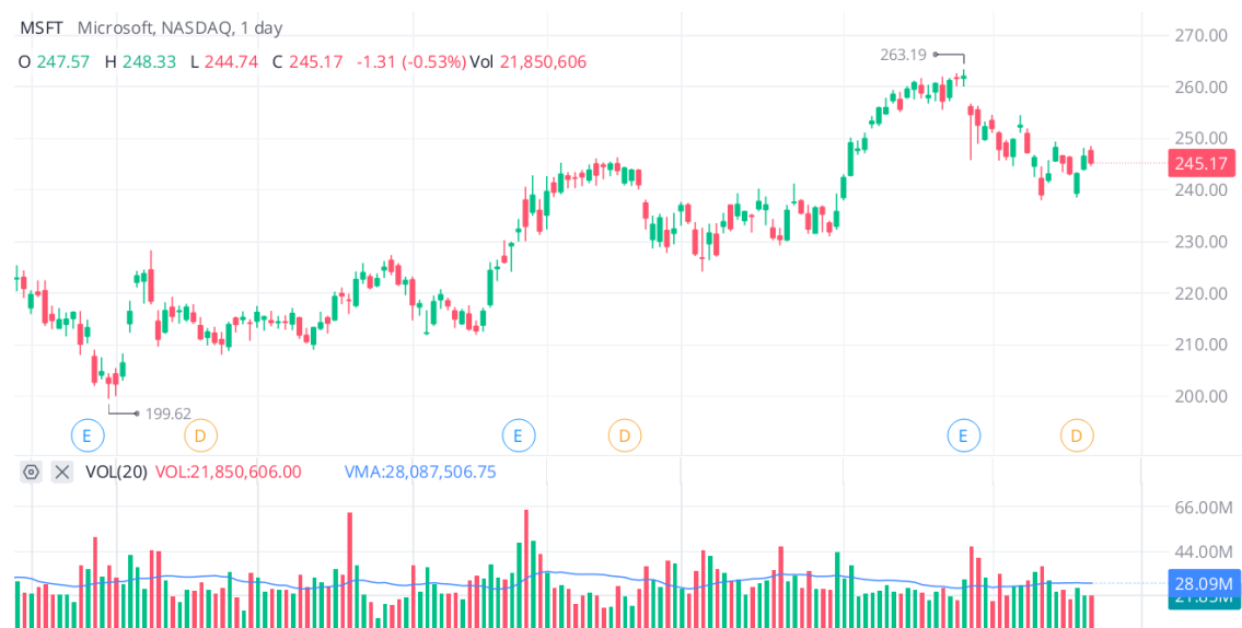
Figura 3.3 Volumen en Microsoft

El volumen puede entenderse como la cantidad de títulos o valor monetario que se negocia en un determinado periodo de tiempo (Ugarte, 1999) y se representa mediante unas barras verticales en la zona baja de los gráficos, cuya altura define la cantidad de valores negociados. Este volumen, al igual que las SMA, puede establecerse una media de volumen que ayude a eliminar ruido de mercado y poder establecer decisiones sobre el volumen en base a una media, generalmente de 20 o 50 sesiones.