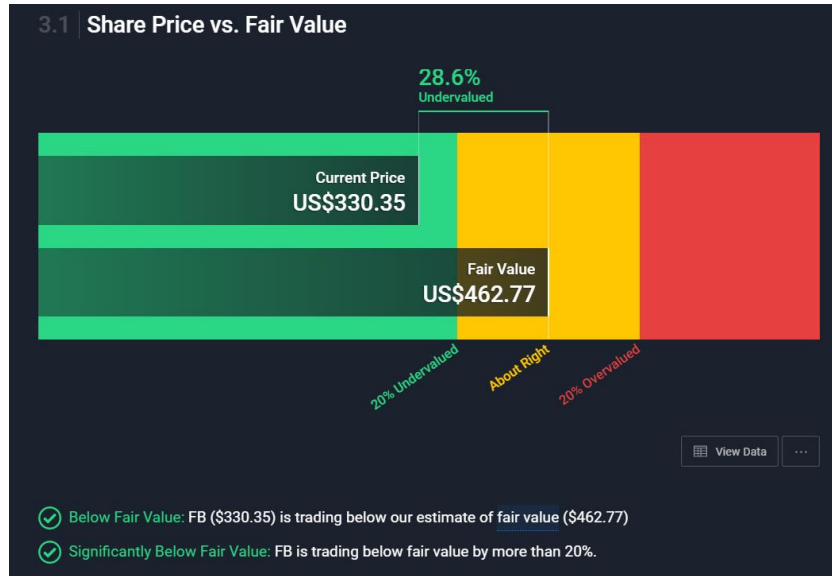
Imagen 5.1 Comparación entre Fair Value y precio actual de Facebook

conocimientos adecuados, pero no quiera un simple fondo indexado; puede optar por buscar en plataformas de pago que hacen este tipo de cálculos (Aunque lo más recomendable sería acudir a asesores profesionales que pudiesen indicarnos que hacer en estos casos, pero aquí damos las opciones para hacerlos por nosotros mismo)