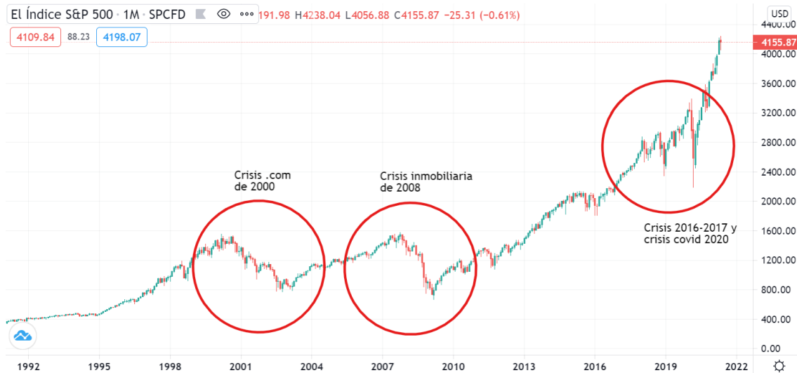
Figura 3.9 Gráfico histórico del S&P 500