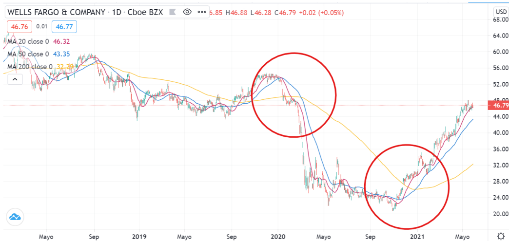
Figura 3.2 Medias móviles en Wells Fargo & Company

En esta imagen podemos apreciar las 3 medias comentadas y como se observa que, a mayor número de periodos, más tenue y calmado es su movimiento. Asimismo, podemos ver los cruces que van haciendo las medias entre sí y con la cotización, de forma que cada cruce conlleva su significado. Hemos señalado dos zonas para ver qué ocurre y los efectos que esto conlleva junto con las conclusiones a sacar: