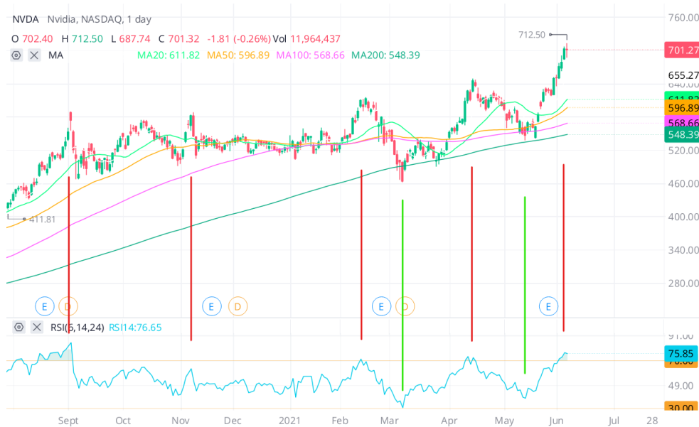
Figura 3.5 Indicador RSI en Nvidia