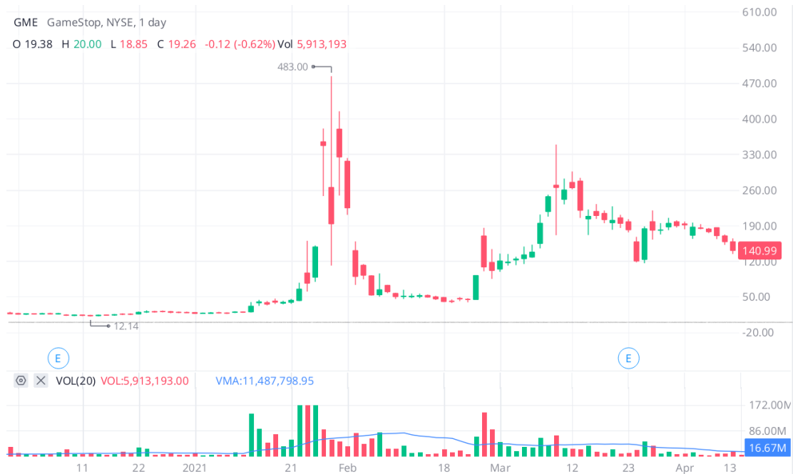
Figura 3.10 Demostración de FOMO en GME