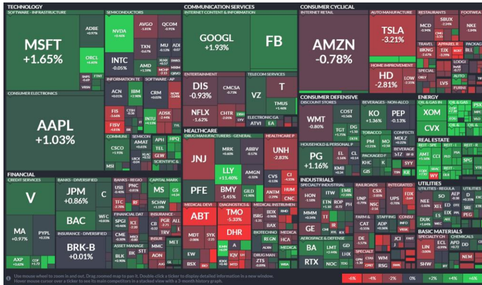
Imagen 5.4. Revalorizaciones por sectores en el S&P500 en la última semana