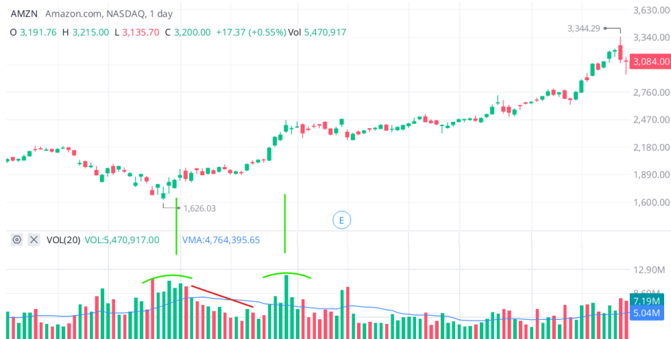
Figura 3.4 Fase de acumulación en Amazon