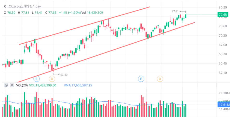
Figura 3.6 Canal de tendencia en Citigroup