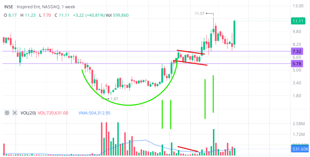
Figura 3.8 Cup and Handle en Inspired Ent