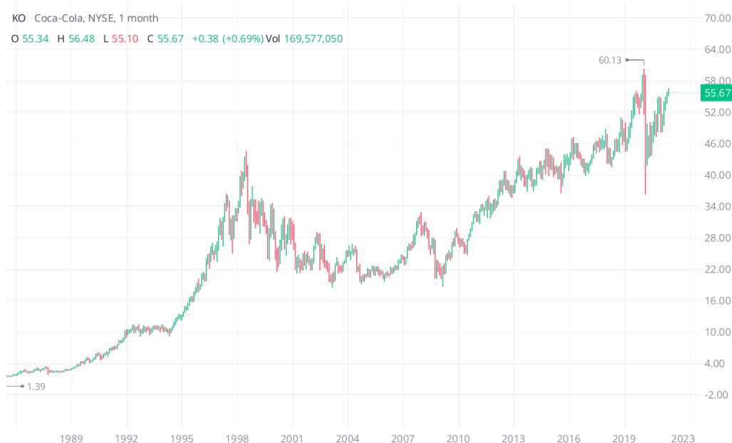
Imagen 5.2. Gráfico mensual de Coca-Cola de toda su historia

Tampoco es necesario estar muy pendiente de la empresa a diario, bastará con hacer un pequeño seguimiento mensual sobre cómo va la cotización, noticias relevantes que puedan afectar a la empresa, presentaciones de resultados cada trimestre... Con el fin de hacer un seguimiento general y que sepamos que no ha ocurrido nada inesperado que pueda hacer cambiar nuestra percepción de la empresa, como por ejemplo que Boeing deje de ser fabricante de aviones militares para el gobierno de Estados Unidos.