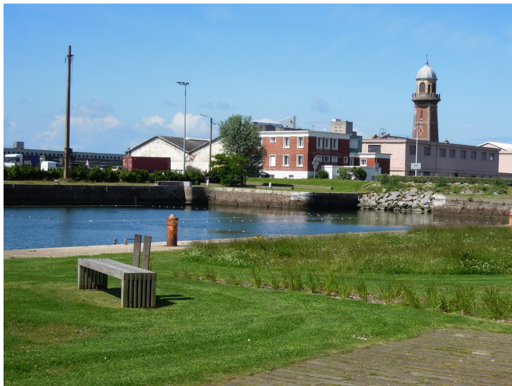
Figure 4. Reconquête paysagère de la zone industrialo-portuaire par la patrimonialisation