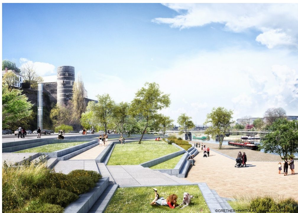
Figure 3. Les plis de la Maine, adaptation et paysage