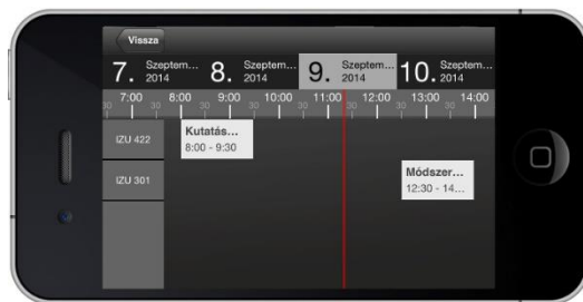
4. ábra. Órarend

A Kurzusaim menüpont a hallgató órarendjének táblázatos megjelenítésére szolgál. A táblázat oszlopai felelnek meg a napoknak, míg a sorai a tantermeknek. Offline egyéni órarend formájában jelenik meg. Az alkalmazás egyelőre nincs összekötve a Neptun rendszerrel, a hallgató a Kurzusok menüpontban saját maga választhatja ki az órarendjében szereplő tárgyakat.