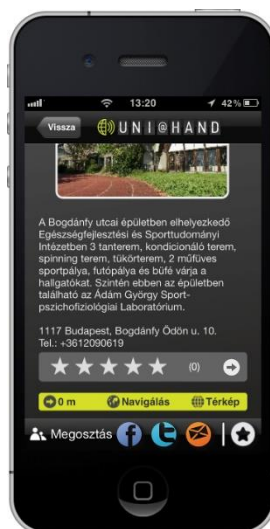
3. ábra. Egy helyszín adatlapja

A helyek többszintű kategória hierarchiában érhetőek el, és lista formájában áttekinthetők a különböző kategóriákhoz tartozó helyszínek. Az egyes helyekhez részletes információ tartozik képekkel, pontos címmel és elérhetőségekkel együtt. Az alkalmazás megjeleníti az épület távolságát a felhasználó aktuális tartózkodási helyétől.