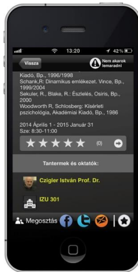
2. ábra. Egy kurzus adatlapja

A Kurzusok menüpont áttekintést nyújt az ELTE PPK tantárgyairól. Egy listát jelenít meg, amiből egy tantárgyat kiválasztva, arról részletes információk jeleníthetők meg, mint például a tantárgy leírása, szakirodalom, időpont, tantermek és oktatók. A kiválasztott tárgyakból áll össze a hallgatók egyéni órarendje, amely Kurzusaim menüpont alatt tekinthető meg.