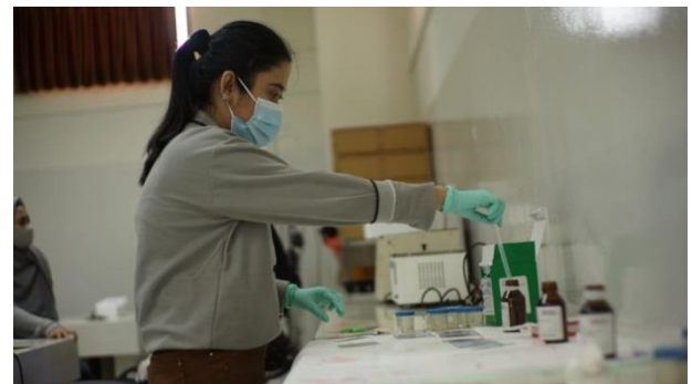
Gambar 2. Pewarnaan ulas darah dengan MDT

Anaplasma sp merupakan parasit darah obligat intraseluler yang dibawa vector kutu Ixodes