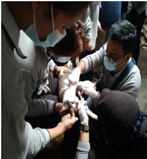
Gambar 1. Pengambilan Darah Kucing