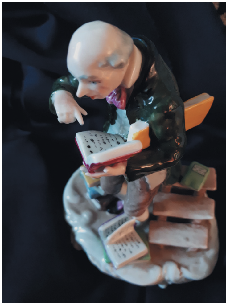
Рис. 2. Книгоочей. Фарфоровая скульптура. Производство Фолькштедт-Рудольштадт. Конец XIX — начало XX века

Fig. 2. Bookworm. Porcelain. The Production of Volkstedt-Rudolstadt. Late XIXth — early XXth century