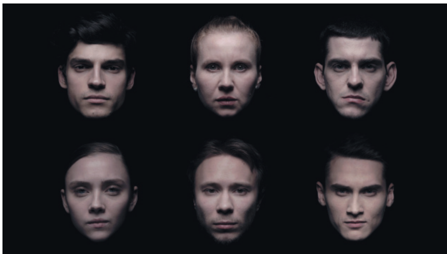
Рис. 7. Кадр из фильма «Кабинет Одоевского». Режиссер Артем Дубра. 2019

Другой луч ведет к экрану, на котором демонстрируется фильм, где говорящие головы персонифицируют разные состояния творческого духа Одоевского (рис. 7). Мы назвали фильм «аудиосимфонией» вследствие той, отмеченной исследователем Е. А. Майминым, музыкальности, что определяет главный литературный труд князя — роман «Русские ночи» [Маймин 1975, с. 261]. Фрагментарность сочетается у Одоевского с музыкальным единством. Композиция его романа-сборника новелл и диалогов разворачивается не поступательно, а ассоциативно, вариационно, по принципу контрапункта. Подобный же принцип был выбран для фильма (режиссер Артем Дубра, композитор Дмитрий Курляндский, артисты Гоголь-Центра, Мастерской Д. В. Брусникина, «ИюльАнсамбль»). Сами выступающие из мрака лица можно сопоставить с фантазмагорической нотацией в партитуре.