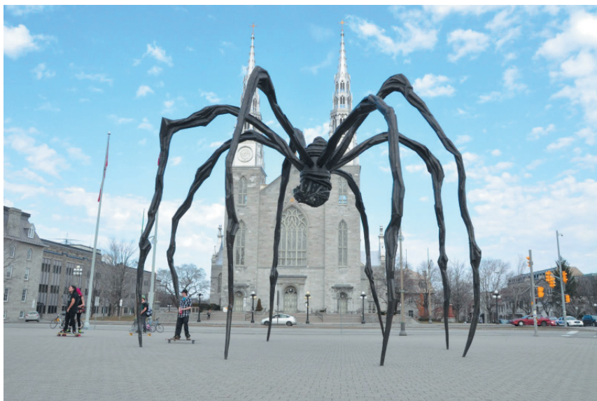
Рис. 5. Луиз Буржуа. Маман. Бронза. 1999 Fig. 5. Louise Bourgeois. Maman. Bronze. 1999

в клетки инсталляций с расчлененными латексными органами, дополняются гигантскими скульптурами паучих. Готический вид (тело с тонкими лапками раскинулось, будто стрельчатый свод с нервюрами) этих паучьих скульптур сближает искусство Буржуа с жанром новелл Одоевского (рис. 5).