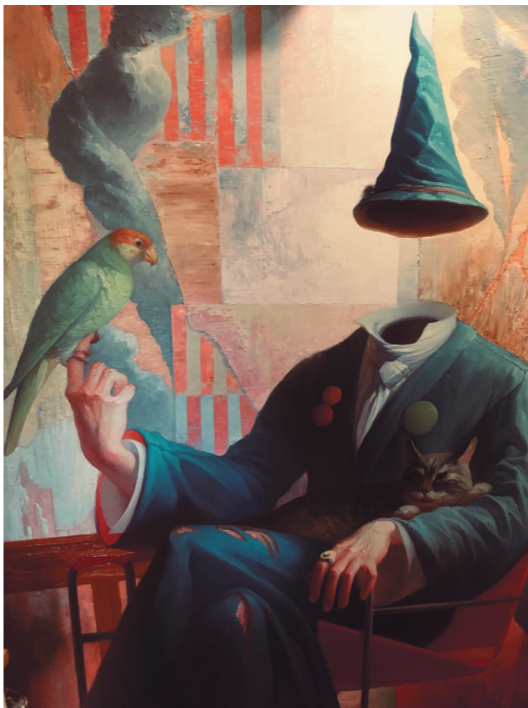
Рис. 1. Егор Кошелев. Портрет князя В. О. Холст, масло. 2019 Fig. 1. Egor Koshelev. Portrait of Prince V. O. Oil on canvas. 2019

гостиной Румянцевского музеума, когда он был там директором, помещался рояль; к нему с одного боку приставлялись ширмы, обратная их сторона прислонялась к дивану, обставленному столиками и стулками разного фасона; один бок дивана замыкался высокою жардиньеркой; несколько дальше помещался большой круглый стол, покрытый ковром и окруженный креслами и стульями. От входной двери шли опять ширмы, отделявшие угол с диваном, этажерками и полочками по стенам. Гостиная представляла совершенный лабиринт; пройти по прямой линии из одного конца в другой не было никакой