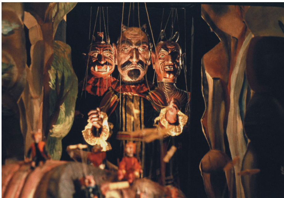
Рис. 4. Ян Шванкмайер. Кадр из фильма «Урок Фауста». 1994 Fig. 4. Jan Švankmajer. A shot from the movie “Faust’s Lesson”. 1994

Анимированное путешествие взаперти собственной домашней Вселенной, внутри собственной коробочки продолжил великий режиссер-сюрреалист Ян Шванкмайер («Алиса в стране чудес» создана им как странствие в детских фантазиях почти кукольного домика). Одоевского со Шванкмайером напрямую связывает фаустовская тема. Князя называли «русским Фаустом». У классика чешского кино есть фильм 1994 года «Урок Фауста» (рис. 4). Оказавшаяся деревянной куклой Маргарита из фильма будто бы родственница тем созданиям, что вышли из мастерской колдуна-кукольника, описанной Одоевским в новелле «Сказка о том, как опасно девушкам ходить толпою по Невскому проспекту».