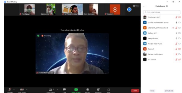
Gambar 4. Evaluasi Pendampingan

Tahapan terakhir dari rangkaian proses pendampingan pengembangan pariwisata lokal berbasis masyarakat ini yaitu mengevaluasi hasil dari apa yang telah tim pengabdian lakukan dengan tujuan untuk menilai keberhasilan kegiatan pengabdian. Sedangkan sasaran evaluasi yaitu terdapat peningkatan pemahaman dari mitra pemberdayaan terhadap urgensi kepariwisataan lokal dan pengelolaan sumber daya lokal. Evaluasi dilaksanakan secara daring dengan memanfaatkan aplikasi zoom meeting karena lebih efisien dan efektif, serta guna meminimalisir penularan Covid-19. Peserta kegiatan evaluasi diantaranya tim pengabdian dan masyarakat dari kedua mitra.