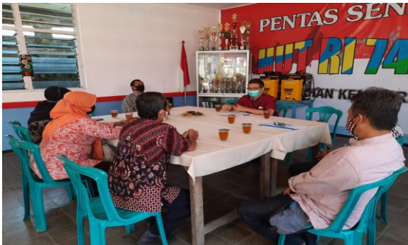
Gambar 3. Pendampingan kepada mitra

Terdapat beberapa temuan ketika tim pengabdian melakukan observasi, yaitu baik kelurahan panjang dan kelurahan kemirirejo sebenarnya telah memiliki modal untuk menciptakan kampung pariwisata misalnya terdapat aliran sungai yang bisa dijadikan sebagai area tracking untuk wisatawan, terdapat potensi umkm masyarakat yang bisa mendukung kepariwisataan lokal, serta sumber daya yang berkeinginan untuk membentuk wisata lokal.