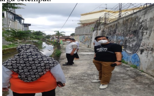
Gambar 2. Observasi pengabdian di mitra

Pada tahapan kedua yaitu observasi, dilakukan secara luring mengingat untuk menilai kondisi mitra, maka tim pengabdian harus mengamati secara langsung lokasi pengabdian di dua kelurahan pada hari yang sama. Pelaksanaan observasi dilakukan dengan teknik observasi partisipan yaitu tim pengabdian bersama-sama dengan para mitra mengelilingi kampung dan berinteraksi dengan warga setempat.