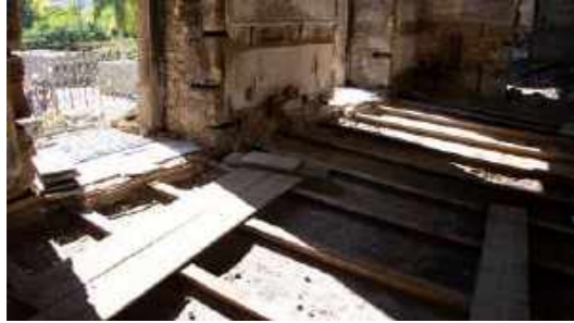
Chão da sala Culturas do Pacífico, que não ruiu ou desabou / Floor of the Pacific Cultures room, which did not crumble or collapse.

Na exposição “Culturas do Pacífico” estavam algumas das coleções mais antigas do Museu Nacional, formadas após a Abertura dos Portos, em 1808. Algumas delas foram presentes de representantes de nações e reinos quando aportavam no Rio de Janeiro. As peças eram documentos da formação dos Impérios ultramarinos e das relações diplomáticas estabelecidas desde o final do século XVIII. Daí foram resgatados especialmente líticos.