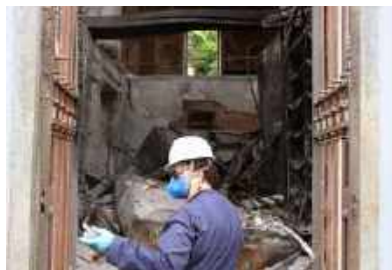
Abrindo caminho para os laboratórios / Opening the way for the labs.

“Cada fresta que podíamos investigar, cada montinho e estrutura que mexíamos era uma nova janela de esperança.”