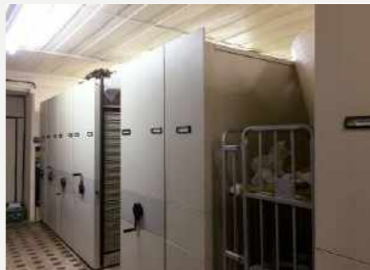
Área das coleções Paleontológicas antes do incêndio / Area of the Paleontological collections before the fire.

Antes do incêndio estavam localizadas no andar térreo do palácio, onde ficavam as coleções do Departamento de Geologia e Paleontologia (DGP). Sofreram não só com o incêndio, mas também com o desabamento dos andares superiores sobre elas e com as chuvas que ocorreram nos meses seguintes.