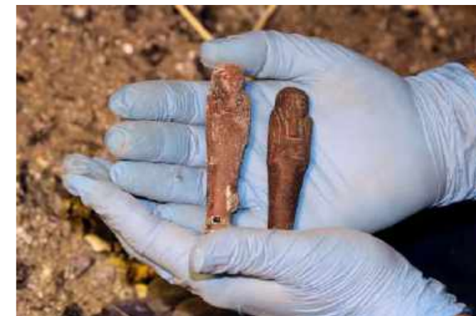
Estatuetas de servidores funerários (“shabtis”) que sofreram alteração cromática com o incêndio. Originalmente, a coloração era verde água. Coleção Egípcia / Statuettes of funeral servants (“shabtis”) that underwent chromatic changes due to the fire. The original coloring was water green. Egyptian collection.

Muitos materiais sofreram alterações permanentes, como alguns que mudaram de coloração ou foram afetados pela ferrugem do mobiliário de metal nas quais estavam acondicionadas.