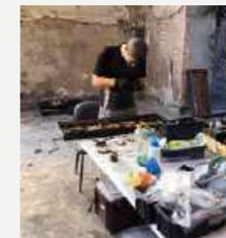
Resgate na área da coleção de Malacologia após o incêndio / Rescue in the area of the Malacology collection after the fire.

No entanto, naquela mesma noite, esforços de colegas da instituição salvaram os espécimes-tipo da coleção de Malacologia (ramo da Zoologia que estuda os moluscos, como ostras, caracóis e lulas) e Carcinologia (ramo da Zoologia que estuda os crustáceos, como lagostas, cracas e caranguejos). Os espécimes-tipo são os componentes mais importantes das coleções zoológicas porque foram utilizados para designar uma nova espécie. O salvamento destes exemplares foi um momento muito feliz para a instituição e para os curadores responsáveis por essas coleções.