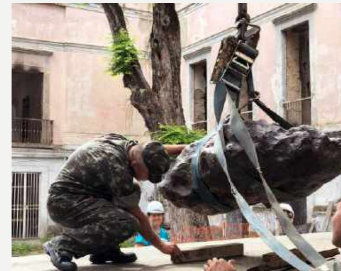
Meteorito Santa Luzia / Meteorite Santa Luzia.