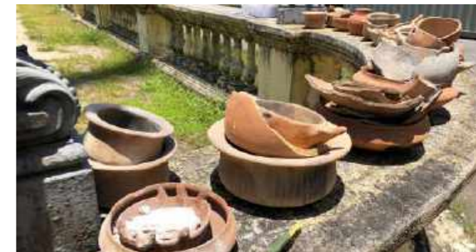
Objetos cerâmicos recuperados no resgate aéreo / Ceramic objects rescued by air operation.