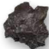
Meteorito Whitecourt / Meteorite Whitecourt.