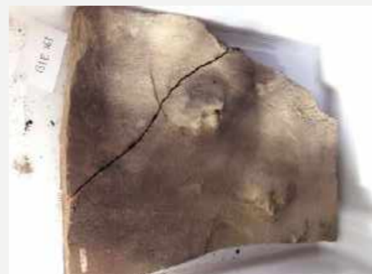
Fósseis resgatados / Rescued fossils.

“Trago a tranquilidade de quem faz o seu melhor pela recuperação do acervo e a alegria por nunca ter perdido a esperança.”