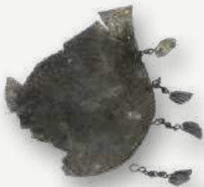
Abebés. Objeto ritual de Oxum. Rio de Janeiro. Século XIX. Liga metálica. Resgatados da Sala Kumbukumbu / Abebés. Ritual object of Oxum. Rio de Janeiro. 19th century. Metal alloy. Rescued from the Kumbukumbu room.