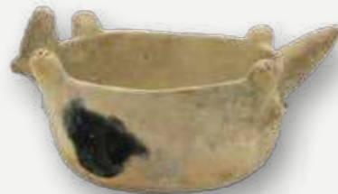
Panela zoomorfa. Waujá. Xingu. s/d / Zoomorphic pot. Waujá. Xingu. s.a.