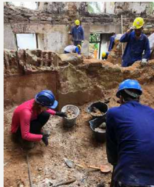
Escavação na área da coleção de Carcinologia após o incêndio / Excavation in the area of the Carcinology collection after the fire.