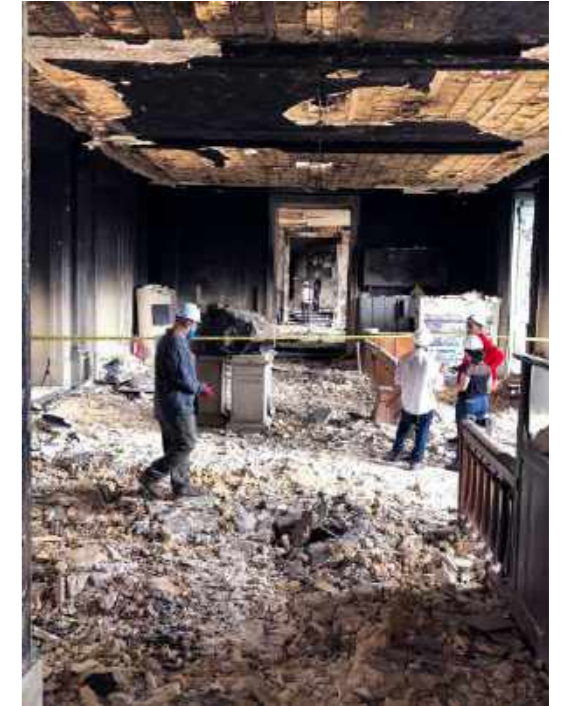
Meteorito Bendegó no salão de entrada do Museu Nacional / The Bendegó meteorite in the entrance hall of the National Museum.

Rocks and minerals carry in themselves unique histories of formation, whether by crystallization of a magma, sedimentation or metamorphism. The same goes for meteorites, which resisted high temperatures during their entry into the atmosphere, and impact on Earth. In addition to the formation history, samples from the National Museum's geological collections now record the fire itself as part of their history.