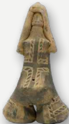
Ritxòkò. Boneca de cerâmica. Karajá. Vale do Rio Araguaia. Século XX / Ritxòkò. Ceramic doll. Karajá. Araguaia River Valley. 20th century.