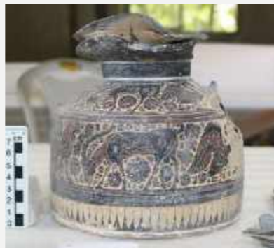
Jarro com pintura. Coleção Imperatriz Teresa Cristina / Painted jar Empress Teresa Cristina Collection.