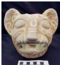
Vaso zoomorfo de cerâmica representando um felino, resgatado da Reserva Técnica do Palácio. Coleção Pré-colombiana / Zoomorphic ceramic vase representing a feline, rescued from the Technical Reserve of the Palace. Pre-Columbian Collection.