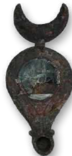
Lamparina de bronze que estava em exposição na sala Pompeia, com fragmento de vidro aderido. Coleção Imperatriz Teresa Cristina / Bronze lamp that was on exhibition in the Pompeii room, with glass fragment adhered. Empress Teresa Cristina Collection.