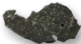
Meteorito Taza / Meteorite Taza.

“Tivemos que remover um pouco de entulho e ao retirar a segunda gaveta, lá estavam os meteoritos! Confesso que eu estava tão empenhada em resgatá-lo que senti uma ternura e não alegria. Como num filhotinho em um parto.”