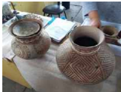
Área da triagem. Registro dos objetos cerâmicos recuperados da reserva técnica / Screening area. Record of ceramic objects rescued from the technical reserve.