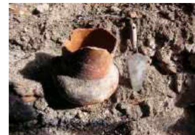
Urna Marajoara fragmentada e com alterações na forma e decoração. Coleção de Arqueologia Brasileira / A fragmented Marajoara urn with changes in shape and decoration. Brazilian Archaeology Collection.

Parte das coleções que se encontravam em exposição foram resgatadas em meio a muitos estilhaços de vidro das vitrines – algumas das peças infelizmente também estilhaçadas. O trabalho foi muito minucioso em alguns locais, e muitos auxiliares nos perguntavam sobre a possibilidade de remontar aquelas peças. Na Arqueologia, estamos acostumadas/os a encontrar materiais fragmentados em campo, então essa coleta nos parecia bastante óbvia e corriqueira. De todo modo, era interessante o olhar que profissionais de fora da Arqueologia forneciam, convidando-nos a pensar, já durante o resgate, sobre as possibilidades de estudo e fruição daquelas peças mais afetadas e tão transformadas. Crateras italiotas, bronzes de Pompeia e outros materiais da coleção constituída pela Imperatriz Teresa Cristina, e que se encontravam expostos no segundo pavimento, são exemplos disso.