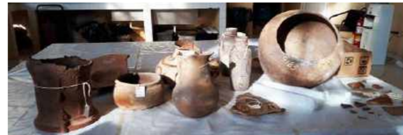
Primeiras cerâmicas resgatadas / First ceramics rescued.

The rescue of these materials demanded a series of specific care and knowledge, such as attention to distinguish the archaeological collection - especially pre-cabraline ceramics and historical material - from tiles, bricks, nails and other building materials of the Palace, mixed with rubble and ashes in the most affected areas. After all, the Palace itself has architectural elements from different times, revealed and mixed by the disaster.