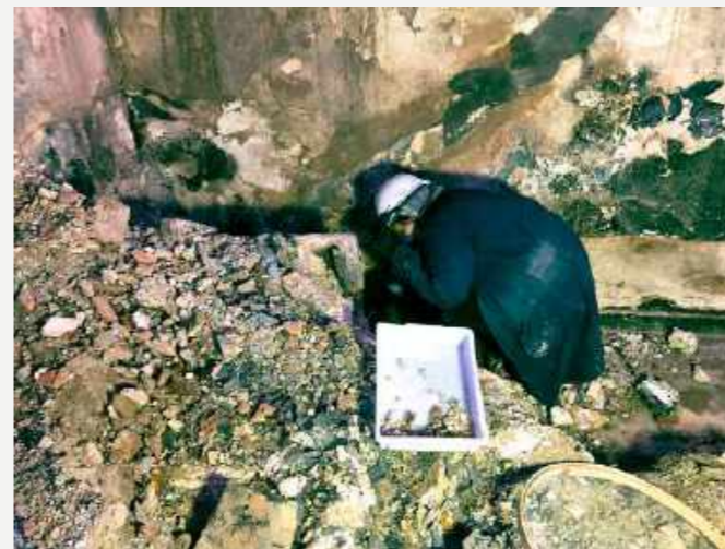
Resgate de materiais na reserva técnica de Etnologia / Rescue of materials in the technical reserve of Ethnology.

The collections occupied two technical reserves and four exhibition rooms. The technical reserves corresponded to an area of approximately 300m 2 and used to receive groups of indigenous and non-indigenous students and researchers interested in studying the collections. Almost all the ethnological collection was stored there, with specimens characterized by the diversity of materials (feathers, wood, lithic, basketry, ceramics, metal, etc..).