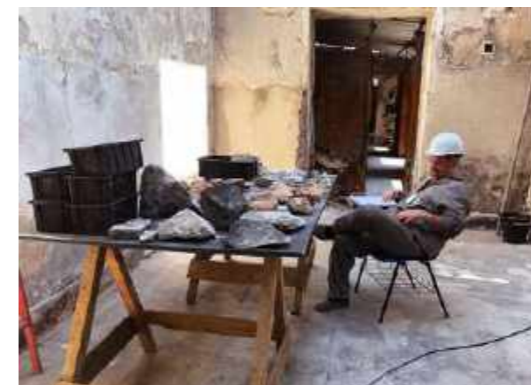
Descanso merecido após um longo dia de resgate da coleção de rochas sedimentares / Deserved rest after a long day of rescuing the collection of sedimentary rocks.

As the geological collections are constituted by a different typology, they also showed different behaviors of resistance to the heat of fire and to the exposure to rain of the following days. The damage suffered by these materials will be analyzed at a later stage, but the joy provided by the materials that resisted is already comforting in some way.