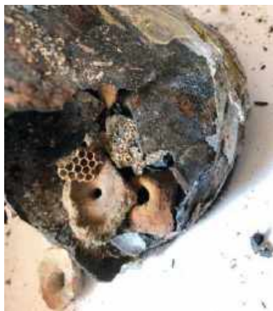
Ninhos de vespa que se preservaram apesar do calor e da queda do terceiro para o primeiro andar / Wasp nests that resisted preserved despite the heat and the fall from the third to the first floor.