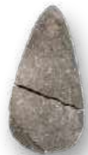
Lâmina de machado de pedra, usado para trabalho agrícola da Nova Guiné. Resgatado da Sala Culturas do Pacífico / Blade of a stone ax, used for agricultural work in New Guinea. Rescued from the Pacific Cultures room.

As coleções resgatadas, apesar de terem sofrido transformações de seus materiais pela ação do fogo, seguem integrando o acervo do Museu Nacional. Dizer que elas não existem mais seria um equívoco. Além do resgate, está em andamento o trabalho de recuperação digital dessas coleções. Afinal, um acervo não é constituído apenas por sua materialidade. Temos pela frente grandes desafios, lamentamos a perda provocada pelo incêndio, mas não perdemos a habilidade de produzir conhecimentos.