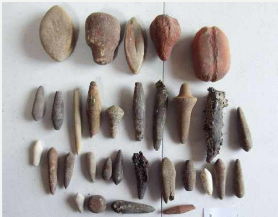
Boleadeiras e pesos de rede. Coleção Arqueologia Brasileira / "Bolas" and net weights. Brazilian Archaeology Collection.