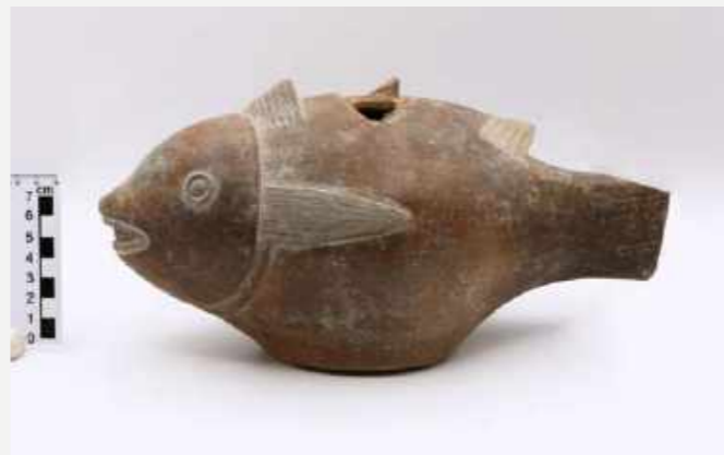
Vaso zoomorfo em cerâmica que pertencia a D. Pedro II. Coleção Pré-colombiana / Zoomorphic ceramic vase that belonged to D. Pedro II. Pre-Columbian Collection.