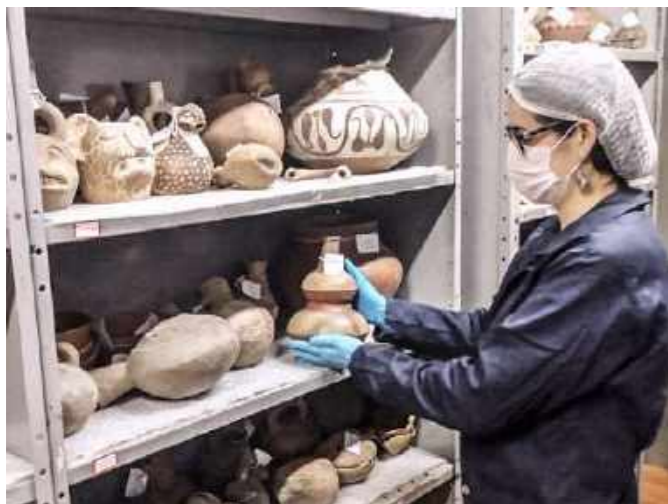
Peças das coleções de arqueologia Pré-colombiana resgatadas, armazenadas em contêiner / Rescued pieces from the pre-Columbian archeology collections, stored in a container.