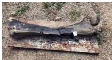
Fêmur de mastodonte logo após ser resgatado dos escombros / Mastodon femur shortly after being rescued from the rubble.