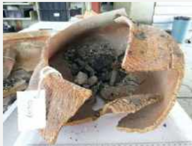
Vasilhame Tupiguarani alterado e muito fragmentado, com possibilidade de reconstituição. Coleção Arqueologia Brasileira / Tupi-Guarani pot altered and very fragmented, possibly reconstitutable. Brazilian Archaeology Collection.