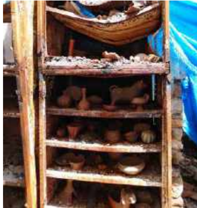
Apesar do fogo e desabamento dos pisos superiores, os armários onde estavam armazenadas peças da Coleção Pré-colombiana mantiveram-se íntegros e fechados / Despite the fire and collapse of the upper floors, the cabinets where pieces of the Pré-Columbian collection were stored remained intact and closed.

Outra particularidade das coleções arqueológicas diz respeito à variedade de tipologias de bens e de matérias-primas das quais são compostas. São cerâmicas, louças, vidros, metais, tecidos e outros materiais orgânicos, líticos e ossos de animais. Incluem desde conjuntos de materiais já fragmentados a urnas inteiras com um metro de altura, adornos e contas milimétricas, blocos retirados de sambaquis, pequenas pontas de flechas, muiraquitãs, cachimbos, azulejos, amostras de sedimento, carvões, grandes e pesados almofarizes e pilões em rocha, múmias, entre muitos outros.