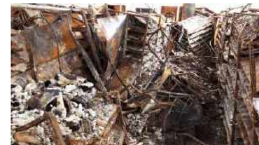
Exemplo de armários compactadores da Coleção de Paleovertebrados que foram esmagados pelo peso dos andares superiores / Example of compactor cabinets of the Paleovertebrate Collection that were crushed by the weight of the upper floors.