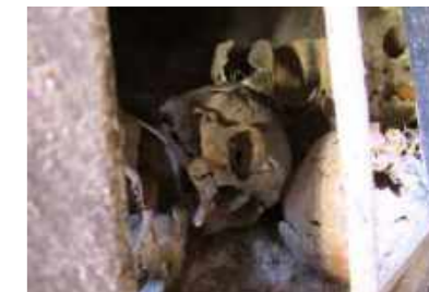
Crânios que sobreviveram ao tempo e ao fogo / Skulls that survived time and fire.