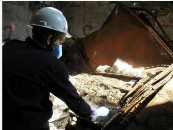
É possível fazer arqueologia no desastre / It is possible to do archeology in the disaster.

A double challenge that ends in the rescue of a technical reserve of Biological Anthropology with science, culture and memory side by side: a space not only to guard mysteries about our past and cultures lost in time immemorial, but also a mausoleum, a space of respect and reverence. The rescue thus becomes to recover more than the collection. It is a rescue of those who were under our responsibility, a rescue of the science and history memory of the National Museum, and a rescue of ourselves.