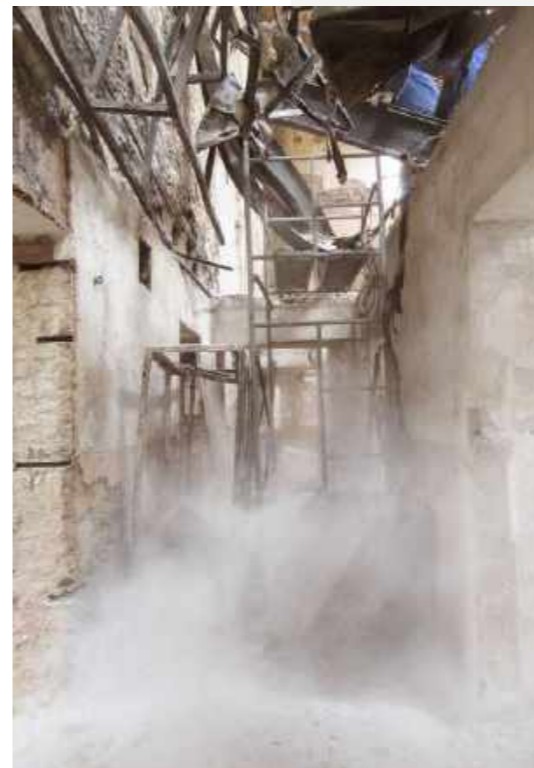
Abrindo caminho para os laboratórios / Opening the way for the labs.

“O momento mais difícil para mim foi exatamente o momento antes de abrir o armário onde se encontrava o crânio da Luzia. Atravessar os escombros, desviar dos metais retorcidos dos andares de cima eram grandes desafios, mas nada se comparava a chegar diante do crânio mais famoso da nossa instituição e tirar a dúvida que todos nós tínhamos. Então, ao abrir lentamente a porta retorcida de metal, pude ver e dar a notícia: a Luzia está aqui!”