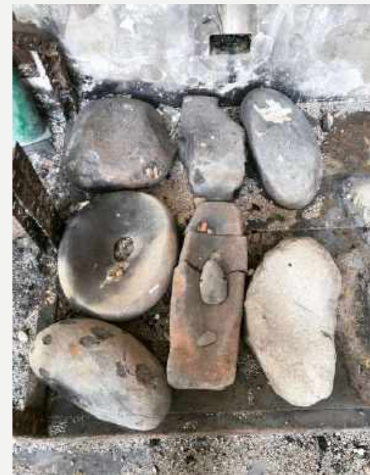
Almofarizes e pequena lâmina de machado visivelmente alterados. Coleção Arqueologia Brasileira / Mortars and small ax blade visibly altered. Brazilian Archaeology Collection.