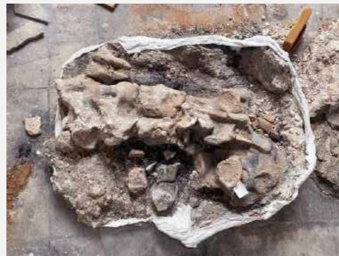
Bloco contendo restos fossilizados de dinossauro proveniente do Mato Grosso encontrado soterrado pelos escombros / Block containing fossilized remains of a dinosaur from the state of Mato Grosso, found buried in the rubble.

“Impressionante entrar no prédio do Museu após a tragédia e constatar como as transformações ocasionadas pelo incêndio expuseram estruturas arquitetônicas originais do Palácio, ocultas por anos de intervenções. Buscar beleza nas formas alteradas foi, para mim, uma das maneiras de amenizar a dor...”