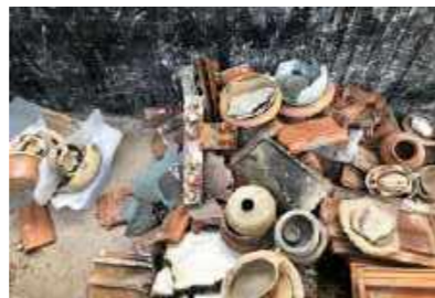
Material resgatado da reserva técnica de Etnologia / Material rescued from the technical reserve of Ethnology.

As coleções ocupavam duas reservas técnicas e quatro salas de exposição. As reservas técnicas correspondiam a uma área aproximada de 300 m 2 e recebiam grupos de estudantes e pesquisadores indígenas e não indígenas interessados no estudo das coleções. Ali estava guardado quase todo o acervo etnológico, cujos exemplares eram caracterizados pela diversidade de materiais (plumária, madeira, lítico, cestaria, cerâmica, metal, etc..).