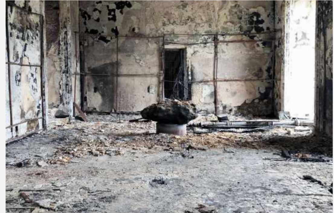
Meteorito Santa Luzia após a limpeza da sala / Meteorite Santa Luzia after cleaning the room.