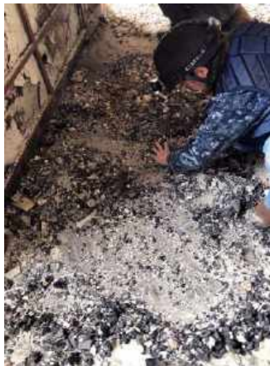
Resgate de meteoritos perdidos em meio às cinzas / Rescue of meteorites lost amid the ashes.