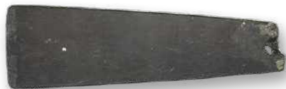
Lâmina de Machado. Arma de guerra de Jade da Nova Zelândia. Século XIX. Resgatada da Sala Culturas do Pacífico / Axe blade. New Zealand Jade war weapon. 19th century. Rescued from the Pacific Cultures room.

The rescued collections, despite the fact that their materials have undergone transformations due to the action of fire, continue to be part of the National Museum's collection. It would be a mistake to say that they no longer exist. In addition to the rescue, the digital recovering of these collections is ongoing. After all, a collection is not only made up of its materiality. We have great challenges ahead, we regret the loss caused by the fire, but we have not lost the ability to produce knowledge.