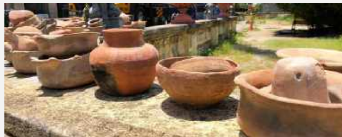
Objetos cerâmicos recuperados no resgate aéreo / Ceramic objects rescued by air operation.

Aproximadamente 500 objetos das coleções estavam exibidos ao público, distribuídos nas exposições: Etnologia Indígena, Kumbukumbu, Culturas do Pacífico e Karajá, plumária e etnografia. A sala da "Etnologia Indígena" apresentava artefatos que indicavam a ocupação do interior do país, em especial na Amazônia e no Brasil Central, retratando o encontro entre artistas e artífices indígenas, mestres do barro, dos trançados, da plumária, da música e da guerra, com naturalistas, militares, religiosos e etnólogos. A equipe de resgate conseguiu localizar sobretudo os objetos de cerâmica.