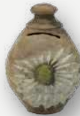
Cofre. Miniatura em cerâmica. Alagoas, Bahia ou Pernambuco. Coleção Regional. Meados do século XX / Vault. Miniature in ceramic. Alagoas, Bahia or Pernambuco. Regional Collection. Mid-20th century.