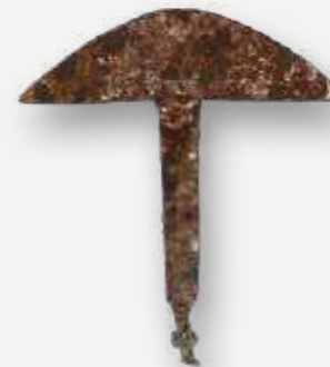
Lamina de machado. Shona. Bacia do rio Zambeze. Século XIX. Metal. Estava em exibição na sala Kumbukumbu / Axe blade. Shona. Zambezi River Basin. 19th century. Metal. It was on exhibition in the Kumbukumbu room.