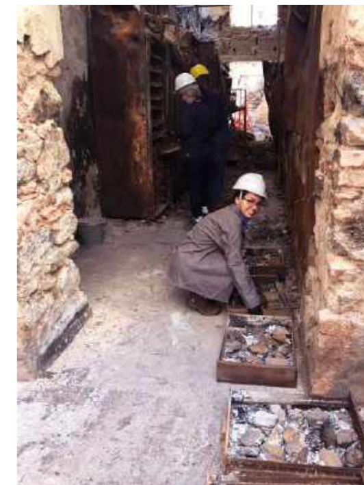
Funcionários do Museu Nacional e da Concrejato trabalhando em conjunto para realizarem o resgate do acervo da coleção de petrografia / Employees from the National Museum and Concrejato working together to carry out the rescue of the petrography collection.