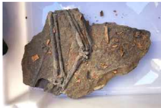
Esses ossos de pterossauro resistiram às chamas, mas seu número de registro se tornou imperceptível. Pode-se notar o lastro (base branca) preservado em uma das bordas da peça / These pterosaur bones resisted the flames, but their registration number became inconspicuous. It is possible to notice the white base preserved on one of the edges.

Notamos que muitos dos números de tombo, escritos diretamente nas peças e que as identificavam, não se preservaram e isto gera problemas para o reconhecimento do acervo. Para as coleções em que os materiais tinham as suas localizações registradas nos bancos de dados, o trabalho de reconhecimento será facilitado. Porém, para aquelas que não possuem essas informações, a identificação das peças será um verdadeiro trabalho de detetive.