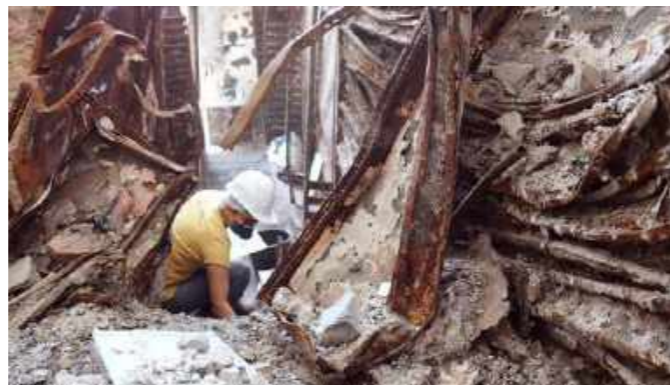
Resgate de minerais soterrados em cinzas e escombros / Rescue of minerals buried in ash and rubble.