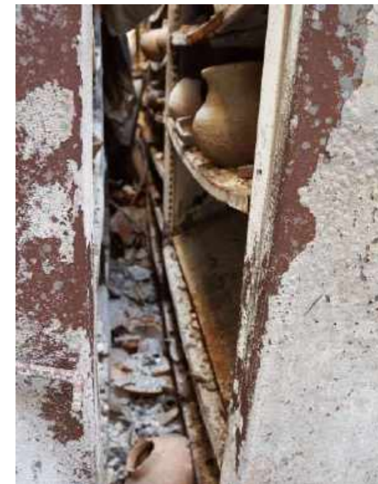
Vão entre estantes do compactador da Reserva Técnica da Arqueologia do Palácio evidenciando os reflexos das chamas e do impacto dos destroços sobre o acervo / A gap between shelves of the compactor in the Archeological Technical Reserve of the Palace, showing the reflections of the flames and the impact of the debris that fell on the collection.