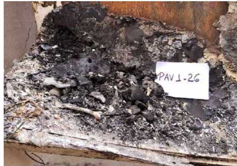
Restos esqueléticos de vertebrados preservados após o incêndio e o desabamento / Skeletal remains of vertebrates preserved after the fire and the collapse.

“O trabalho no Resgate me faz perceber a grandeza de nossa instituição, construída pela dedicação de inúmeras pessoas ao longo de seus mais de 200 anos. É marcado por um esforço contínuo, necessário e fundamental, e legado da atual e futuras gerações na manutenção do Museu Nacional como instituição pública de excelência.”