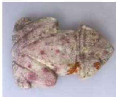
Muiraquitã da região Amazônica. Coleção Arq. Brasileira / Muiraquitã from the Amazon region. Brazilian Archaeology Collection.