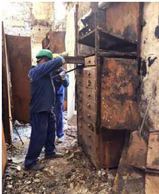
Equipe da Concrejato atuando no resgate de acervos / Concrejato company team working in the rescue of collections.