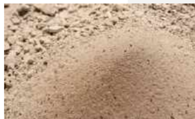
Detalhe de uma das peneiras / Detail of one of the sieves.