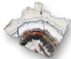
Exemplar de ágata resgatado / A rescued agate specimen.

The geological collection, as well as the paleontological one, was located in the technical reserve of the DGP, on the ground floor of the Palace, and has one of the highest recovery rates among the rescued collections. The nature of the collection helps to this reality. Basaltic rocks, for example, are formed at 1200 °C temperature. That was probably why they were not severely affected by the heat of the fire and were rescued intact. The rescue of this collection, now marked by different stories, shows the resistance of the National Museum, its researchers and Brazilian science itself.