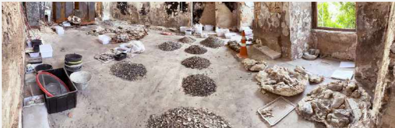
Área da Coleção de Paleovertebrados após intervenção do Resgate / Paleovertebrate Collection area after Rescue intervention.