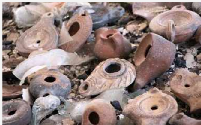
Lamparinas de terracota em exposição na sala Pompeia. Coleção Imperatriz Teresa Cristina / Terracotta lamps on exhibition in the Pompeii room. Empress Teresa Cristina Collection.