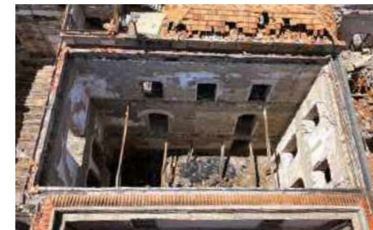
Imagem mostrando a ausência dos telhados após o desabamento / Image showing the absence of roofs after the collapse.

Before the fire, they were located on the ground floor of the palace, together with the collections of the Geology and Paleontology Department (DGP). They suffered not only from the fire, but also from the collapse of the upper floors and from the rains that occurred in the following months.