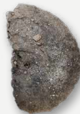
Amonita, parente das lulas atuais e símbolo da Sociedade Brasileira de Paleontologia, foi encontrado íntegro, apresentando basicamente alterações na coloração / Ammonite, a relative of the current squids and symbol of the Brazilian Society of Paleontology, was found intact, presenting basically changes in color.

Os fósseis que compõem as coleções paleontológicas foram formados, em sua grande maioria, pela permineralização, o que significa que sua composição é basicamente mineral. Este fator conferiu maior resistência aos processos de destruição pelo qual passaram, fazendo com que uma grande parte destes fósseis sobrevivesse ao sinistro.