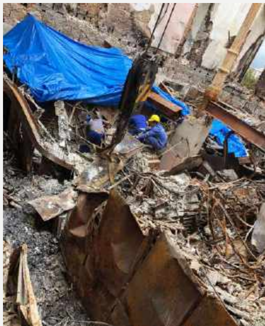
Área das coleções Paleontológicas após o incêndio / Area of the Paleontological collections after the fire.