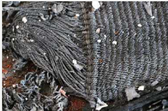
Remanescentes de trançado e de material de acondicionamento encontrados em mapoteca da reserva técnica / Remnants of braiding and of packaging material found in the map library of the technical reserve.