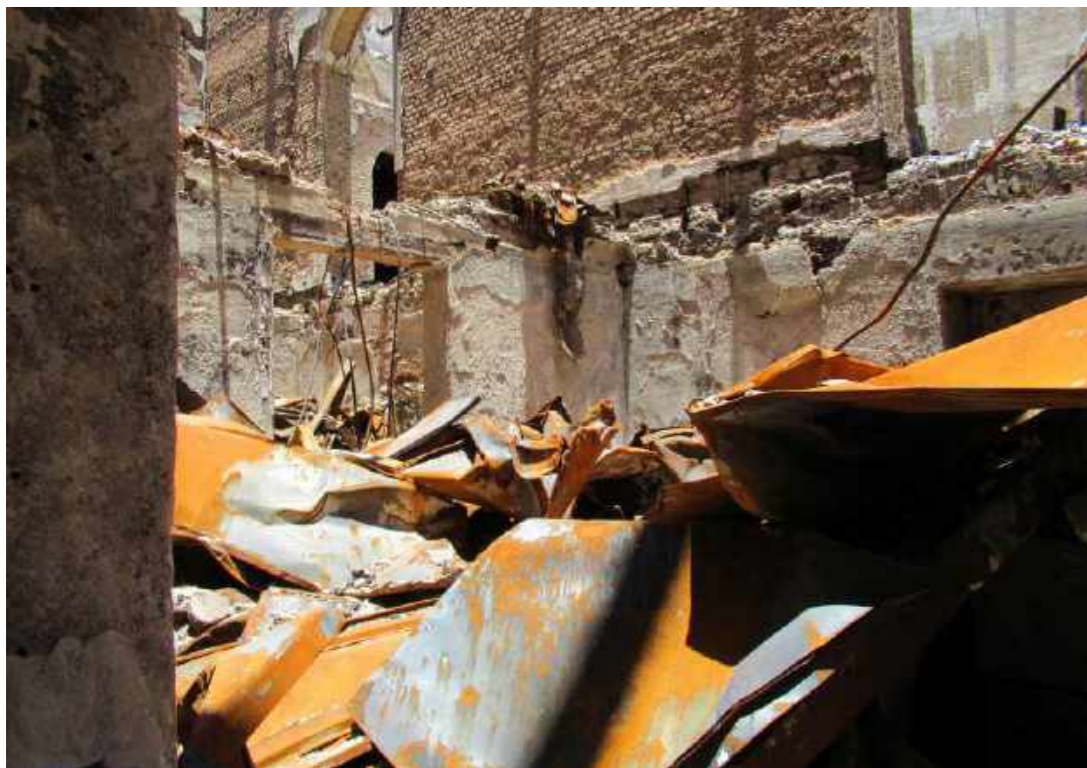
Caminho totalmente obstruído para chegar ao que sobreviveu da Reserva Técnica de Antropologia Biológica / Totally obstructed path to get to what survived from the Technical Reserve of Biological Anthropology.