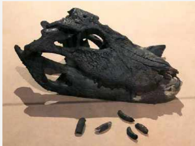
Crânio e mandíbula de jacaré-açu que fazia parte do acervo expositivo do Museu Nacional e resistiu ao incêndio apresentando alteração, principalmente, na coloração de sua superfície / Skull and jaw of a black caiman that was part of the exhibition collection of the National Museum and resisted the fire, showing alteration in the color of its surface mainly.

The loss of a significant share of the zoological collections that were in the palace has a huge impact on the materiality of the object. However, most of them were in the process of digitizing images of the specimens and associated data (date and place of collection, etc.). This data can be accessed in open databases, which allows a glimpse of their importance and helps to perpetuate this information for future generations. Such digitized information from the collection that resisted the fire and from other zoological collections that were not affected because they were outside the palace will perpetuate research and knowledge of the world's biodiversity.