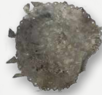
Abebés. Objeto ritual de Oxum. Rio de Janeiro. Século XIX. Liga metálica. Resgatados da Sala Kumbukumbu / Abebés. Ritual object of Oxum. Rio de Janeiro. 19th century. Metal alloy. Rescued from the Kumbukumbu room.

In the exhibition “Pacific Cultures” were some of the oldest collections of the National Museum, formed after the Opening of the Ports, in 1808. Some of them were gifts of representatives from nations and kingdoms when they landed in Rio de Janeiro. Those pieces were documents originating from the formation of the overseas empires and from diplomatic relations established since the end of the 18th century. From there, especially Lithics were rescued.