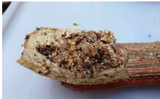
Cerâmica Pré-Colombiana com acúmulo de sedimentos / Pre-Columbian ceramics with sediment accumulation.

“Ao resgatar esse objeto de cerâmica pré-colombiana, que estava dentro de um dos armários da Reserva Técnica, pude observar um acúmulo de terra em uma de suas extremidades, onde nasceu um pequeno brotinho. Ao vê-lo, me emocionei muito, pois tive o sentimento de que nem tudo estava perdido. Naquela frágil plantinha, a vida renasceu, e nela vi surgir a esperança do renascimento do Museu Nacional.”