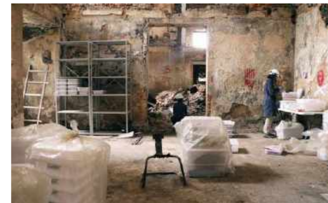
Escavação da Reserva Técnica de Antropologia Biológica / Excavation of the Technical Reserve of Biological Anthropology.