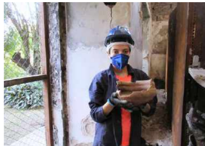
Retirada de vasilhame Tupiguarani fragmentado e com faixas paralelas em vermelho características e preservadas. Coleção Arqueologia Brasileira / Removal of Tupi-Guarani fragmented pot with characteristic and preserved parallel strips in red. Brazilian Archaeology Collection.