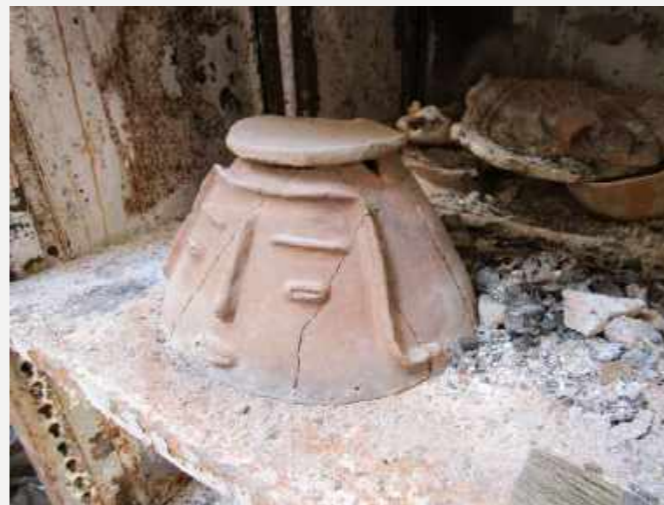
Tampa de urna funerária Maracá, proveniente da foz do Amazonas / Lid of a Maracá funerary urn, from the mouth of the Amazon River.

Ceramic statuettes and pots from the Amazonian and Pre-Columbian collections with figures of humans, animals and many other beings – such as Tapajonic caryatids, Marajoara hair extensions, Maracá grimaces or Mochicas pots – seemed to react to rescue activities, in the most different expressions. It is the case of two figures with hands on face and open mouth, who seemed to scream for help in the rubble.