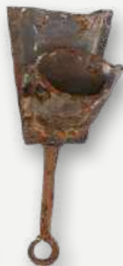
Agogô. Instrumento musical. Bahia. 1940. Metal. Uso religioso. Resgatado da Sala Kumbukumbu / Agogô. Musical instrument. Bahia. 1940. Metal. Religious use. Rescued from the Kumbukumbu room.