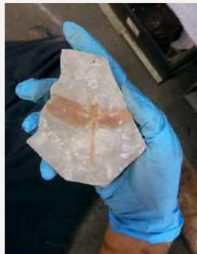
Libélula fossilizada em placa de calcário preservada após o incêndio / Fossilized dragonfly on a limestone plate preserved after the fire.