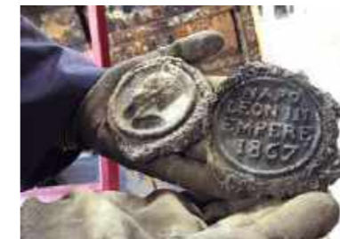
Brasões cunhados em lava provenientes da erupção do vulcão Vesúvio / Coats of arms minted in lava, from the eruption of the volcano Vesuvius.