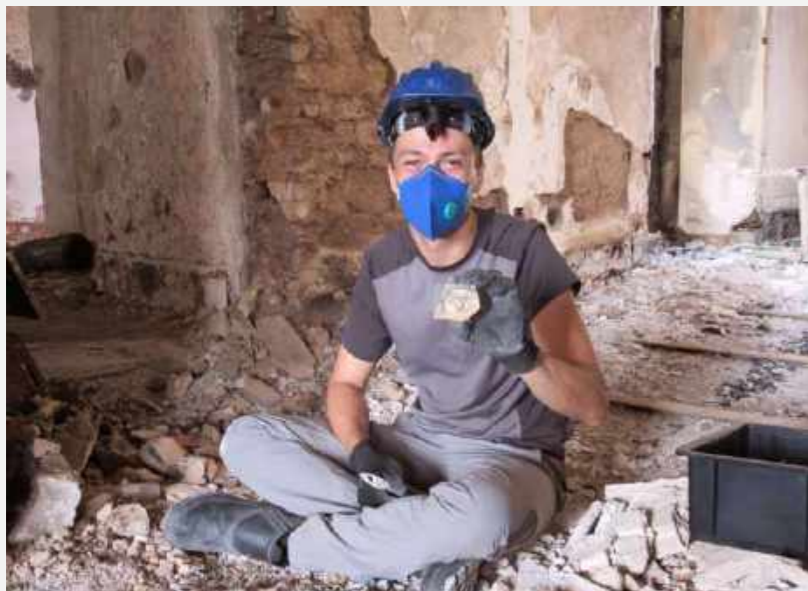
Em meio aos escombros, no corredor de exposição Culturas Mediterrâneas a recuperação de fragmento de cerâmica pintada. Coleção Imperatriz Teresa Cristina / Amid the rubble, in the Mediterranean Cultures exhibition corridor, the recovery of a fragment of painted ceramic. Empress Teresa Cristina Collection.