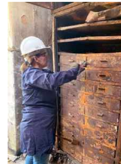
Resgate das rochas da coleção de petrografia / Rescue of rocks from the petrography collection.