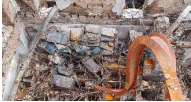
Vista aérea da Reserva Técnica da Arqueologia do Palácio, atingida pelos escombros, mas com peças preservadas / Aerial view of the Archeological Technical Reserve of the Palace, affected by the rubble but with preserved pieces.