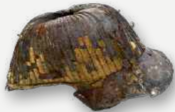
Kabuto. Capacete. Japão. Parte de armadura de guerreiro, classe samurai / Kabuto. Helmet. Japan. Part of a warrior armor, samurai class.