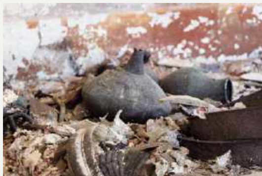
Artefatos de bronze em exposição na sala Pompeia. Coleção Imperatriz Teresa Cristina / Bronze artifacts on exhibition in the Pompeii room. Empress Teresa Cristina Collection.