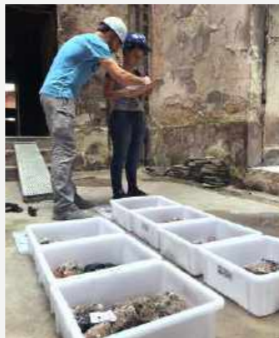
Fósseis resgatados e armazenados em caixas sendo registrados pela equipe do Núcleo de Resgate / Fossils rescued and stored in boxes being registered by the Rescue Center team.