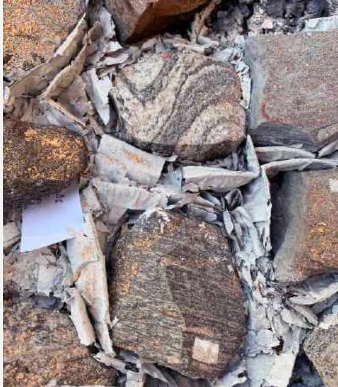
Rochas da coleção de petrografia / Rocks from the petrography collection.