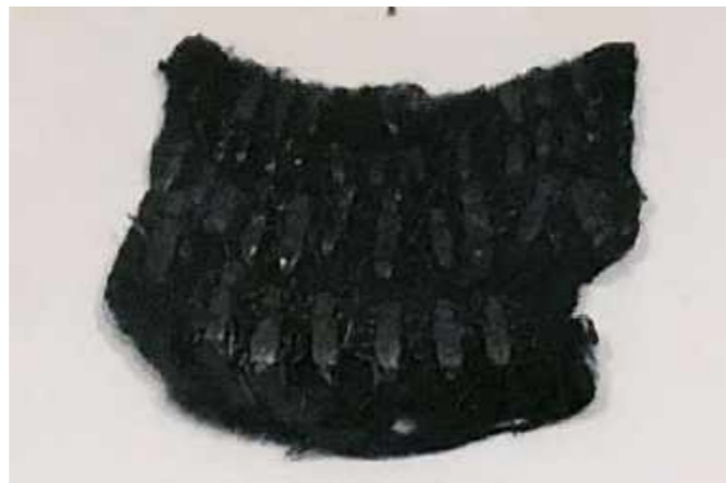
Manta de algodão com insetos carbonizados que foram transportados pelo vento para casas próximas ao Palácio do Museu Nacional / Cotton blanket with charred insects that were carried by the wind to houses near the Palace of the National Museum.

That same year, the fire tragically hit the collections that were still in the Palace, mainly from Entomology and Arachnology sections, which were almost entirely in that place. Considering the extent and intensity of the fire, the irreparable loss of all material was believed.