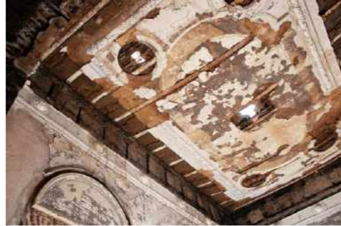
Teto da sala Culturas do Pacífico, que não ruiu ou desabou / Ceiling of the Pacific Cultures room, which did not crumble or collapse.

Na exposição “Culturas do Pacífico” estavam algumas das coleções mais antigas do Museu Nacional, formadas após a Abertura dos Portos, em 1808. Algumas delas foram presentes de representantes de nações e reinos quando aportavam no Rio de Janeiro. As peças eram documentos da formação dos Impérios ultramarinos e das relações diplomáticas estabelecidas desde o final do século XVIII. Daí foram resgatados especialmente líticos.