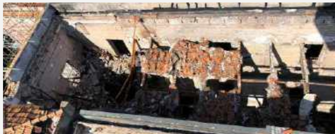
Vista aérea da reserva técnica das coleções etnológicas / Aerial view of the technical reserve of the ethnological collections.