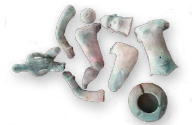
Ritxòkò. Boneca karajá. Fragmentos retirados da exposição Karajá: plumária e etnografia / Ritxòkò. Karajá doll. Fragments rescued from the exhibition “Karajás - Feathers and Ethnography”.

Na sala “Os Karajá: plumária e etnografia” era possível conhecer o trabalho de Heloísa Fénelon sobre arte e o artista na sociedade karajá, ver objetos plumários e as ritxòkò, bonecas tradicionalmente feitas por mulheres karajá e cujo modo de fazer é patrimônio nacional. Os objetos plumários lamentavelmente desapareceram. Já as ritxòkò felizmente foram localizadas.