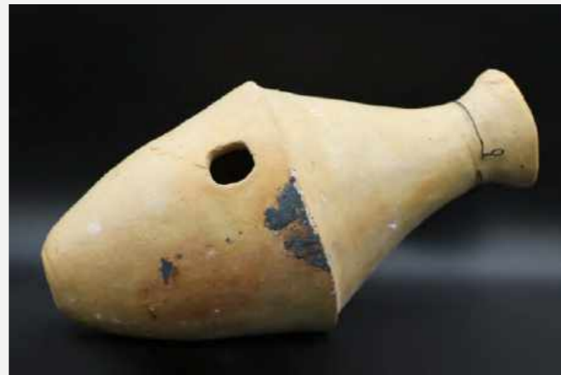
Instrumento musical indígena. Resgatado da reserva técnica das coleções etnológicas / Indigenous musical instrument. Rescued from the technical reserve of the ethnological collections.

“O trabalho da equipe de resgate garantiu que os objetos remanescentes continuassem a revelar a diversidade sociocultural e histórica da formação nacional.”