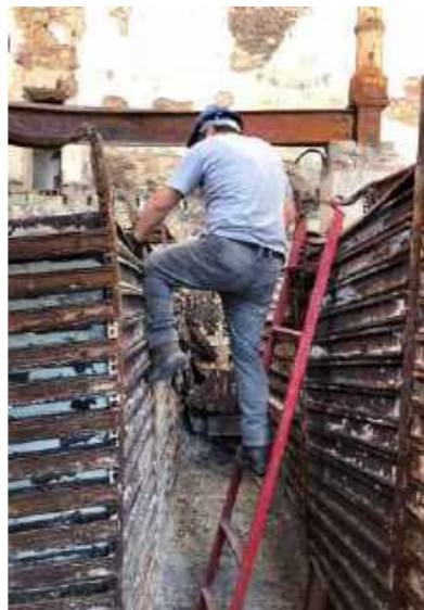
Resgate da coleção de mineralogia / Rescue of the Mineralogy collection.

“...eu fiquei feliz e ao mesmo tempo, senti uma sensação de dever cumprido. Sabe quando você está no meio do caos e acontece uma coisa boa? Foi esse o sentimento.”