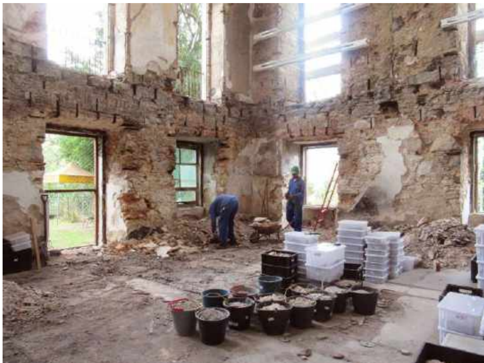
Reserva Técnica de Arqueologia do Palácio / Technical Reserve of Archeology in the Palace.