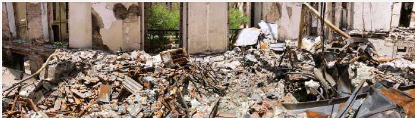
Sala que continha uma exposição de esqueletos de vertebrados, que incluía um esqueleto de baleia. É mostrado o grau de destruição e os escombros do andar superior / Room that used to house an exhibition of vertebrate skeletons, which included a whale skeleton. It is possible to see the degree of destruction and the debris of the upper floor.