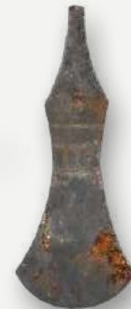
Lâmina de machado. Senegal. Século XIX. Em exibição na sala Kumbukumbu / Axe blade. Senegal. 19th century. On exhibition in the Kumbukumbu room.