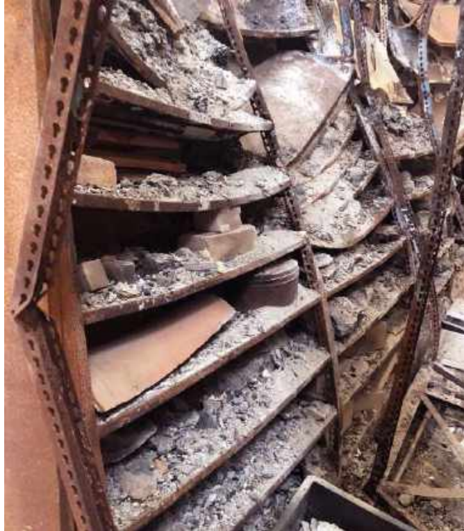
Armários compactadores que abrigavam os itens da coleção de geologia econômica / Compactor cabinets that housed the items of the Economic Geology collection.

“Sirvam os erros do passado como estímulo para os homens que hoje trabalham. Os Museus auxiliam a escrever a História e a História cria a consciência de um Povo.”