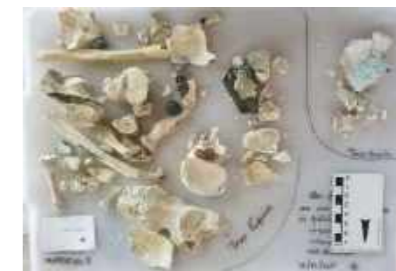
Coleta minuciosa de cada parte dos armários do laboratório / Thorough collection of each part of the laboratory cabinets.

Os ossos são o último testemunho que permanece, muitas vezes, de pessoas que foram silenciadas em vida. Em seus corpos, vemos parte de sua vida codificada. É no bojo da Antropologia Biológica que nos lançamos em busca de ler seu passado, pistas de uma vida, distante, e ainda tão próxima em uma história da humanidade que abraça a todos nós.