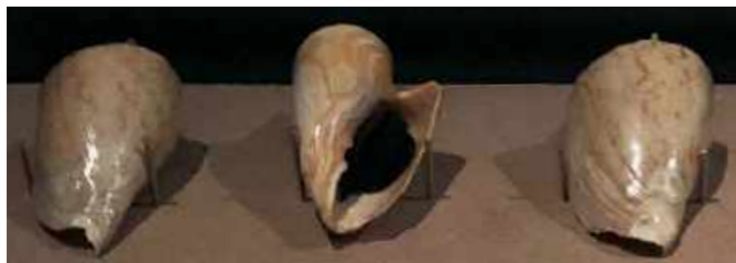
Gastrópodes marinhos pertencentes a coleção de Malacologia resgatados íntegros após o incêndio / Marine gastropods belonging to the Malacology collection, rescued intact after the fire.

Juntamente aos esforços do Núcleo de Resgate, vários exemplares das diversas coleções foram encontrados posteriormente e estão em processo de análise dos danos e da recuperação. Os espécimes que mais resistiram ao incêndio foram aqueles formados por estruturas mais rígidas, como as conchas. O esqueleto da baleia, que durante muitos anos esteve em exposição, foi parcialmente resgatado, porém sofreu muito com o calor, apresentando uma condição muito frágil e extremamente fragmentada.