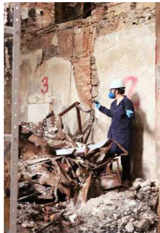
Resultado da queda do terceiro andar / Result of the collapse of the third floor.