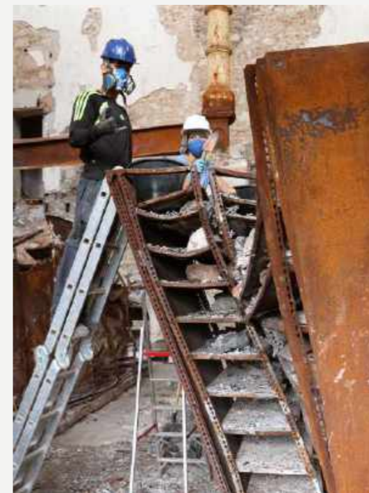
Acesso ao topo dos armários compactadores retorcidos, para o resgate dos minerais / Access to the top of the twisted compactor cabinets, for the rescue of the minerals.

Para além da natureza do acervo, algumas coleções tiveram a sorte de estarem em locais abrigados da queda dos andares superiores, como os armários que guardavam a coleção de petrografia. Esses armários revelaram um número surpreendente de acervo recuperado durante o resgate.