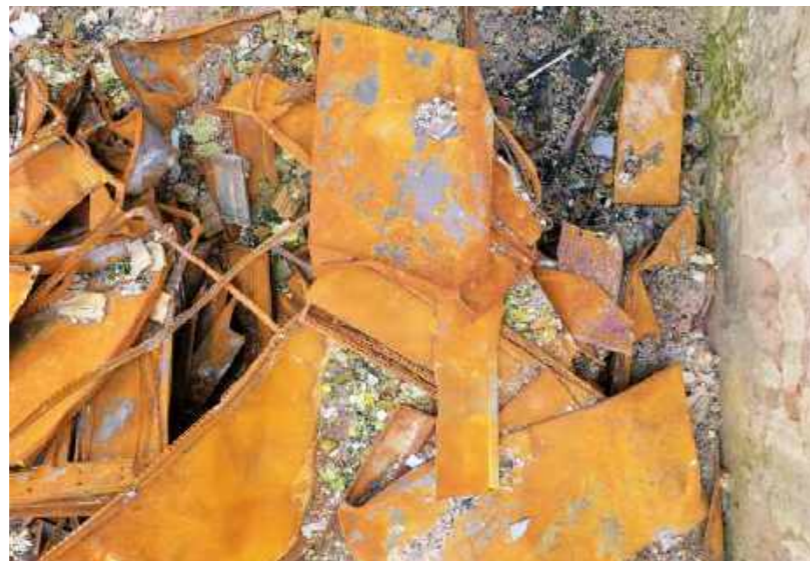
Resultado da queda do terceiro andar / Result of the collapse of the third floor.