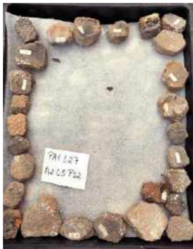
Placas que compunham a carapaça de um gliptodontídeo. A maioria perdeu o número de seu registro que ficava assinalado na própria peça / Plates that made up the carapace of a glyptodontid. Most of them lost the registration number marked on the piece itself.

Notamos que muitos dos números de tombo, escritos diretamente nas peças e que as identificavam, não se preservaram e isto gera problemas para o reconhecimento do acervo. Para as coleções em que os materiais tinham as suas localizações registradas nos bancos de dados, o trabalho de reconhecimento será facilitado. Porém, para aquelas que não possuem essas informações, a identificação das peças será um verdadeiro trabalho de detetive.