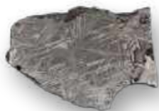
Meteorito Carlton / Meteorite Carlton.