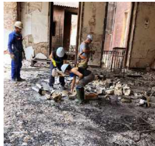
Equipe resgatando o esqueleto da baleia / Team rescuing the whale skeleton.

In addition to the efforts of the Rescue Center, several specimens of the various collections were later found and are now under the process of damage analysis and recovery. The specimens that most resisted the fire were those formed by more rigid structures such as shells. The skeleton of a whale, previously on exhibition for many years, was partially rescued, but suffered a lot from the heat and presents a very fragile and completely fragmented condition.