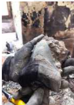
Dente de tubarão fóssil encontrado íntegro apresentando apenas alteração na coloração / Fossilized shark tooth found intact and presenting change in coloration only.