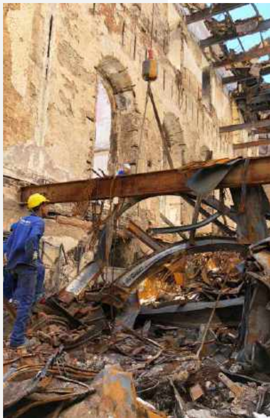
Área onde desabou a reserva técnica das coleções etnológicas / Area where the technical reserve of ethnological collections collapsed.