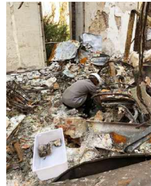
Área onde o esqueleto da baleia estava soterrado pelos escombros do andar superior / Area where the whale skeleton was buried under the rubble of the upper floor.

In the second half of the 20th century, the construction of the annex building Alípio de Miranda Ribeiro allowed the relocation of part of the Zoology collection to new facilities, following an institutional plan to expand and adapt the spaces of the National Museum. Upon completing 200 years in 2018, almost all the collections of Vertebrates (except for specimens that were on exhibition) and part of the Entomology collections (a small part of the order Diptera) and Invertebrates (about 50%) were in their own buildings.