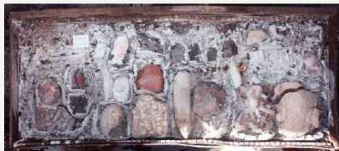
Gaveta com exemplares da coleção de mineralogia / Drawer with specimens from the mineralogy collection.

Como as coleções geológicas são constituídas por uma tipologia diversa, o acervo mostrou também diferentes comportamentos de resistência ao calor do fogo e de exposição à chuva nos dias subsequentes. Em uma fase posterior, os danos sofridos por esses materiais serão analisados, mas a alegria proporcionada pelos materiais que resistiram, já é, de alguma forma, reconfortante.