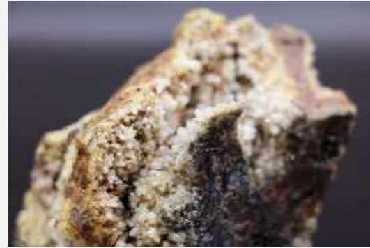
Geodo de quartzo impregnado por fuligem / Soot-impregnated quartz geode.

Rochas e minerais carregam em si histórias únicas de formação, seja por cristalização de um magma, sedimentação ou metamorfismo. O mesmo para meteoritos, que resistem às altas temperaturas durante a entrada na atmosfera e ao impacto na Terra. Além do histórico de formação, as amostras das coleções geológicas do Museu Nacional agora registram o próprio incêndio como parte de sua história.