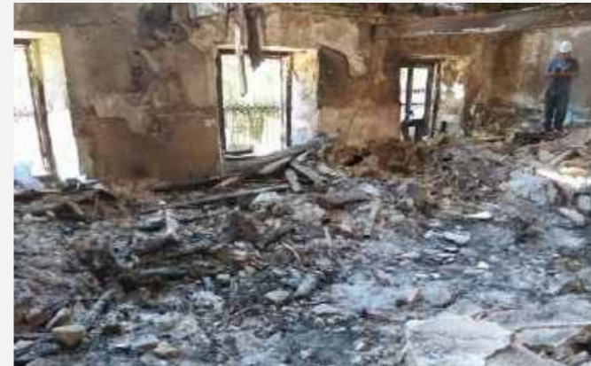
Área onde desabou a exposição Kumbukumbu: África, memória e patrimônio / Area where the exhibition “Kumbukumbu: Africa, memory and heritage” collapsed.

A Exposição “Kumbukumbu: África, memória e patrimônio” apresentava objetos dos povos africanos e de seus descendentes no Brasil que evidenciavam o protagonismo de africanos, brasileiros e europeus, ao longo dos séculos XIX e XX, nas relações diplomáticas, escravidão, conflitos coloniais, projetos civilizatórios e estudos científicos. A coleção tem importância histórica por ser um dos acervos africanos mais antigos no Brasil. A equipe do resgate localizou os objetos constituídos de metal, grafite e marfim, parcial ou inteiramente preservados.