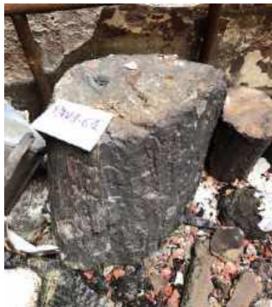
Tronco fossilizado que se preservou praticamente sem alteração / Fossilized trunk that remained preserved and almost unchanged.