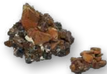
Fragmentos cerâmicos amalgamados formando um volume de difícil identificação / Amalgamated ceramic fragments forming a volume of difficult identification.