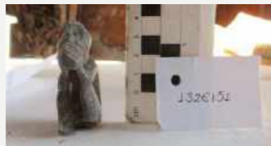
Figura antropomorfa em lítico identificada nas escavações na Reserva Técnica do Palácio / Anthropomorphic lithic figure identified in the excavations in the Technical Reserve of the Palace.

Estatuetas e vasilhas em cerâmica das coleções Amazônica e Pré-colombiana com figuração de humanos, animais e muitos outros seres – como cariátides Tapajônicas, apliques Marajoara, caretas Maracá ou vasilhas Mochicas – pareciam reagir às atividades de resgate, nas mais diferentes expressões. É o caso de duas figuras com as mãos no rosto e a boca aberta, que pareciam gritar por socorro em meio aos escombros.