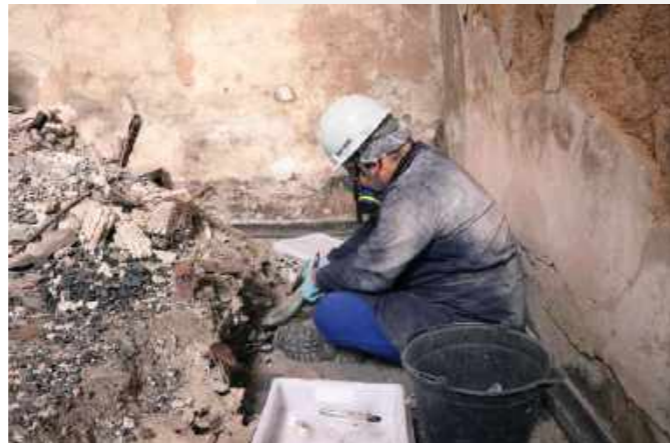
Escavação da Reserva Técnica da Antropologia Biológica / Excavation of the Technical Reserve of Biological Anthropology.