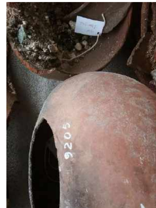
Vasilhame cerâmico, exemplo de peça resgatada com número de tombamento. Coleção Arqueologia Brasileira / Ceramic pot, example of a rescued piece with tipping number. Brazilian Archaeology Collection.