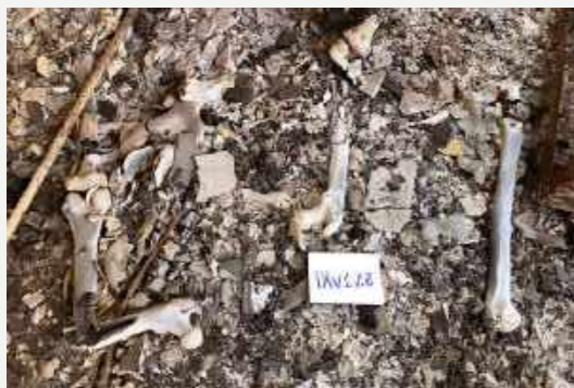
Ossos de vertebrados preservados após serem expostos ao incêndio / Vertebrate bones preserved after being exposed to fire.

Na segunda metade do século XX, a construção do prédio anexo Alípio de Miranda Ribeiro permitiu a realocação de parte do acervo de Zoologia para novas instalações, seguindo um planejamento institucional de ampliação e adequação dos espaços do Museu Nacional. Ao completar 200 anos em 2018, a quase totalidade das coleções de Vertebrados (exceto por exemplares que estavam na exposição) e parte dos acervos de Entomologia (uma pequena parcela, parte de Diptera) e de Invertebrados (cerca de 50%) encontravam-se em edificações próprias.