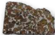
Meteorito Imilac / Meteorite Imilac.