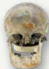
Não só recuperar, mas remontar e registrar / Not only recover, but reassemble and record.