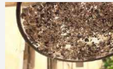
Detalhe de uma das peneiras / Detail of one of the sieves.

“Enquanto alguns falavam ‘que tinham coisas mais importantes para fazer frente à destruição’, que ‘não valia a pena’ ou mesmo ‘para abandonar o museu como estava’, a Equipe de Resgate encarou o pós-incêndio, oferecendo todo o possível - e um pouco mais.