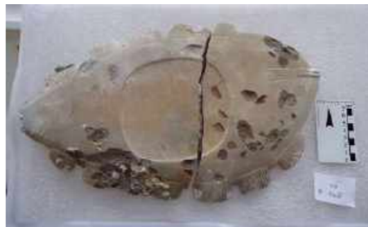
Escultura lítica em forma de peixe-zoolito. Coleção Arq. Brasileira / Lithic sculpture in the form of a zoolite fish. Brazilian Archaeology Collection.