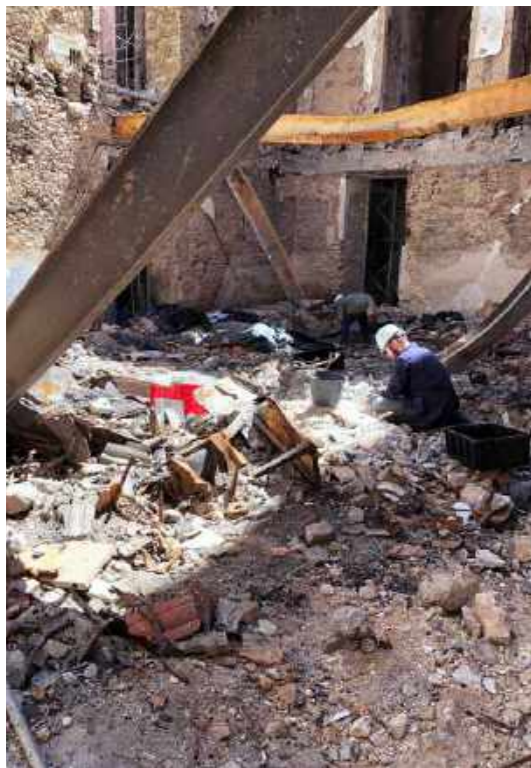
Trabalho de escavação na coleção Egípcia / Excavation work in Egyptian collection.