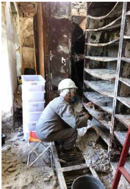
Coleta de peças íntegras e fragmentadas na Reserva Técnica de Palácio / Collection of intact and fragmented pieces in the Technical Reserve of the Palace.