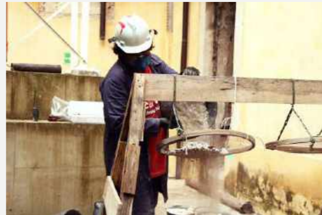
Peneirando... / Sieving.