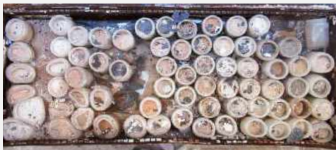
Gaveta com exemplares da coleção de sedimentologia / Drawer with specimens from the sedimentology collection.