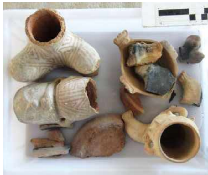
Cerâmicas antropomorfas da região Amazônica. Coleção Arq. Brasileira / Anthropomorphic ceramics from the Amazon region. Brazilian Archaeology Collection.