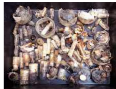
Espécimes da coleção de Carcinologia encontrados com as etiquetas de identificação e os exemplares preservados / Specimens from the Carcinology collection found with preserved identification tags.

“Retornar à sala da Coleção de Mollusca, aos escombros incendiados dos armários, resgatar uma pequena fração dos espécimes da outrora magnífica coleção, e nas suas etiquetas chamuscadas ainda reconhecer a grafia de pessoas que dedicaram décadas para a construção desse acervo. Esse é o legado fundamental do resgate na Coleção de Mollusca: indicar que o caminho de reconstrução é de esforço diário e contínuo, que novas décadas serão necessárias para a criação de um novo acervo, que essa é a missão que cabe àqueles que hoje devem recomeçar essa trilha.”