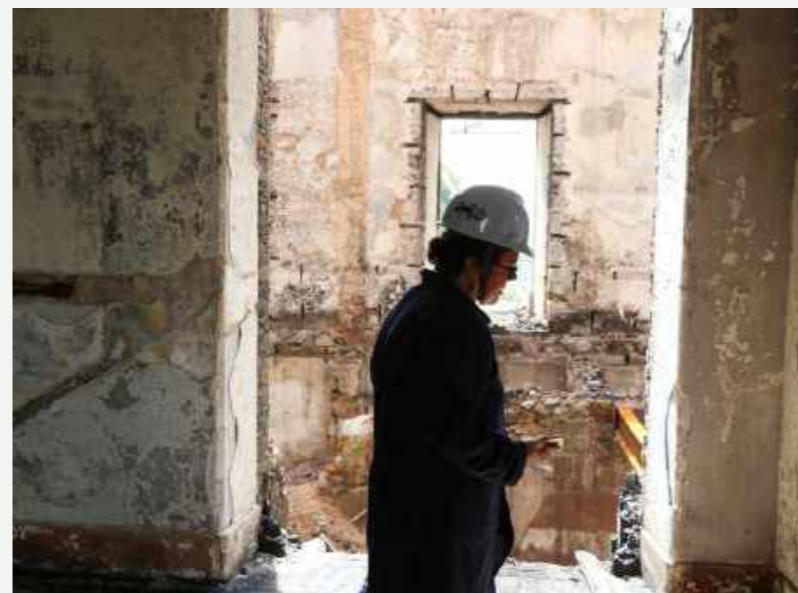
O Museu ainda está aqui. E nós também! / The Museum is still here. And so are we.

“Algumas semanas após o incêndio, encontrei uma colega que havia retornado de uma viagem recente. Ela chorava em frente ao prédio consumido pelo fogo e me perguntava, emocionada, por que isso tinha acontecido conosco. Sem pensar no peso das palavras, respondi: porque nós somos as pessoas que podemos reconstruir essa instituição. De certa forma, esse é o espírito do Resgate de Acervos do Museu Nacional.”