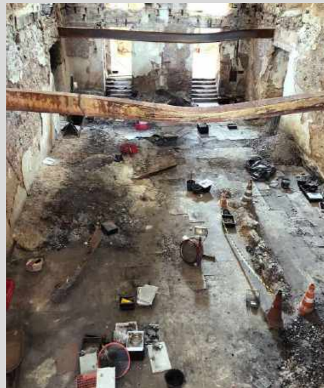
Vista área da finalização dos trabalhos de resgate da coleção Egípcia / Aerial view of the completion of works in the Egyptian collection.

“O Resgate foi uma missão! Exigiu muito de nós, tanto física quanto emocionalmente. O trabalho foi árduo, mas a cada dia a esperança era renovada. Eu não conhecia o Palácio por inteiro, o Resgate permitiu que se conhecesse esse passado, com os olhos do futuro: um futuro de reconstrução.”