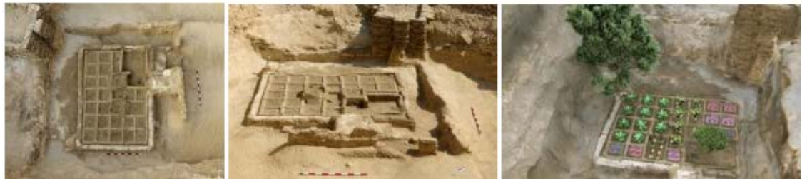
Jardín funerario de la necrópolis de Tebas (Luxor) descubierto por el equipo de investigación del Proyecto Djehuty del CSIC. Reconstrucción del jardín.

De forma particular se han revisado dos aspectos: su caracterización como obra de arte y su potencial como fuente de conocimiento histórico. En relación con la primera cuestión se ha comprobado que es factible establecer una taxonomía muy completa del jardín desde el punto de vista del análisis artístico. En cuanto a la información histórica que estos contienen, parece difícil obviarla. Ponemos como ejemplo uno de los primeros jardines de los que tenemos constancia y cuyo descubrimiento data de hace apenas un año: el jardín funerario de una tumba de la dinastía XII localizado en la necrópolis de Tebas.