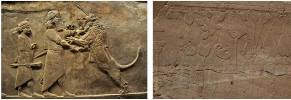
Relieve del palacio de Asurbanipal en Nínive: cacería de leones (S. VII a.C.) (CC)Wikipedia. Relieve del Akhmenu de Tutmosis III en Karnac: figuras botánicas (S. XV a.C.) Imagen de Aroa Velasco.

Pero el jardín no solo representa con eficacia el concepto de poder, sino que permite mostrar el lugar que se quiere ocupar en la sociedad: los jardines se convierten en espacios para la ostentación en primer lugar de las clases privilegiadas más próximas al poder, pero también de la burguesía, que se ocupará de hacer visible y tangible su ascenso social. Duby (2001), señala que la riqueza material funcionaría en realidad como reflejo de la virtud o excelencia moral inherente de su poseedor. Una lógica que, como muestran estudios como el de García-Entero (2004) o multitud de escritos de época clásica (Marcial, Plinio), funciona en los jardines romanos que se convirtieron en uno de los escenarios fundamentales para el desarrollo de la vida social. El trabajo de Gracia (2007) muestra también que las familias japonesas que disponían de medios económicos se construían sus propios paraísos. Otros ejemplos paradigmáticos los encontramos en Europa a partir del renacimiento, como la Villa Quaracchi, propiedad del banquero Giovanni Rucellai, de la que destacamos la elección de su ubicación pues, como afirman Taffuri (2012) y, según este, el propio Rucellai, fue edificada en lo alto para ser admirada inmersa a sus jardines. O la Villa d'Este, donde el protagonismo concedido al jardín resulta claro.