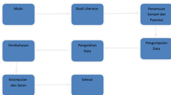
Gambar 1 Rancangan Penelitian

Metode penelitian adalah langkah – langkah penelitian yang terstruktur, ekonomis, dan sesuai dengan tujuan penelitian sehingga data – data yang didapatkan adalah data yang akurat. Berikut ini merupakan tahapan dari rancangan penelitian.