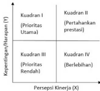
Gambar 2 Kuadran Kartesius