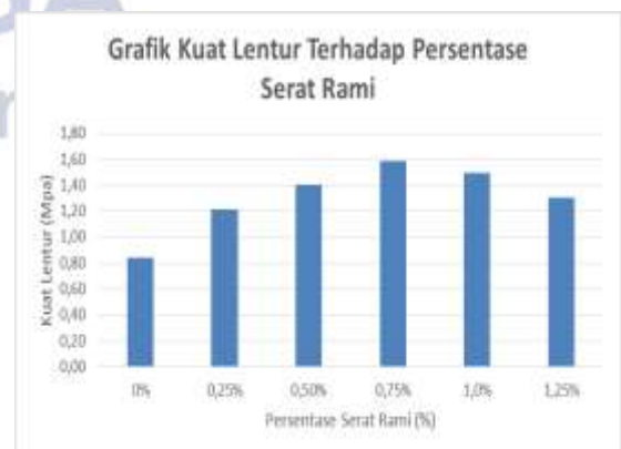
Gambar 2. Grafik Kuat Tekan Rata-Rata Beton Dengan Penambahan Serat Rami

Hasil data dari pengujian kuat lentur balok rata-rata pada benda uji beton dengan serat rami dapat dilihat pada gambar dibawah ini.