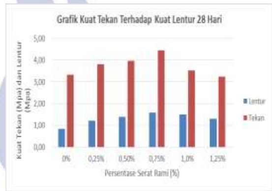
Gambar 5. Grafik Hubungan Kuat Tekan Terhadap Kuat Lentur

Hasil data hubungan kuat tekan terhadap kuat lentur pada benda uji beton dengan serat rami dapat dilihat pada gambar dibawah ini.