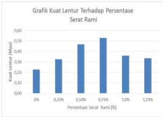
Gambar 3. Grafik Kuat Tekan Rata-Rata Beton Dengan Penambahan Serat Rami

Hasil data dari pengujian kuat lentur balok rata-rata pada benda uji beton dengan serat rami dapat dilihat pada gambar dibawah ini.