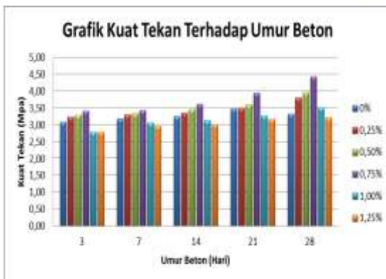
Gambar 4. Grafik Hubungan Kuat Tekan dengan Waktu Pengeringan

Hasil data hubungan kuat tekan dengan waktu pengeringan pada benda uji beton dengan serat rami dapat dilihat pada gambar dibawah ini.