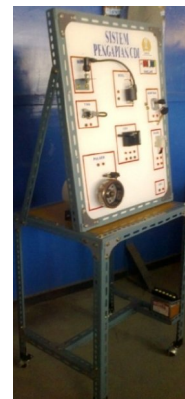
Gambar 3. Trainer sistem pengapian CDI .