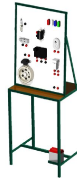
Gambar 2. Rancangan awal trainer sistem pengapian CDI .

diperlihatkan pada gambar 2, sedangkan media yang sudah jadi diperlihatkan pada gambar 3.