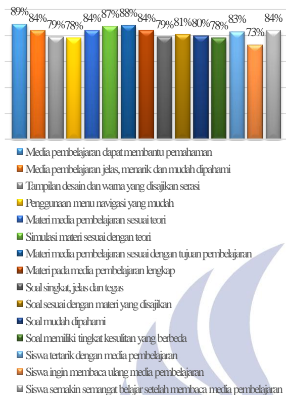
Gambar 3. Diagram batang hasil respon siswa