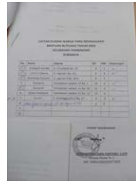
Gambar 5. Daftar Warga yang Mengajukan

Penyokongan dalam tahap ini adalah dukungan dan bantuan yang diberikan oleh pihak-pihak terkait. Pihak terkait ini dapat berasal dari instansi swasta maupun pemerintah. Penyokongan yang diberikan oleh Kelurahan Tambaksari kepada calon penerima yakni melalui pembentukan skala prioritas.