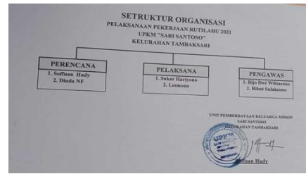
Gambar 2. Struktur Organisasi

“Gini mas, jadi sebelum dilakukan pembangunan, kita rapat koordinasi serta sosialisasi program dulu ke warga soal UPKM ada beberapa juga belum tau serta bikin skala prioritas mana-mana saja yang akan dijadikan progres pembangunan pada tahun berjalan atau tahun tersebut karena memang banyak yang mengajukan tetapi kita keterbatasan dana dan personil dari upkm tadi hanya 6 orang sehingga untuk membangun kita menyesuaikan dana anggarannya kemudian orangnya kemudian satuan pelaksanaanya juga dan cuaca. Cuaca sangat mempengaruhi juga dalam pelaksanaan pekerjaan pembangunan”. (Surabaya, 23 Februari 2021)