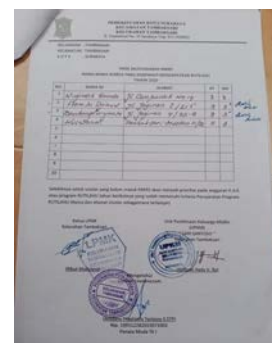
Gambar 6. Hasil Musyawarah KKRKS

“Kita rapatkan bersama Ketua RW, Ketua UPKM, Ketua LPMK, serta Dinas Sosial. Kita bangun skala prioritas misalkan yang usulkan 10 sedangkan anggarannya hanya 5, kita benar- benar melakukan observasi ke lapangan untuk melihat rumah-rumah mana saja yang memang sangat layak untuk dilakukan pembangunan rutilahu.” (Surabaya, 23 Februari 2021)