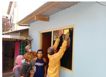
Gambar 7. Pemasangan stiker

Pengawasan ini juga sekaligus mengevaluasi perkembangan pembangunan dengan melihat kondisi fisik bangunan yang sedang dikerjakan. Tahap selanjutnya yaitu serah terima kepada pemilik rumah sebagai tanda sudah dilakukan pengecekan dan tandatangan pada berita acara dan penempelan stiker sebagai bukti telah mendapatkan program rutilahu.