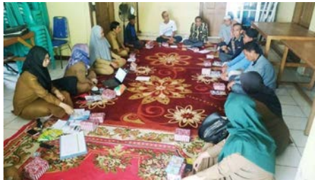
Gambar 1. Sosialisasi Program

Selain dari permasalahan pemahaman mengenai permodalan, permasalahan pengerjaan yang lama karena cuaca yang menghambat juga dirasakan oleh penerima perbaikan rumah tidak layak huni (rutilahu). Hal ini menyebabkan berbagai alat-alat dan bahan bangunan yang digunakan untuk membantu waktu proses pengerjaan perbaikan rumah jadi rusak dan menghambat waktu. Waktu pengerjaan memang sudah ditentukan sebelumnya yaitu selama 19 hari. Padahal waktu tersebut juga sangatlah penting guna membantu para pekerja untuk menyelesaikan perbaikan rumah secara tepat waktu.