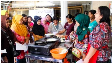
Gambar 3. Pelatihan Tata Boga

Berdasarkan wawancara yang telah dilakukan oleh Kelurahan Tambaksari selain memberikan perbaikan rumah, juga memberikan penguatan kepada masyarakat dengan pelatihan. Hal ini bertujuan agar masyarakat dapat menciptakan inovasi dalam mengembangkan skillnya karena selama ini masyarakat di Kelurahan Tambaksari belum mampu menciptakan produk sendiri guna mendapat pemasukan tambahan. Dengan memberikan pelatihan untuk menciptakan inovasi-inovasi tentang makanan. Masyarakat di Kelurahan Tambaksari mulai mendapatkan pelatihan masak (tata boga). Dengan begitu dapat menambah pendapatan mereka.