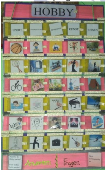
Gambar 1. Media Pembelajaran Bruderkarte