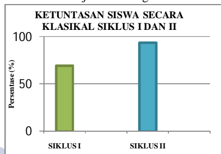
Diagram 3 Ketuntasan Siswa secara Klasikal Siklus I dan II

Kemudian peningkatan ketuntasan hasil belajar siswa pada siklus I dan II tersaji dalam diagram berikut :