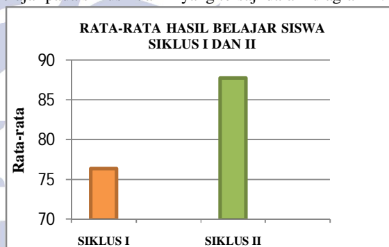
Diagram 4 Rata-rata Hasil Belajar Siswa Siklus I dan II

Selain itu juga terjadi peningkatan rata-rata hasil belajar pada siklus I dan II yang tersaji dalam diagram 4: