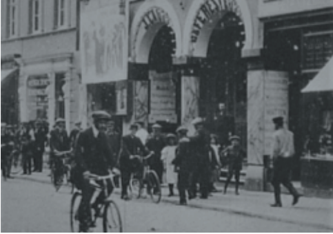
Beeld uit 16mm kopie van de 35mm film 'Eene beëddiging bij het Tweede Regiment Huzaren te Venlo'. Jos Caubo, 1911 (Limburgs Museum, collectie bewegend beeld, objectnummer 0092).

professionele activiteiten nog moeilijk te maken valt. Bijvoorbeeld registraties uit 1911 die gemaakt werden in Venlo en uit 1912-1914 gemaakt in Maastricht. In de periode van circa 1903 tot 1910 zijn in Limburgse steden eveneens korte films opgenomen door Willy en Albert Mullens, exploitanten van reisbioscoop Albert Frères. Die zijn helaas verloren gegaan. 32