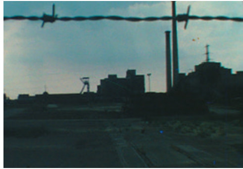
Beeld uit de super-8 geluidsfilm 'Wanneer wordt het beter, deel 1'. Jos Reinders, 1977 (Limburgs Museum, collectie bewegend beeld, objectnummer 2562).

Het lijkt erop dat politiek en maatschappelijk geëngageerde audiovisuele producties in de jaren zeventig en tachtig vooral ontstonden en vertoond werden in de creativiteits-, vormings- en jongerencentra in Limburg. Net als in meer plaatsen in Nederland behoorde het vertonen van films tot de activiteiten van deze sociaal-culturele instellingen. Zeker als het ging om (internationale) films met een maatschappelijke of politieke boodschap waarover gediscussieerd kon worden. De geschiedenis van het