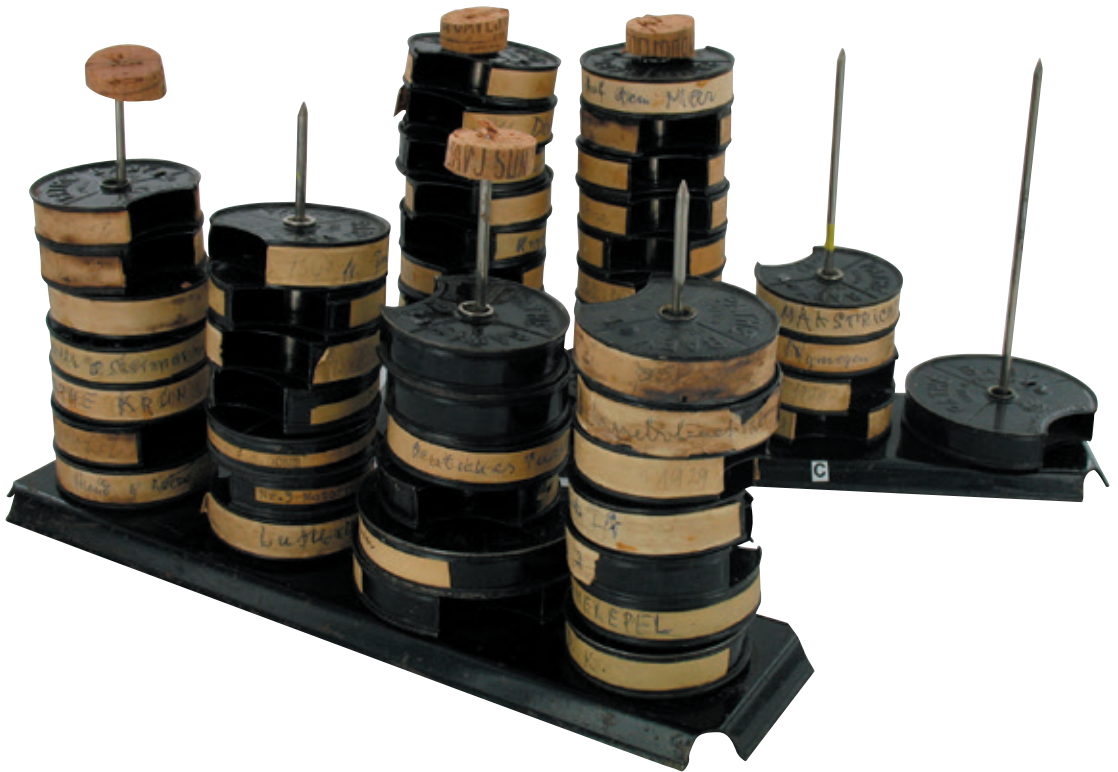
Geïmproviseerd opbergsysteem van de vroegste Pathé 9,5mm familiefilmpjes van fotograaf Werner Mantz. Ca. 1930 (Limburgs Museum, collectie bewegend beeld, objectnummer L25575).

niet-familiefilms in de nalatenschap is meteen een historisch document: de hiervoor al genoemde beelden die hij maakte enkele dagen na de bevrijding van Maastricht op 14 september 1944. In 1972 stapte Mantz op super-8 over.