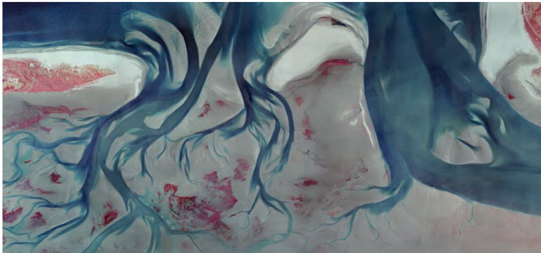
Abb. 5: Color-Infrarot-Bild (CIR) der niederländischen Küste östlich von Schiermonnikoog, 2018