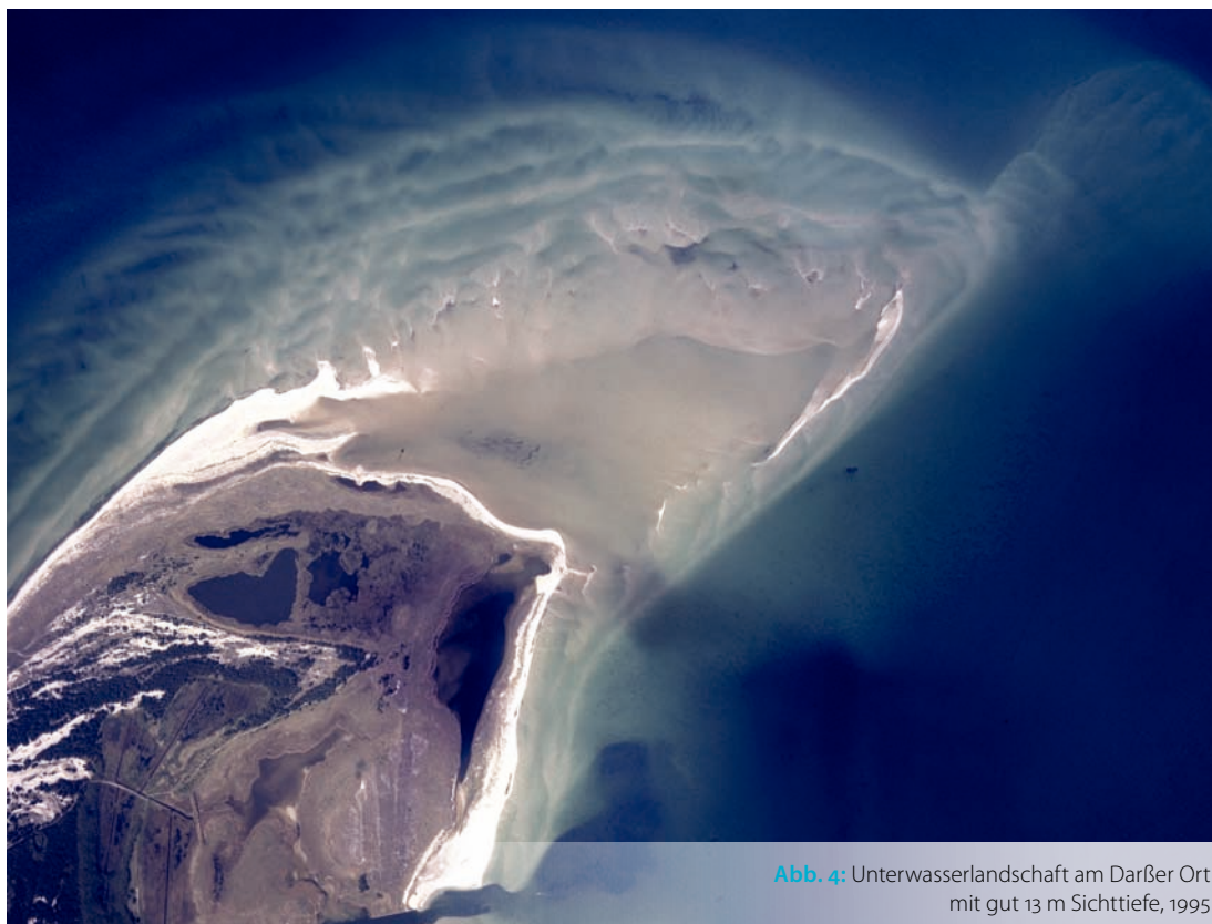
Abb. 4: Unterwasserlandschaft am Darßer Ort mit gut 13 m Sichttiefe, 1995

ist die jahrzehntelange Beziehung zur Deutschen Flugsicherung (DFS) zu nennen. Für die DFS führten wir ein Radarkarten-GIS zur Pflege und Distribution der Luftraum-Strukturdaten für alle Fluglotsen-Arbeitsplätze ein und entwickeln es seitdem ständig weiter. Für das Bundesland Hessen wird durch unsere Spezialisten die Entwicklung und Pflege der Geoverwaltung zur Berechnung der jährlichen EU-Agrarsubventionen durchgeführt. Jüngst wurden in Äthiopien große Softwareprojekte durchgeführt, die sich mit rechtssicheren Eigentumskatastersystemen für städtische und ländliche Bereiche beschäftigten. Daneben haben wir für hafentypische Daten und Prozesse das webbasierte GIS »Hansa GeoPort« entwickelt. Die Integration von Open-Source-Komponenten und die Möglichkeit zur Nutzung von Open Data spielen dabei eine große Rolle.