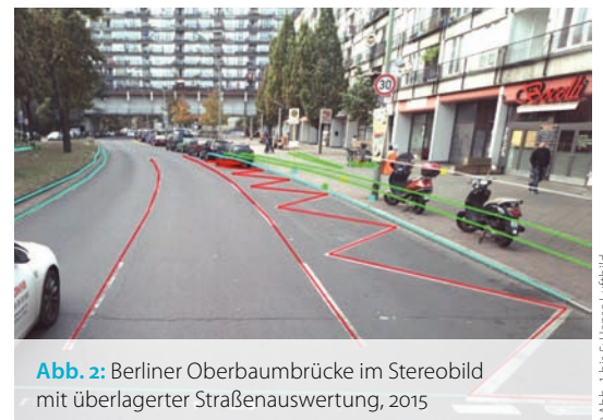
Abb. 2: Berliner Oberbaumbrücke im Stereobild mit überlagerter Straßenauswertung, 2015