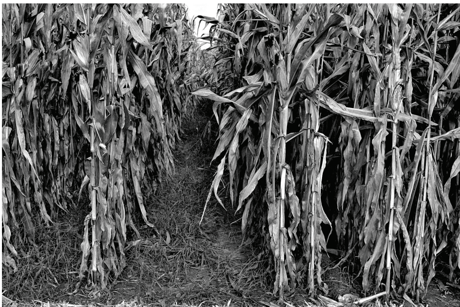
Slika 1. Standardna sjetve i sjetva u udvojene redove hibrida P0023 Figure 1 Standard sowing and sowing in twin rows of hybrid P0023