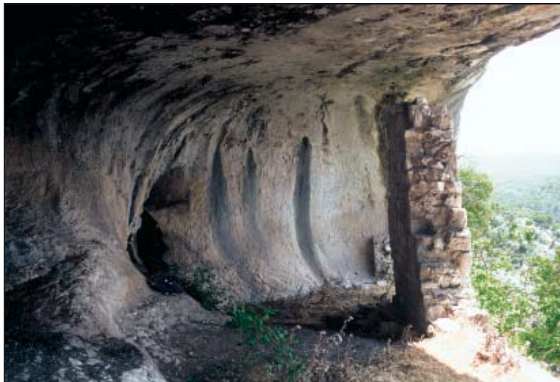
Unutrašnjost špilje s ostatkom zida

Otvor špilje okrenut je prema zapadu, širok 18 i visok 4 m, polukružnog oblika. Kameni zid, zidan mortom, sagrađen je 1-2 m iza prevjesnog otvora i bio je dug 12 m. Sada su vidljivi samo temelji zida i dio zida dug 3,5, visok 3,5 i debeo oko pola metra. U zidu su s unutarnje strane vidljiva udubljenja, koja su vjerojatno služila za usađivanje greda. Na tim su gredama možda bile postavljene manje grede i das-