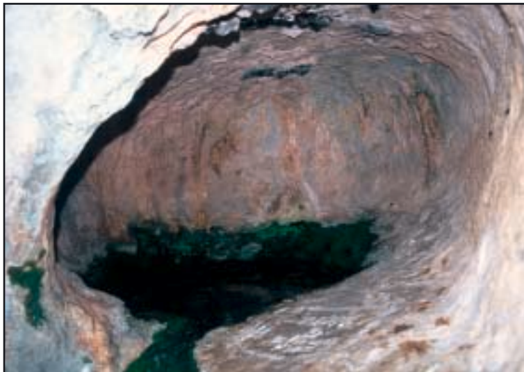
Lokvica vode u Opatjoj špilji