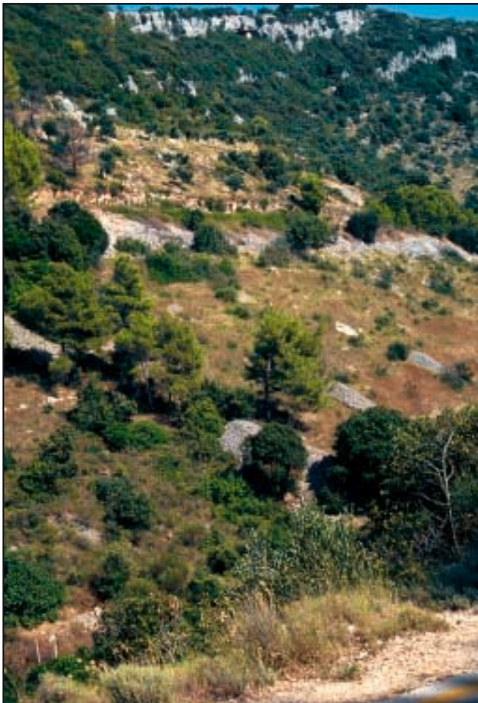
Pogled sa ceste na brdo Dučac u čijoj se vršnoj barijeri nalazi špilja

U sada dostupnoj literaturi špilju prvi spominje župnik iz Pučišća don Andrija Ciccarelli još 1802. U svom opisu otoka Brača, tiskanom u Veneciji na talijanskom jeziku, navodi da su na sjevernoj strani