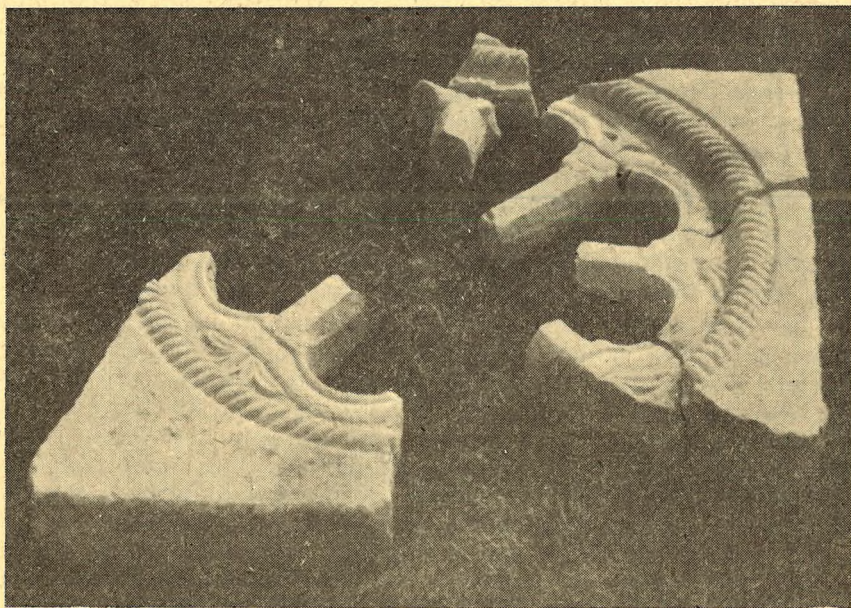
1. Ulomak rozetne tranzene sa sv. Atanasija u Lešku kod Tetova

U suvremenim priložima istorije umetnosti naroda Jugoslavije dosad nije bila posvećena pažnja odnosu umetničkih uticaja Primorja i Makedonije. Može se čak reći, da takvo pitanje u nauci nije ni bilo postavljeno