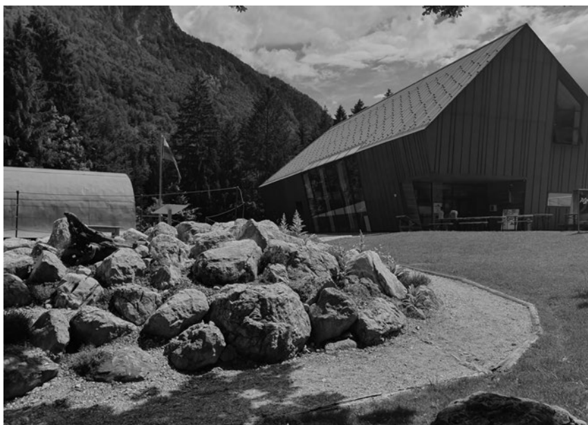
Slika 1: Slovenski planinski muzej v Mojstrani.

Da bi razširili védenje o tej problematiki, so ZRC SAZU Geografski inštitut Antona Melika, Gornjesavski muzej Jesenice oziroma njihova enota Slovenski planinski muzej, Občina Kranjska Gora, Planinska zveza Slovenije in Turistično društvo Dovje – Mojstrana organizirali posvet. Posvet je potekal 20. junija 2020 v prostorih Slovenskega planinskega muzeja v Mojstrani (slika 1).