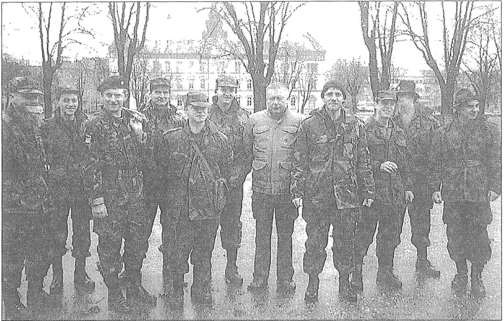
Skupina speleologa "Željezničara" pred odlazak iz Zagreba na bojišnicu 23.11.1991. godine

A group of cavers of the Caving club "Željezničar" before departure to battle-field.