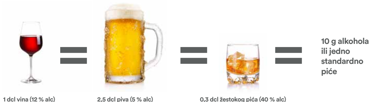
SLIKA 1. Usporedba volumena alkoholnih pića koji sadrže 10 g alkohola

Životna dob također je bitan faktor jer je potvrđeno da su ljudi stariji od 65 godina podložniji alkoholom izazvanoj ozljedi nego oni mlađe dobi (6). Žene imaju značajno viši rizik za razvoj bolesti od muškaraca za bilo koju količinu konzumiranog alkohola, a mogući uzročnik povećane osjetljivosti žena je smanjen gastrični metabolizam alkohola zbog smanjene količine alkoholne dehidrogenaze (7). Različite vrste droga, ali i duhanski proizvodi povećavaju njegovu hepatotoksičnost, te na taj način utječu na razvoj bolesti. Rizični faktor čini i prehrana bogata masnoćama, posebice kod ljudi s prekomjernom tjelesnom težinom, što je dokazano populacijskim studijama (8). Konzumacija alkohola uz hranu smanjuje, dok proteinsko-energetska malnutricija, kao i kronična infekcija HBV-om ili HCV-om, dovodi do brže progresije bolesti do stadija ciroze i razvoja hepatocelularnog karcinoma (9).