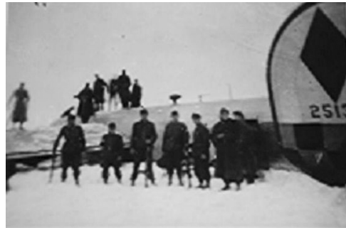
Sl. 3. Jedina fotografija srušenog Liberatora snimljena je po dolasku vojnika sila osovine iz Ludbrega.

Ukupan broj proizvedenih bombardera B-24 svih inačica, najčešće kamufliranih sa standardnim maslinastosivim gornjim površinama i neutralnosivim donjim površinama, nevjerovatnih je 18 188 komada, čime do danas drži epitet najmasovnije proizvedenog borbenog zrakoplova u povijesti SAD-a. Valja istaknuti kako je B-24 srušen kod Ludbrega 1945. godine među najrjeđim bombarderima ovog tipa, proizvedenima od strane tvornice Douglas u Tulsi (Oklahoma), kojega je od ostalih, između ostalog, razlikovala srebrna boja oplate. 3