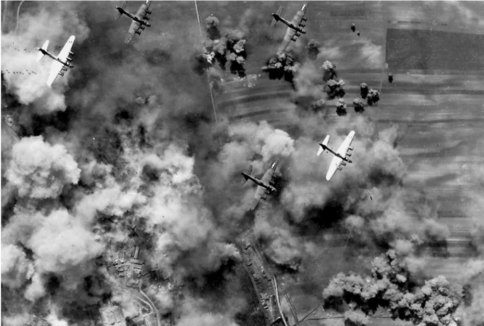
Sl. 1. Bombardiranje Beča tijekom Drugog svjetskog rata.

Riječ je o dosjeu koji se otvarao u roku 48 sati nakon što je određeni zrakoplov bio službeno proglašen uništenim ili izgubljenim.