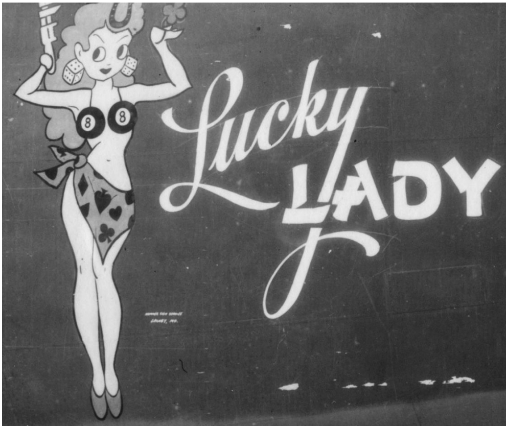
Sl. 7. Detalj s prednjeg dijela aviona s pin-up djevojkom u prvom planu, po uzoru na većinu tadašnjih američkih vojnih zrakopova.

Moguće je svakako da je sličnih događaja na ovom području bilo i više, no danas je teško doći do objektivnih saznanja iz prve ruke. Vrlo su rijetki živi svjedoci tih događanja, s obzirom da broje devedesetak godina života. S druge strane, tijekom istraživanja vezanog uz ovaj rad, primjetna je tajnovitost pojedinih svjedoka, a koji se i nakon 75 godina ustručavaju pričati o turbulentnim ratnim vremenima.