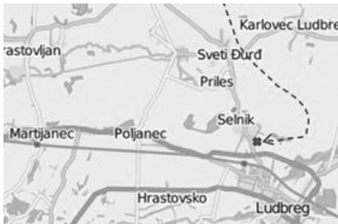
Sl. 2. Sretna dama unatoč iskakanju posade imala je meko prizemljenje na snježnoj oranici kod groblja u Selniku (100 m sjeverno od današnjeg raskrižja podravske magistrale s cestom Ludbreg – Prelog).