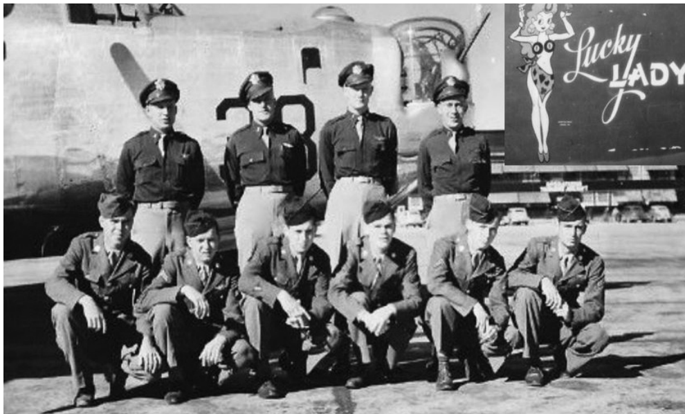
Sl. 6. Posada Sretne dame ispred svog bombardera u prosincu 1944. godine.

upozoravao medicinske sestre: Pa zar ne čitate novine, njen muž je nestao u akciji, dajte joj bebu kad god poželi. Stoga je Nancy grčila kćer i šaputala joj o njezinu hrabrom i lijepom ocu. Obecala je svojoj bebi da će otac uskoro biti doma.