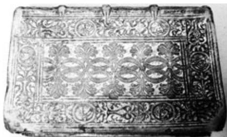
Sl. 4. Artis Notariatus Sive Tabellionum : Libri Duo ..... Lugduni, 1556. (10)