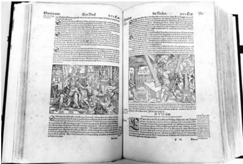
Sl. 3. [BIBLIA, das ist die ganze Heilige Schrift Teutsch ...], [Franckfurt am Mayn, 1565. (1564.)] (54)