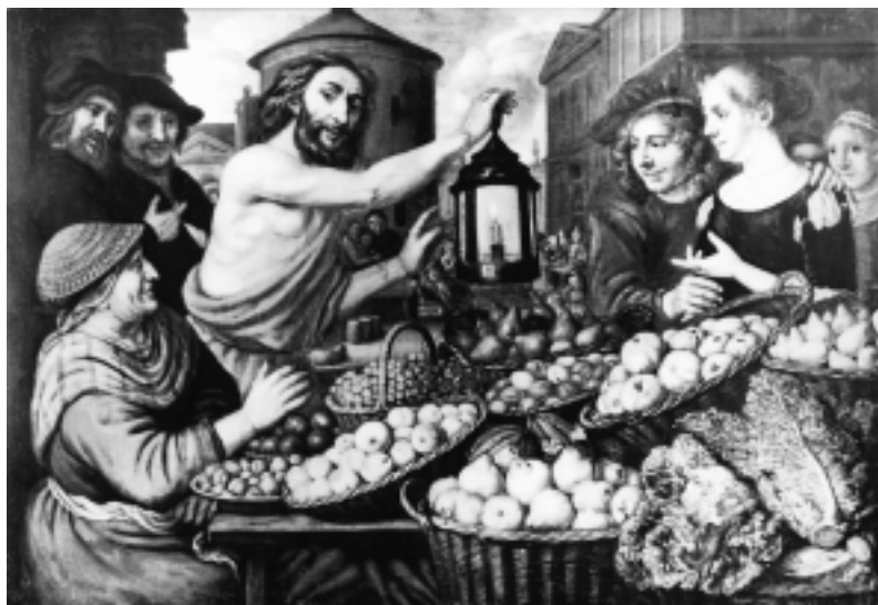
3. Jan Victors, »Diogenes Hominem quero«, sinještaj nepoznat

3 Jan Victors, »Diogenes Hominem quero«, present location unknown