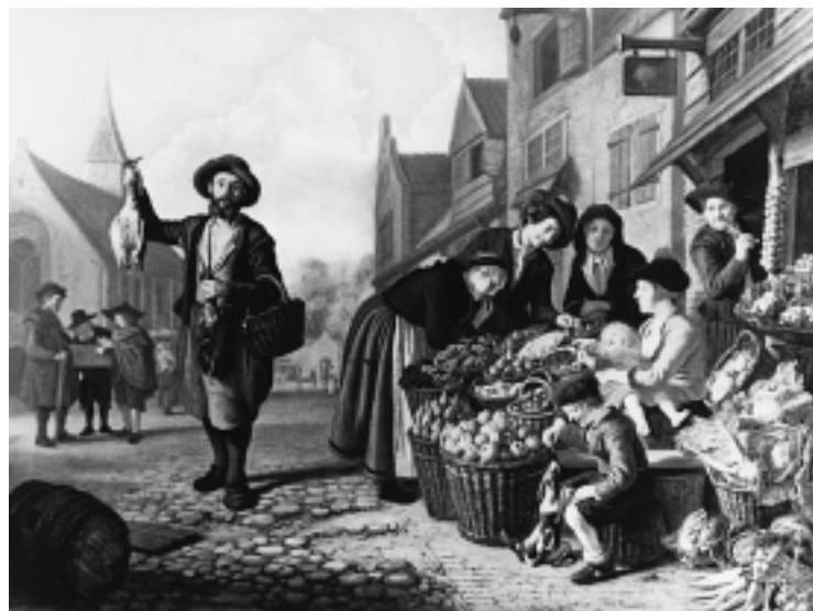
6. Jan Victors, »Muzikant na tržnici«, nekad Beč, Galerija St. Lucas 6 Jan Victors, »Street Musician at the Market«, formerly in Vienna, St Lucas Gallery