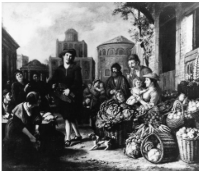
5. Jan Victors, »Prodavaonica povrća i prodavač peradi«, Haag, Rijksdienst Beeldende Kunst (B 629), na posudbi u Strasburškome muzeju 5 Jan Victors, »Vegetable Shop and Poultry Vendor«, The Hague, Rijksdienst Beeldende Kunst (B 629), loaned to the Strasbourg Museum