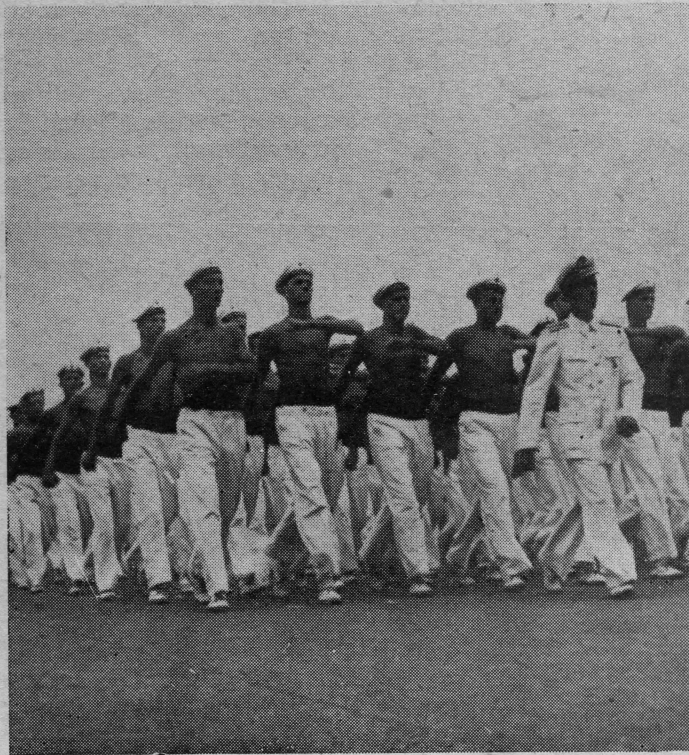
Mornari u maršu

• Prvi Maj je naš, svih nas, najradosniji dan.