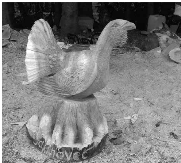
Slika 2. Skulptura »Tetrijeb gluhan« Fig. 2 The sculpture »Wood grouse«

razvijanju te što se iz godine u godinu festival odvija sve uspješnije.