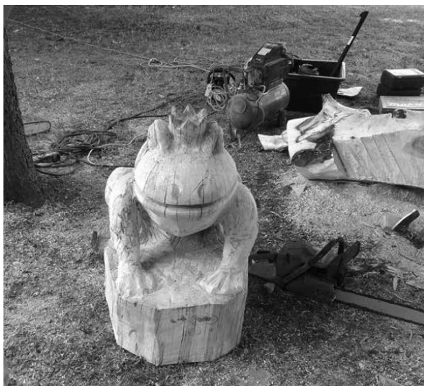
Slika 3. Skulptura »Žabac kraljević« Fig. 3 The sculpture »The frog prince«