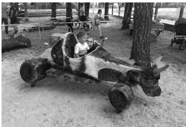
Slika 4. Najbolja skulptura po mišljenju publike »Formula Bullmobil« Fig. 4 The best sculpture in the opinion of the audience »Formula Bullmobile«

bolji kipar glavne skulpture glasovima publike i stručnim odabirom žirija u sastavu: