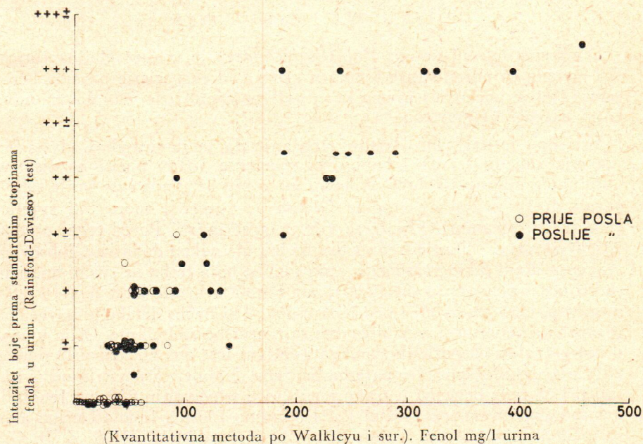
Sl. 2. Rezultati Rainsford-Daviesovog testa prema koncentraciji fenola određenog po Walkleyu i sur. u urinu prije i poslije posla kod radnika eksponiranih benzenu. Znak \pm odgovara intenzitetu boje standardne otopine od 50 mg fenola/l urina, znak +, 100 mg/l itd.

Slika 1 prikazuje razliku u intenzitetu boje jednog niza poznatih koncentracija fenola u urinu (sl. 1).