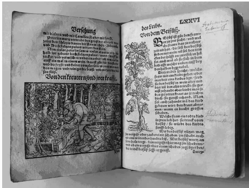
Sl. 3. Ryff, W. H., Practicir Buechlin/der Leibartznei., Mit Drei nutzlichen Registern/ Ernewert von H. Vualthero Riuiio, Medico., Zu Franckfurt., 1541. (Samobor: RIV-8 o -3)