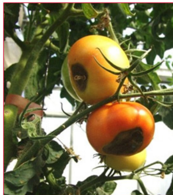
Slika 6. Nedostatak kalcija na plodu rajčice

Pri nedostatku kalcija listovi presadnica deformirani su i pojavljuju semeđužilne kloroze, a vrh rasta ubrzo odumire. Rubovi mladih listova starijih biljaka posmeđe, a neke međužilne zone požute. Ako nedostatak kalcija potraje, baza lista se suši i odumire. Vrh rasta i cvjetni pupovi uopće se niti ne razvijaju. Privremeni nedostatak kalcija može uzrokovati žučenje vrhova listova.