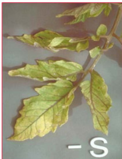
Slika 8. Nedostatak sumpora na listu rajčice

Nedostatak sumpora kod rajčice rijetko se javlja. Listovi postaju žutozeleni s ljubičastim žilama i peteljka. Peteljke se ne produljuju normalno pa lišće izgleda zbijeno i smanjeno. Zbog žućenja lišća, taj nedostatak lako se može zamijeniti s nedostatkom dušika. Međutim, pri nedostatku sumpora žućenje je puno ujednačenije na cijeloj biljci, uključujući i mlade listove. Ljubičasti tonovi češće se nalaze na naličju lista i imaju ružičastije nijanse nego pri nedostatku dušika. Od jačeg nedostatka sumpora razvijaju se lezije i nekrotične pjege na peteljci, a listovi postaju uspravni, često uvijeni i krhki (slika 8). Optimalna količina S u listu rajčice iznosi 0,29 % S u ST.