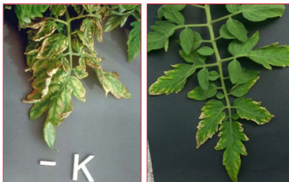
Slika 3. Nedostatak kalija na listu rajčice