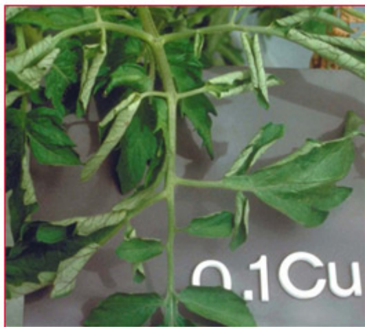
Slika 12. Nedostatak bakra na listu rajčice

Nedostatak bakra uvjetuje pojavu blage kloroze mladih listova i savijanje peteljke prema dolje, a liski prema gore. Sve to prati gubitak turgora u mladim listovima. Za jačeg nedostatka javljaju se nekroze, a na netom razvijenim listovima mogu se pojaviti blijedenja ibjelkasto sivi sjaj. Nedostatak bakra javlja se vrlo rijetko zbog upotrebe sredstava za zaštitu bilja (slika 12). Optimalna količina Cu u listu rajčice iznosi 6-12 \text{ mg kg}^{-1} \text{ Cu} u ST.