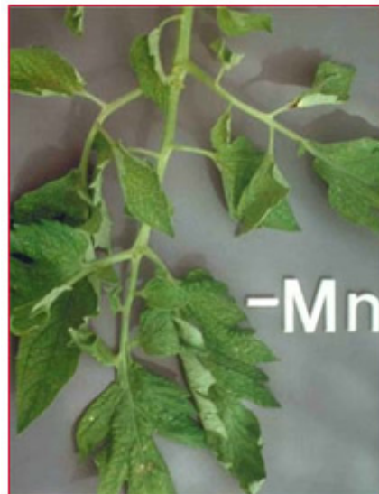
Slika 10. Nedostatak mangana na listu rajčice

Pri nedostatku mangana pojavljuju se blage međužilne kloroze mladih listova, najprije na manjim liskama. Početna faza nedostatka mangana može sličiti na nedostatak željeza. Kako se produljuje vrijeme nedostatka mangana, cijeli list postaje jednako žut (za razliku od nedostatka željeza, gdje je baza lista najžuća), nastaje na lišću metalni sivi sjaj i kasnije se razvijaju tamnije pjege i nekroze. Također je moguć razvoj ljubičastog sjaja na površini lista (slika 10). Optimalna količina Mn u listu rajčice iznosi 100\text{-}300 \text{ mg kg}^{-1} \text{ Mn} u ST, nedostatak <25 \text{ mg kg}^{-1} \text{ Mn} u ST.