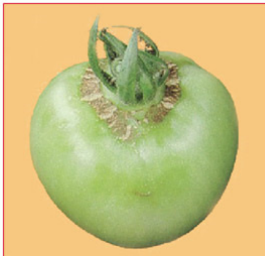
Slika 14. Nedostatak bora na listu rajčice Slika 15. Nedostatak bora na plodu rajčice

Nedostatak bora uglavnom se javlja kod mladih biljaka u obliku kloroze starijih listova, uz pojavu žutih i narančastih nijansi. Listovi i peteljke postaju krhki i plutasti. Pri jačem nedostatku bora javljaju se ljubičastosmeđe strukture unutar žila koje se najbolje vide kad se list okrene prema svjetlu. Plodovi mogu biti deformirani, preveliki i podijeljeni, a pojavljuju se plustaste tvorevine oko čaške (slike 14 i 15). Optimalna količina B u listu rajčice iznosi 40-80 \text{ mg kg}^{-1} \text{ B} u ST.