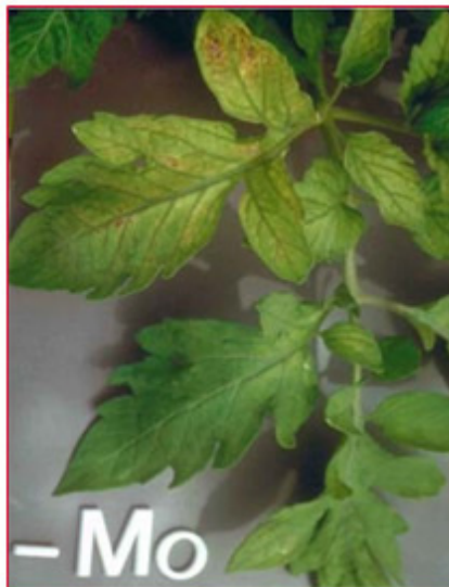
Slika 13. Nedostatak cinka na listu rajčice

Nedostatak molibdena u početku se očituje kao mrljasta međužilna kloroza listova, iako manje žile također postaju klorotične. Simptomi su slični simptomima nedostatka dušika, samo nemaju crvenkastoljubičaste nijanse na naličju lista. Rubovi listova uvijaju se prema gore. Pri jačem nedostatku, kloroze prelaze u nekroze te list odumire. Razvoj je cvjetova smanjen (slika 13). Optimalna količina Mo u listu rajčice iznosi 0,3-1,0 \text{ mg kg}^{-1} \text{ Mo} u ST.