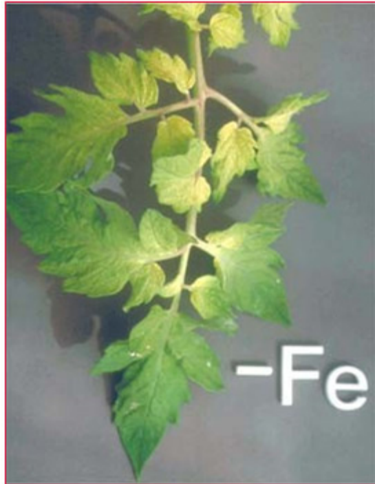
Slika 9. Nedostatak željeza na listu rajčice

Pri nedostatku željeza mladi listovi postaju svijetlo žuti i razvijaju međužilno žučenje koje se širi od baze lista prema vrhu. Ako se nedostatak ne nadoknađuje, kloroze prelaze u bijelu boju, a potom se razvijaju smeđe zone (nekroze) uz glavne žile i oko njih, osobito uz bazu liski i na peteljka. Do trenutka kada su listovi postali skoro potpuno bijeli, list će se oporaviti nakon folijarne primjene željeza. Najprije će se oporaviti žile, a potom ostali dio lista (slika 9). Optimalna količina Fe u listu rajčice iznosi 0,29 \text{ mg kg}^{-1} \text{ Fe} u ST.