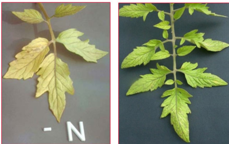
Slika 1. Nedostatak dušika na listu rajčice

Pri nedostatku dušika najprije stariji listovi postaju svijetlo zeleni, a kako nedostatak napreduje, cijeli list postaje jednolično žut (javlja se kloroza). Svijetlo crvene nijanse mogu se vidjeti na peteljka i lisnim žilama. Pri ekstremnom nedostatku listovi postaju žućkasto-bijeli, mogu se javiti ljubičaste pjege prije preranog odumiranja. Mladi vrhovi u početku su zeleni, ali kasnije i oni požute i imaju smanjeni šiljasti rast. Listovi su smanjene veličine, plojke pri bazi ne povećavaju se. Folijarnom gnojidbom nedostaci dušika vrlo brzo nestaju (slika 1.). Optimalna količina N u listu rajčice iznosi 3,5-5,5 % N u ST, nedostatak <2,5 % N u ST.