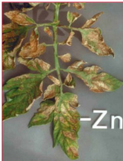
Slika 11. Nedostatak cinka na listu rajčice

Nedostatak cinka očituje se najprije na najmlađem lišću. Javljaju se kloroze (žućenje lista) u obliku međužilnih točaka koje kasnije prelaze u pjege, a u ekstremnim slučajevima i u nekroze. Žile lista cijelo vrijeme ostaju zelene (slika 11). Optimalna količina Zn u listu rajčice iznosi 30-80 \text{ mg kg}^{-1} \text{ Zn} u ST.