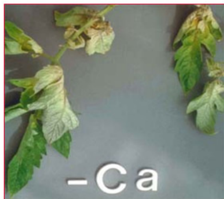
Slika 5. Nedostatak kalcija na listu rajčice