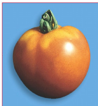
Slika 4. Nedostatak kalija na plodu rajčice