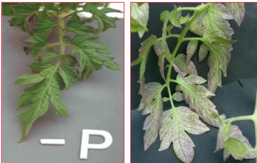
Slika 2. Nedostatak fosfora na listu rajčice

Nedostatak fosfora uvjetuje znatno smanjen rast, patuljsti rast. Nedostatak se najprije javlja na starijim listovima, njihovo naličje poprima ljubičaste nijanse, kasnije takvo postaje i lice lista te list prerano stari. Najmlađe lišće malo je ili srednje veliko, sivo-zelene boje. Ljubičaste nijanse javljaju se i na peteljka i stabljici, iako se mogu javiti i samo na peteljka. Kasnije se nasumično između žila javljaju nekroze na starijem lišću. Nedostatak fosfora može se javiti i pri niskim temperaturama iako fosfora ima dovoljno u tlu (slika 2). Optimalna količina P u listu rajčice iznosi 0,40-0,65 % P u ST.