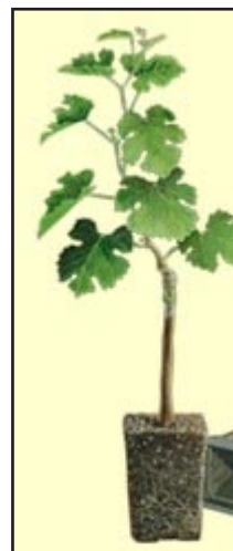
Slika 17. cijepov proizveden kartonažnom tehnikom

Uzgajaju se u zaštićenom prostoru u kontroliranim uvjetima (u početku 20°C, potom na 16-20°C, relativna vlaga zraka 85%) nakon toga se prenose na stalno mjesto. U zaštićenom prostoru redovita je zaštita od bolesti, a pod na kojemu se nalaze sanduci sa lončićima mora biti od čvrste podloge ili prekriven folijom radi sprečavanja rasta korova. Cijepovi su spremni za iznošenje van i sadnju na stalno mjesto kada korijen probije sjenku lončića.