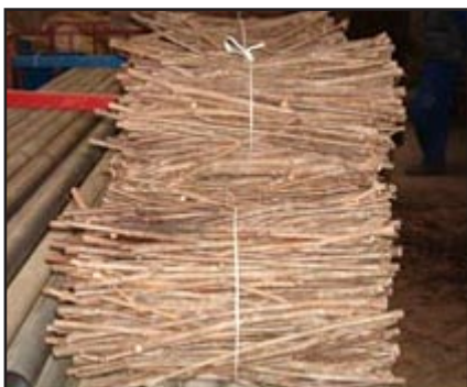
slika 2. reznice podloga

Reznice podloga vinove loze potrebno je skinuti iz matičnjaka u jesen nakon opadanja lišća jer je tada najveća koncentracija rezervne hranjive tvari u rozgvi, a i nema opasnosti od izmrzavanja ili isušivanja rozgve tijekom zime. Reznice se režu na oko 130 cm duljine, u proljeće se od svake reznice dobiju tri standardne reznice minimalno 30 cm. Na bazi reznice ostavi se dio internodija od 3 cm, a na gornjoj strani se reže u koso da ne bi došlo do zamjene polarnosti. Promjer reznica podloga za cijepljenje mjenog na sredini internodija mora biti minimalno za Vitis rupestris i njezne križance sa Vitis viniferom 6-12 mm, a za ostale vrste 6,5-12 mm.