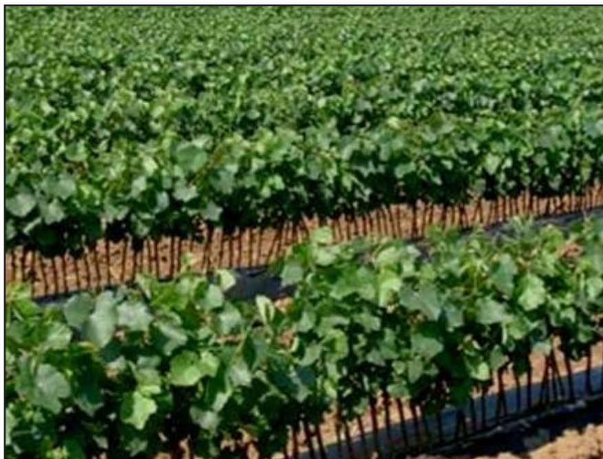
Slika 12. prporište

Prema potrebi cijepovi se u polju mogu prihranjivati 1-3 puta. Na propusnim tlima uslijed navodnjavanja može doći do ispiranja dušika, tako da je potrebno prihraniti sa 60-120 kg/N/ha, ali ne kasnije od konca srpnja inače bi mogli izazvati naknadni rast mladica koje bi potrošile hraniva na uštrb korijena, a ne bi stigle dozoriti do kraja vegetacije.