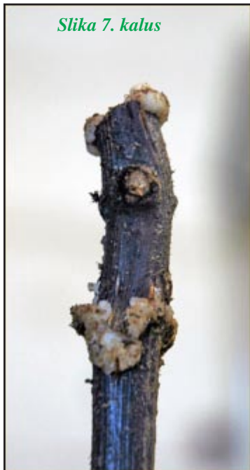
Slika 7. kalus

Uvjeti stratificiranja (temperatura, vlaga, prozračnost) bitni su čimbenici formiranja kvalitetnog kalusa i uspješnog sraštanja podloge i plemke. Prva tri dana temperatura treba biti oko 30°C. Kada se u sanducima postigne temperatura od 24-26°C, smanjuje se grijanje dok se ne postigne ova temperatura u cijelokupnom prostoru i se održava do kraja stratificiranja.