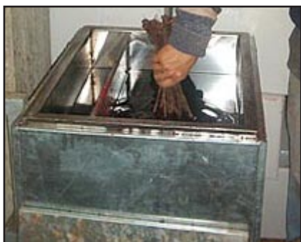
Slika 5. parafiniranje