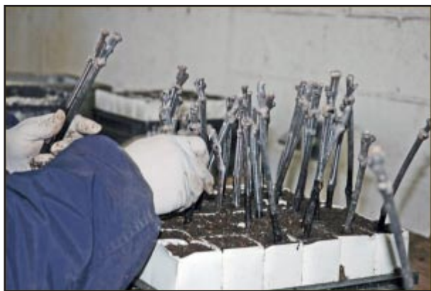
Slika 16. sadnja cijepova u lončice sa supstratom