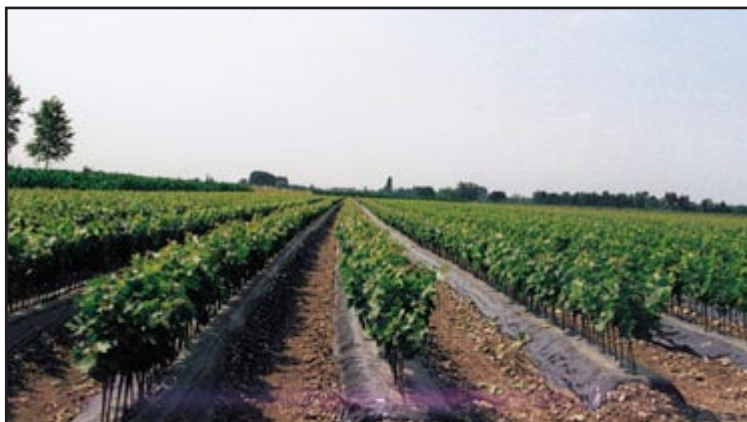
Slika 11. prporište

Navodnjavanje u prporištu je neophodna agrotehnička mjera. Može se provoditi sustavom kap po kap ili kišenjem. Broj navodnjavanja u tijeku vegetacije ovisi o tipu tla, klimatskim uvjetima odnosno o rasporedu padalina. Preporučuje se u