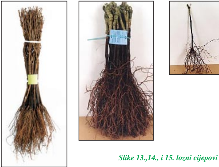
Slike 13.,14., i 15. lozni cijepovi

Cijepovi se vade iz prporišta u jesen nakon opadanja lišća, a prije nastupa prvih mrazova. Korijen je osjetljiv na niske temperature pa se cijepovi vade pri dnevnim temperaturama višim od 0°C. Prije vađenja skine se crna folija sa humaka. Cijepovi se mogu vaditi ručno ili specijalnim nošenim traktorskim vibrirajućim plugom.