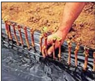
Slika 9. ručno prporenje pod foliju