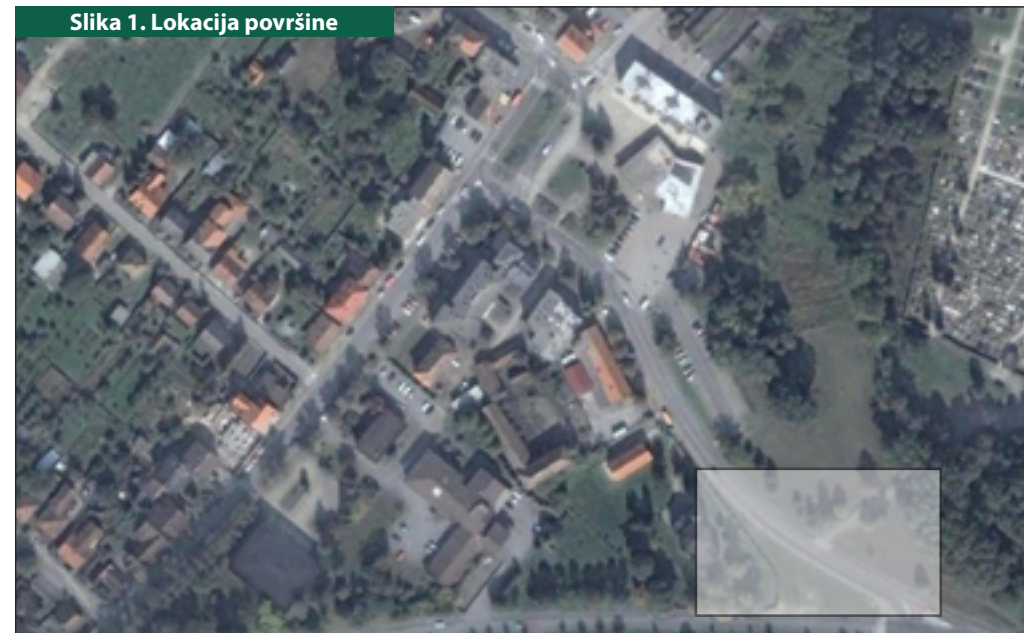
Slika 1. Lokacija površine

Nakon odabira biljnog materijala određen je postupak sadnje te mjere za kasnije održavanje i njegu.