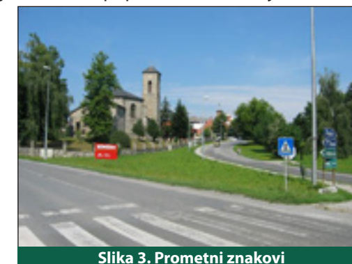
Slika 3. Prometni znakovi