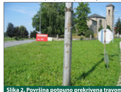
Slika 2. Površina potpuno prekrivena travom

Unutar granice obuhvata smješteno je nekoliko prometnih znakova i reklama (Slika 3.). Za reklamu se preporučuje promjena lokacije kako bi se popravio vizualni dojam.