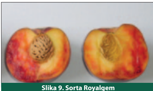
Slika 9. Sorta Royalgem

Ocjenjivanje organoleptičkih svojstava obavljeno je subjektivnom procjenom, ocjenjivanjem u rasponu od 1 do 5 (vrijednost 1 je najlošija procjena, a vrijednost 5 najbolja). Rezultati te procjene prikazani su u tablici 4. Sorta breskve Royalgem te sorta nektarine Maria Laura imaju odlično ocijenjen okus i aromu i izvrsnu usklađenost organoleptičkih svojstava.