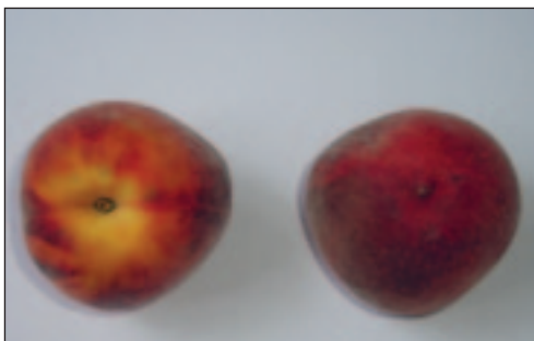
Slika 1. Plodovi breskve ( Prunus persica var. vulgaris L.) sorta Royalgem

Rodnost je dobra i redovita, a rast je bujan.