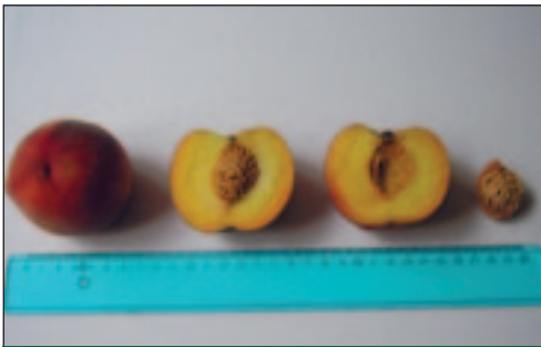
Slika 4. Prerezani plod i koštica sorte Rich Lady

Plodovi te sorte na rod dolaze od 3. do 5. srpnja. Plod je vrlo velik, okruglog oblika. Prosječna težina ploda je 158 g.