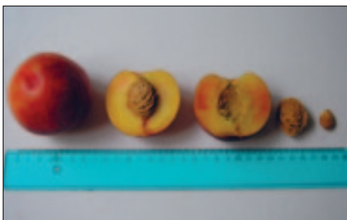
Slika 6. Prerezani plod i koštica sorte Big Top