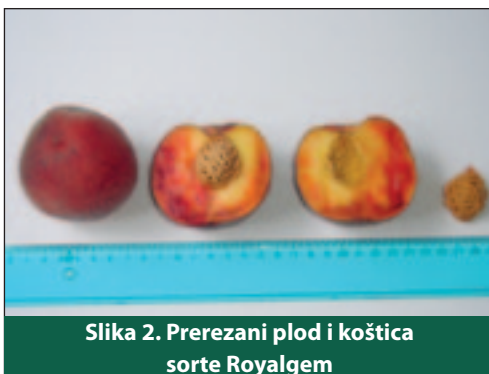
Slika 2. Prerezani plod i koštica sorte Royalgem