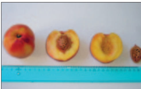
Slika 8. Prerezani plod i koštica sorte Maria Laura