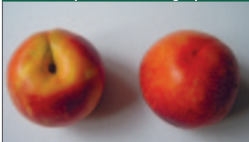
Slika 5. Plodovi nektarine ( Prunus persica var. nucipersica L.) sorta Big Top

Kožica ploda je glatka, žuto-narančaste boje preko koje je plod 90-100% prekriven crvenom bojom. Vršak ploda malo je izražen