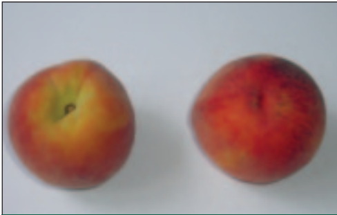
Slika 3. Plodovi breskve ( Prunus persica var. vulgaris L.) sorta Rich Lady