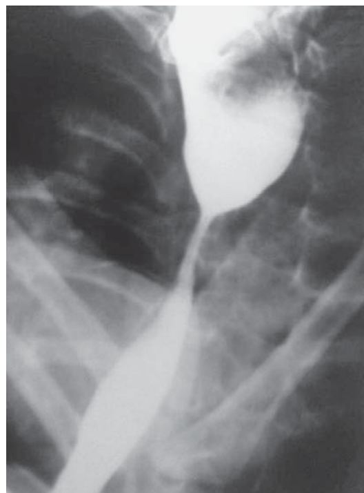
SLIKA 3. Pasaža jednjaka vodotopivim kontrastom. Prikaz strikture nastale nakon operacije atrezije jednjaka.

Analizirali smo mortalitet nakon operacijskog zahvata prije i poslije uvođenja intenzivnog poslijeoperacijskog liječenja djece. Opazili smo da je značajno veći mortalitet bio prije