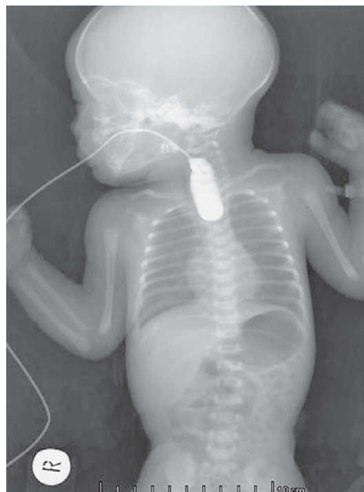
SLIKA 1. Pasaža jednjaka vodotopivim kontrastom. Proksimalni bataljak ispunio se kontrastom. Zrak u želucu upućuje na postojanje distalne traheoezofagealne fistule.

ne prolazi u distalni jednjak, već se ispunjava proksimalni bataljak, što je dokaz atrezije jednjaka. Ako u želucu postoji mjehur zraka, zaključujemo da je riječ o najčešćem tipu atrezije jednjaka (Vogt 3B/Gross C) (slika 1).