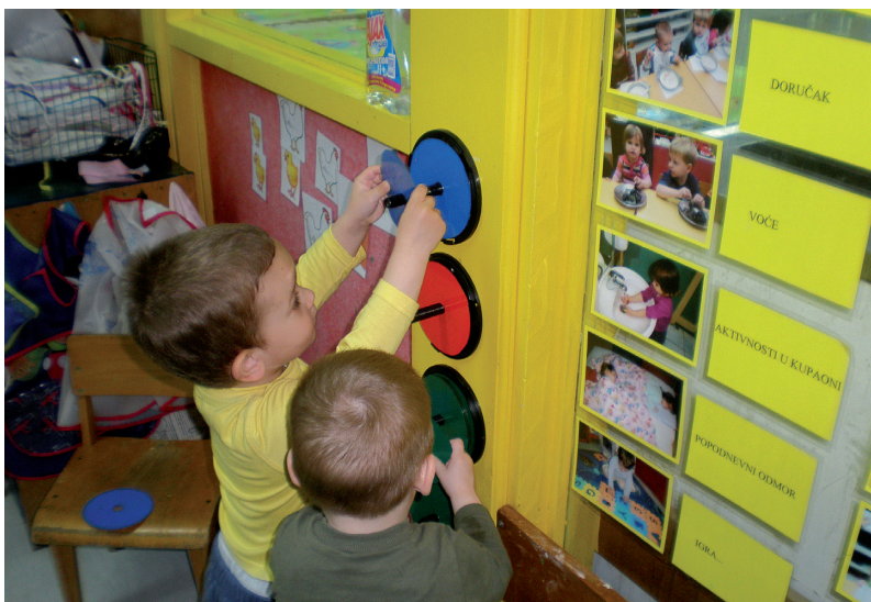
Odgovornost prema djeci dio je profesionalne etike