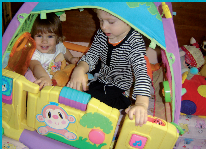
Specifičnost profesionalne etike odgajatelja jest njezina povezanost s emocijama

štita odgajateljima i ostalim dionicima odgojno-obrazovnog procesa. Što je profesija razvijenija, to je nužnije postojanje njezina etičkog kodeksa. On je svojevrsan vodič profesionalcu, no i društvu koje na taj način uviđa koje su obveze profesionalca i što se od njega može očekivati u profesionalnom djelovanju. Etički kodeks je samo dio profesionalne etike. Profesionalna etika puno je širi pojam od etičkog kodeksa. Ona uključuje i pisana i nepisana, formalna i neformalna pravila po-