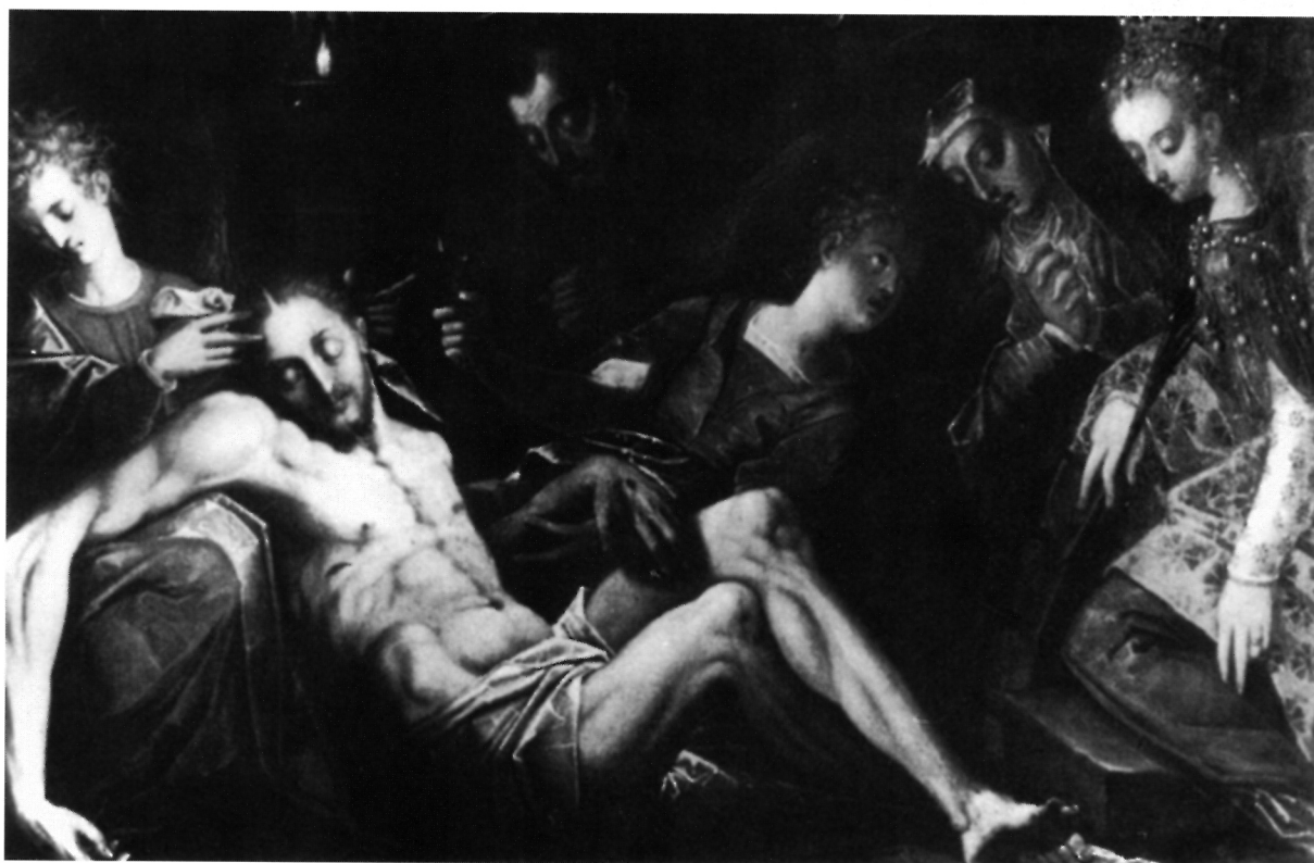
8. Paolo Piazza, Pietà , Ferdinandeum Tiroler Landesmuseum, Innsbruck