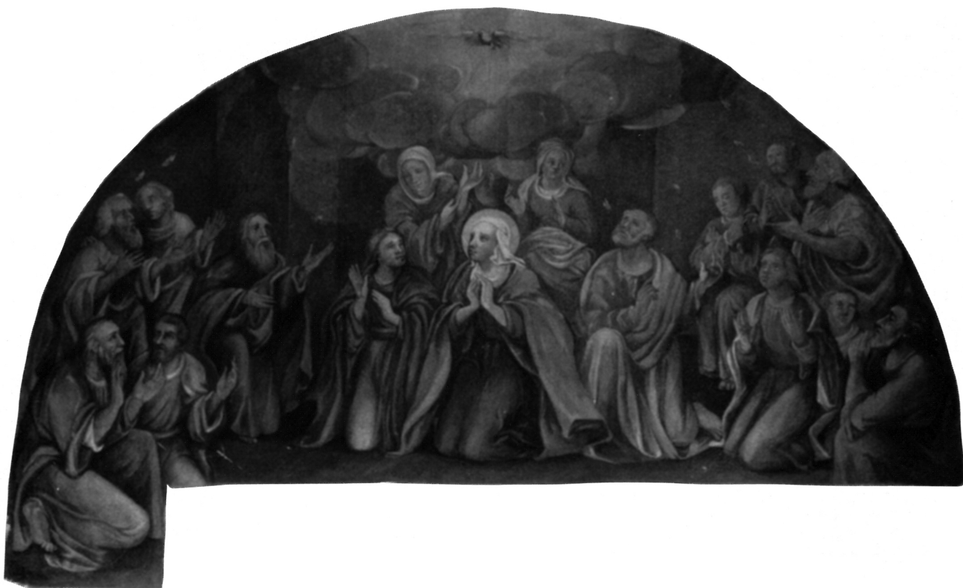
7. S. Schön, Silzazak Duha Svetoga , klaustar franjevačkog samostana na Trsatu, foto: D. Krizmanić