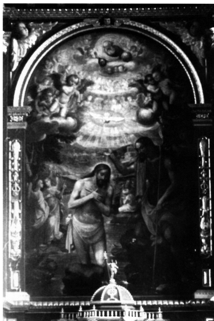
16. S. Schön, Krštenje Kristovo , župna crkva u Menzingenu, Švicarska