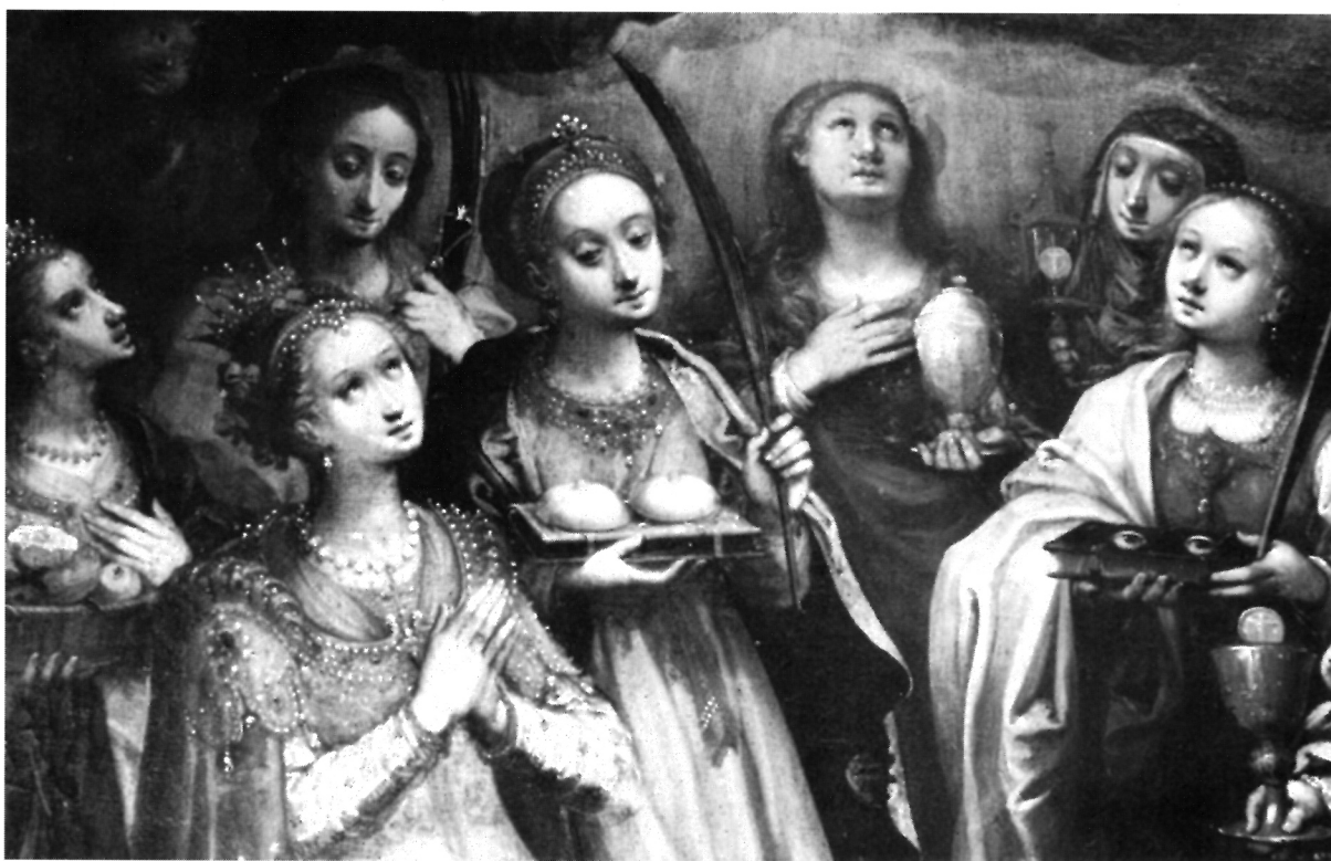
2. S. Schön, Sv. Katarina i svetice mučenice, crkva Gospe Trsatske, detalj