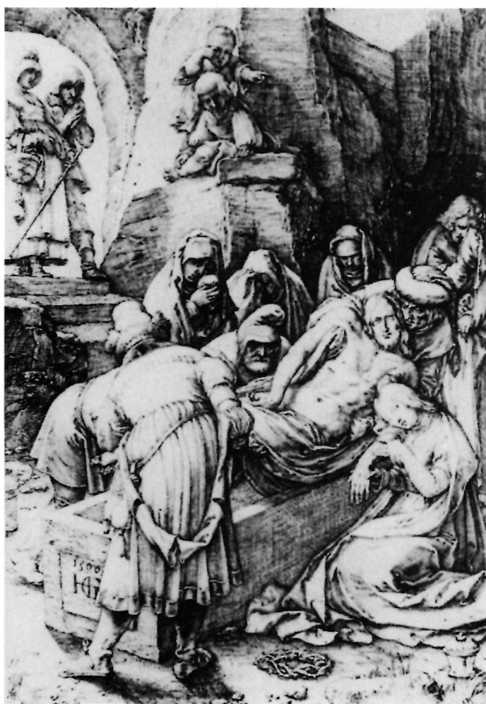
10. Hendrick Goltzius, Polaganje u grob