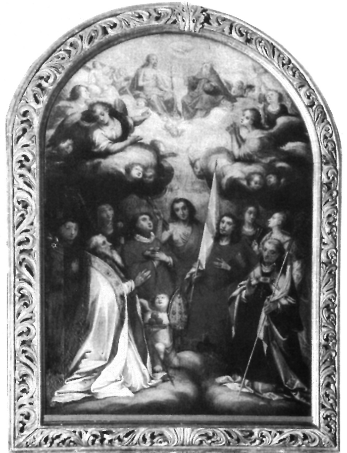
6. S. Schön, Sv. Nikola i zagovornici, crkva Gospe Trsatske