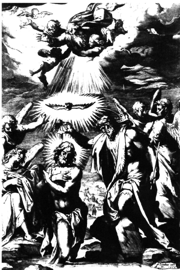
15. Cornelis Cort, Krštenje Kristovo