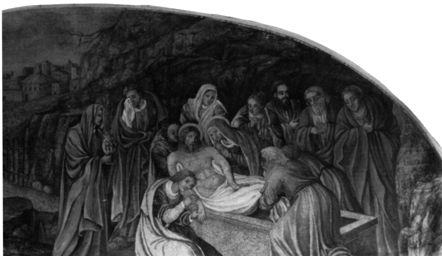
12. S. Schön, Polaganje u grob , klaustar franjevačkog samostana na Trsatu