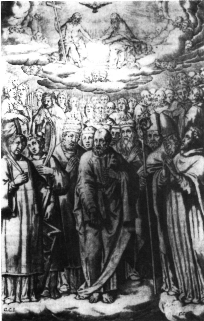
4. Cornelis Cort, Sv. Petar crkveni poglavar