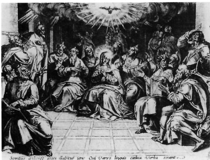
5. Cornelis Cort, Silazak Duha Svetoga