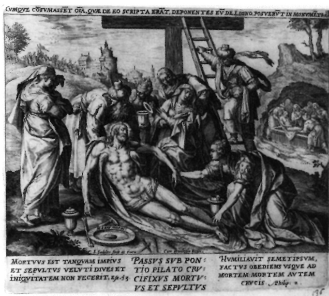
11. Johan Sadeler, Skidanje s križa