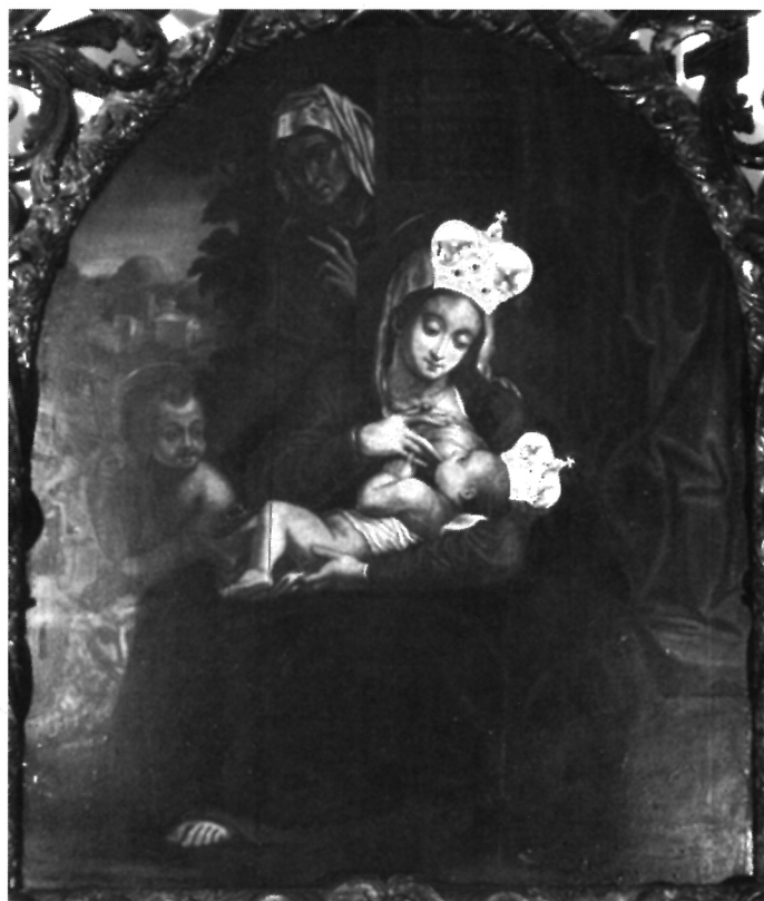
14. S. Schön, Bogorodica s Djetetom, sv. Anom i sv. Ivanom Krstiteljem, kućna kapela u franjevačkom samostanu na Trsatu