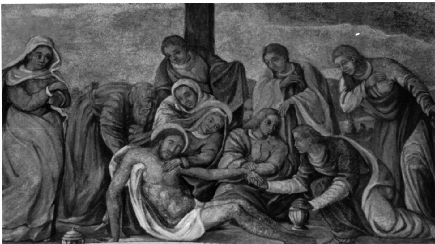
9. S. Schön, Oplakivanje , klaustar franjevačkog samostana na Trsatu