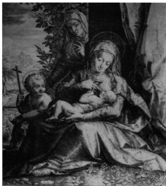
13. Johan Sadeler, Bogorodica s Djetetom, sv. Anom i sv. Ivanom Krstiteljem