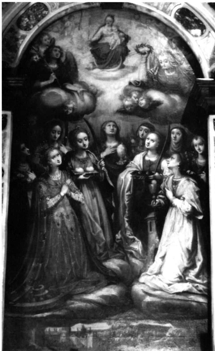
1. S. Schön, Sv. Katarina i svetice mučenice, crkva Gospe Trsatske