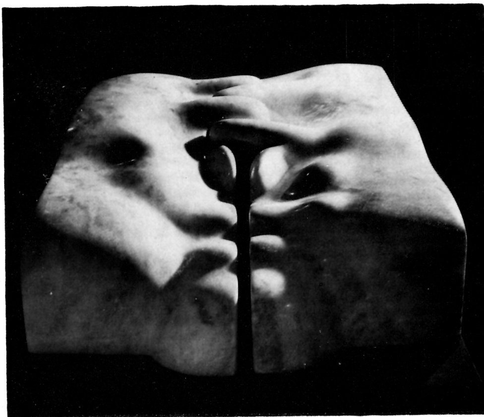
2 Ante Marinović (1947), »Kupido i Psiha«, 1977. g.

Neposredna konfrontiranja dela i ličnosti vajara i slikara pokazuju da ta dva puta mišljenja, dva načina ponašanja i reagovanja, uslovljena različitim spoljnim situacijama, neminovno utiču na celokupno stvaralaštvo, a posredno na tipološku podvojenost koja u krajnjem cilju dovodi do srodnih duhovnih opredeljenja, kada je u pitanju intimni iskaz. Ta dva nivoa umetničkog jezika nisu i nivoi kvaliteta, već samo tipološke odrednice apstraktnog koncepta za skulpturu i figurativnog za slikarstvo.