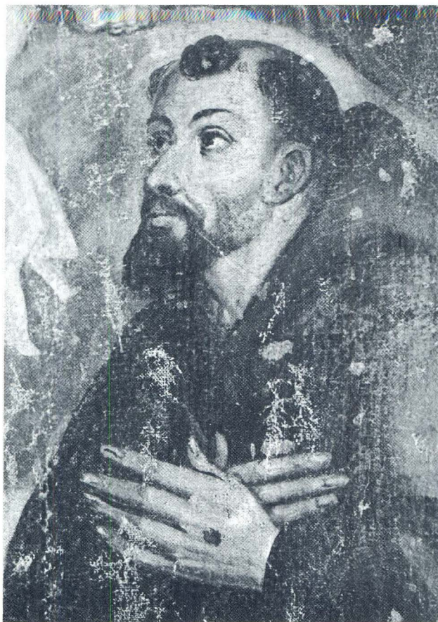
Moreschi: Pala na glavnom oltaru župne crkve u Lobariki, detalj sv. Franje

ekspresivnošću. To se najljepše vidi na fizionomijama prikazanih likova koji, iako često tipizirani i pomalo narušenih proporcija, efektnije prenose ideju o pučkoj, nepomućenoj vjeri ili određenoj teološkoj doktrini, nego li lica na platnima nekih poznatijih suvremenika.