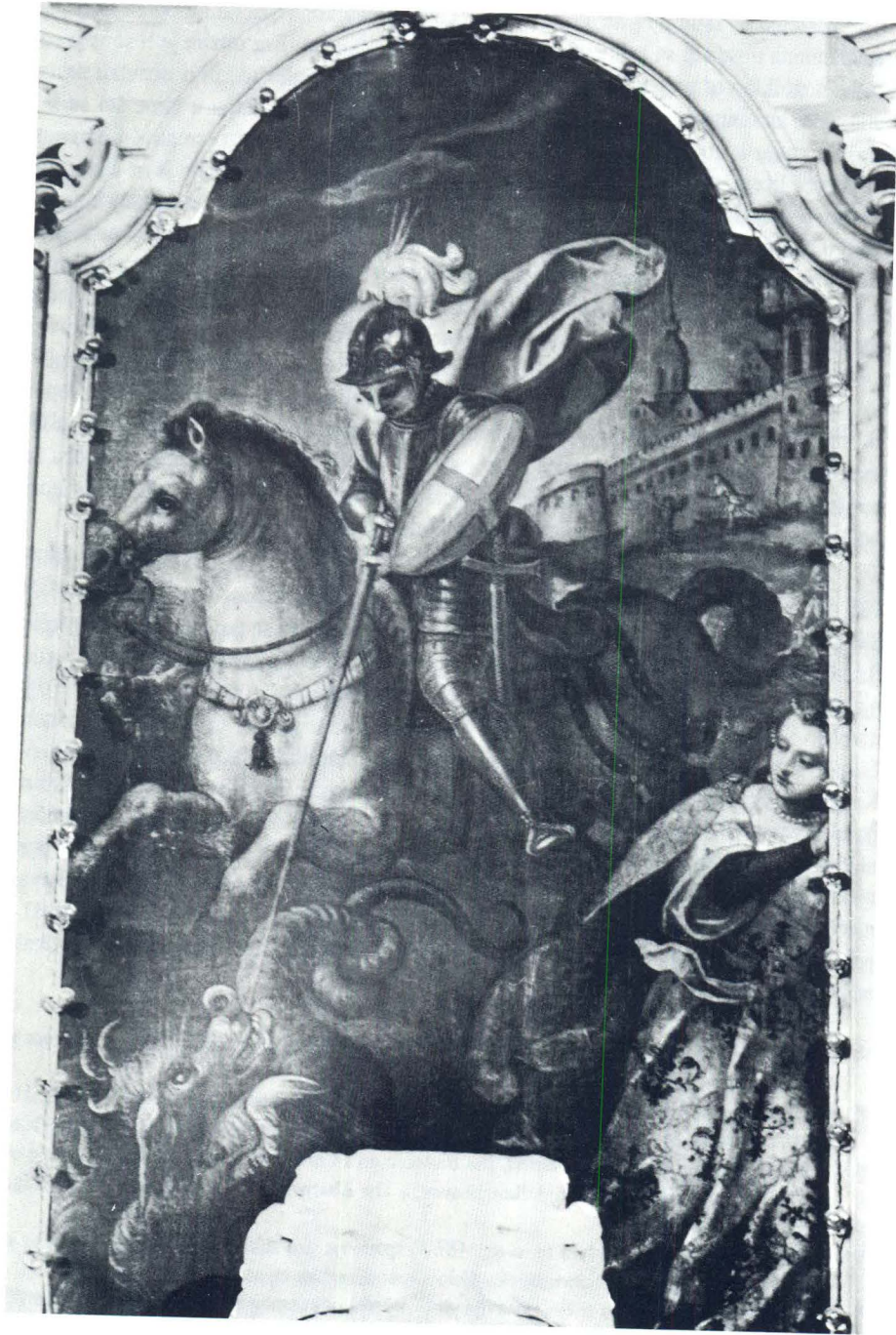
Baldassare d'Anna: Pala na glavnom oltaru župne crkve u Oprtju