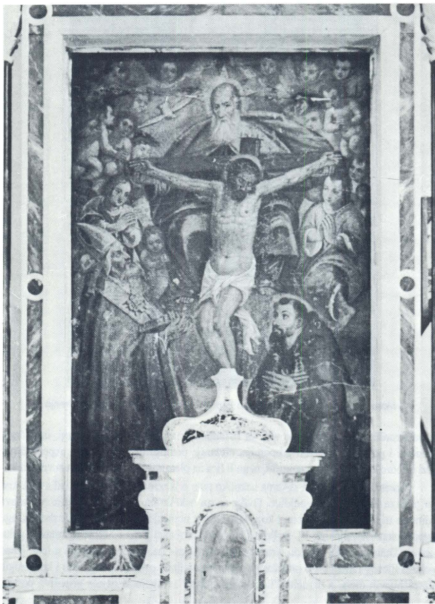
Moreschi: Pala na glavnom oltaru župne crkve u Lobariki