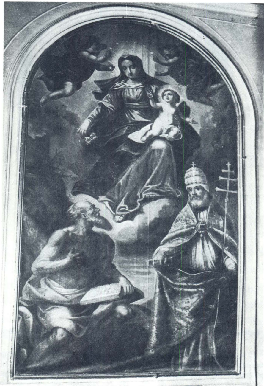
Baldassare d'Anna: Pala iza glavnog oltara župne crkve u Humu