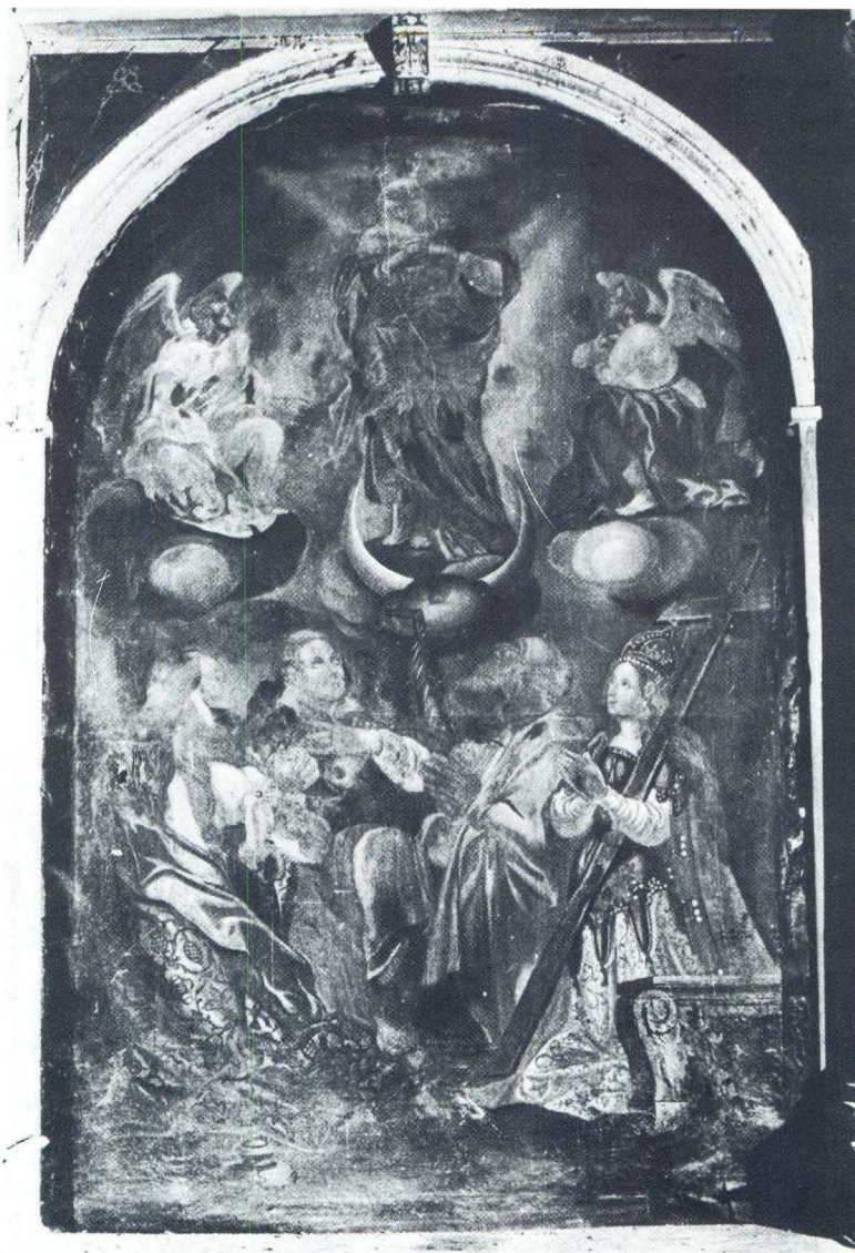
Baldassare d'Anna (?): Pala s oltara sv. Šimuna u crkvi Sv. Marije Magdalene u Mutvoranu

Na lijevom oltaru slavludočnog tipa i strogih linija, 22 uz trijumfalni luk nekadašnje župne crkve sv. Marije Magdalene u Mutvoranu nalazi se slikana pala (214 x 145 cm) što prikazuje Bezgrešno Začeće grupu svetaca. To su sv. Marija Magdalena, sv. Vinko, sv.