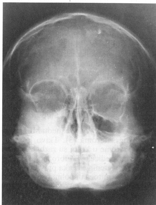
Slika 2. Ekspanzija kosti i homogena difuzna zahvaćenost desne maksile prouzročena fibroznom displazijom

Figure 1. Fibrous dysplasia of the maxilla. Note the facial asymmetry