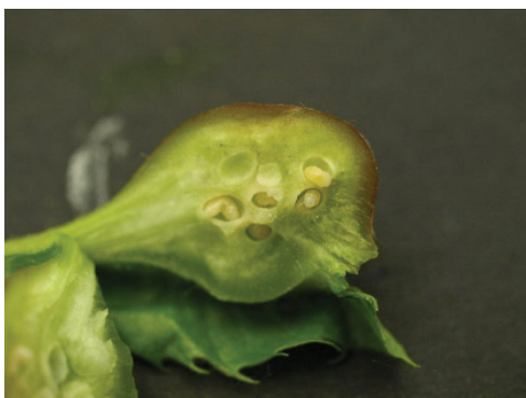
Slika 4. Ličinke u šiški, 30. 5. 2011. Figure 4. Larvae in a gall, 30. 5. 2011.