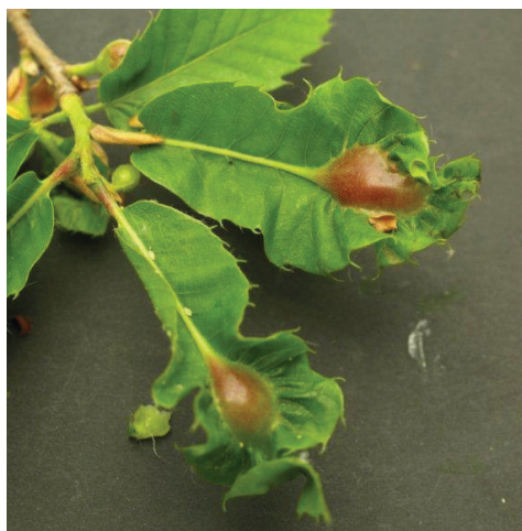
Slika 3. Šiške na listu, 15. 5. 2011.

Figure 2. Galls of the chestnut gall wasp on twig, 10. 5. 2011.