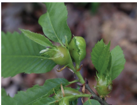
Slika 2. Šiške kestenove ose šiškarice na izbojku, 10. 5. 2011.

šiškama 10. 6. 2011. godine (Slika 6.). Nakon izlaska ženke odlažu jaja u pupove pitomoga kestena. Kestenova osa šiškarica razmnožava se partenogenezom, pa embriogeneza započinje bez kopulacije i oplodnje. Ženke su na lokalitetima istraživanja izlazile iz šiški od polovice do kraja lipnja. Ženke odlažu 3–5 jaja u pup pitomoga kestena, a svaka ženka može odložiti više od 100 jaja. Životni je vijek ženki kratak (oko 10 dana). Ličinke izlaze iz jaja za 30–40 dana, a rani larvalni stadiji prezimljavaju u pupu. Nakon izlaska imaga šiške se osuše, postanu drvenaste (Slika 7.) i ostaju na izbojcima. Šiške su lako uočljive i prepoznatljive, no jaja i ličinke prvoga larvalnog stadija u zimskim pupovima mogu se utvrditi samo pregledom binokularnim ili entomološkim povećalom.