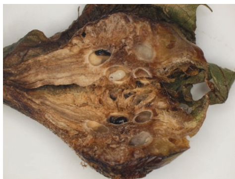
Slika 5. Bijela i smeđa kukuljica u šiški, 15. 6. 2011. Figure 5. white and brown pupa in a gall, 15. 6. 2011.