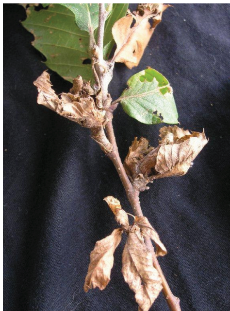
Slika 7. Stare šiške, 4.9.2011.

Figure 6. Adult of the chestnut gall wasp, author Gyuri Csoka.