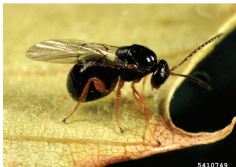
Slika 6. Imago kestenove ose šiškarice, autor Gyuri Csoka.

Figure 6. Adult of the chestnut gall wasp, author Gyuri Csoka.