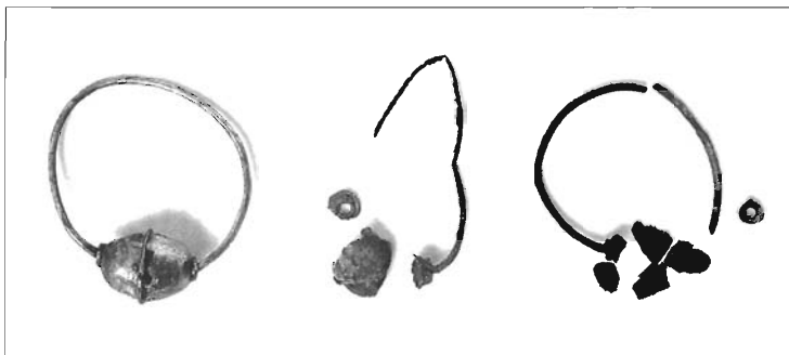
Naušnice iz grobova

Usprkos maloj istraženoj površini i skromnim nalazima, nedostatnim za iznošenje konačnih zaključaka o površini lokaliteta, te trajanju ukapanja na ovom položaju, rezultati obavljenog sondiranja, važan su prilog arheološkoj topografiji benkovačkog kraja.