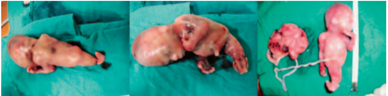
Slika – Figure 1. Sirenomelija – pobačeni plod / Sirenomelia – the aborted fetus