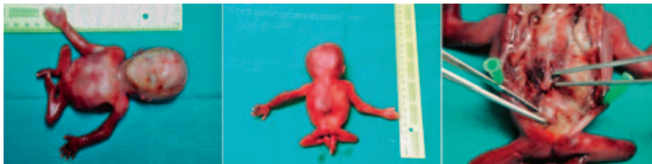
Slika 3. Sindrom kaudalne regresije – pobačeni plod Figure 3. Caudal regression syndrome – the aborted fetus

odnosu na žensku 2,7:1 te kod monozigotnih blizanaca. 1 U našem slučaju je bila jednoplodova trudnoća s kariotipski urednim muškim plodom, s jednom umbilikalnom arterijom.