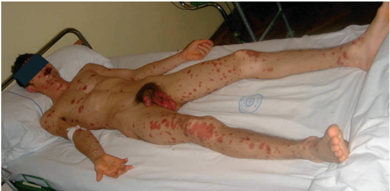
Slika 1. Stevens-Johnsonov sindrom potaknut Mycoplasma pneumoniae infekcijom s target lezijama i deskvamacijom kože genitalne regije (Nicolsky-ev fenomen)

Pored intenzivnih općih i lokalnih simptomatskih mjera bolesnik je peroralno liječen azitromicinom u dozi od 500 mg tijekom tri dana. Drugog dana hospitalizacije, zbog progresije kožnih lezija, u terapiju je uveden metilprednizolon u dozi od 1,5 mg/kg tijekom tri dana. U dalj-