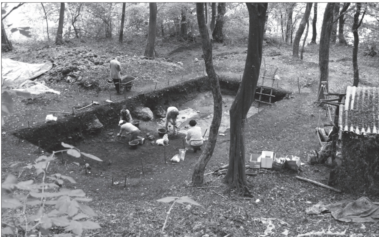
Sl. 1. Pogled na iskopnu površinu sa sjevera

U srpnju 2008. nastavljen je rad u sondi 2 (sl. 1.) s ciljem