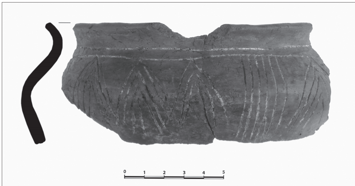
Sl. 3. Ulomak zdjelice fine fature ukrašen inkrustacijom

Fig. 3 Fragment of a little bowl with fine fabric, decorated by incrustation