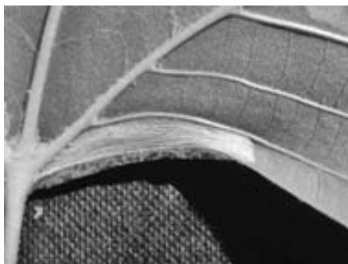
Slika 6. – Figure 6 P. platani -donja strana lista

Miner je tijekom istraživanja nađen na domaćinu Platanus sp. Vrsta je tijekom istraživanja imala: 2004. tri, a 2005. godine dvije generacije i djelomičnu treću generaciju godišnje (Tablica 4.).