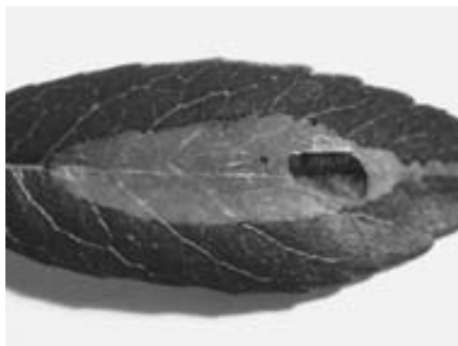
Slika 5. – Figure 5 Phyllonorycter leucographella

Nakon eklozije ličinka se hrani isključivo palisadnim parenhimom i počinje stvarati minu s gornje strane lista (Slika 5), prvo usku epidermalnu uz samu glavnu žilu koju postepeno proširuje sve dok mina, ovisno o veličini lista, ne pokriva po-