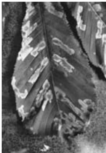
Slika 2 – Figure 2. Cameraria ohridella

Početak osamdesetih godina otkrivena je dotada još neopisana vrsta lisnog минера na divljem kestenu na Ohridskom jezeru u Makedoniji za vrijeme masovne pojave. Deschka i Dimić (1986) opisuju vrstu kao Cameraria ohridella . Porijeklo ove vrste nije još do danas sasvim rasvijetljeno (Girardož i dr., 2006). U Zagrebu je kestenov moljac miner prvi puta nađen 1989. godine (Maceljski i Bertić 1995). Iste godine je otkriven u Linzu, Austrija, oko 1000 km sjeverozapadno od Ohridskog jezera. Austrijski lokalitet je zatim bio točka od kuda se C. ohridella širila po središnjoj Europi. Do Njemačke je došla 1992., Češke 1993., Slovačke 1994., Švicarske i Poljske 1998. godine. Od tada se leptir proširio još više na sjever i zapad po Europi te je do sada došao do Danske granice, Francuske (Pariza), Italije i Engleske (Freise i dr. 2002).