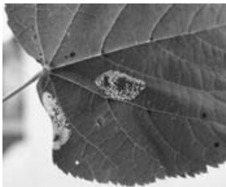
Slika 4. – Figure 4 P. issikii -karakterističan oblik i boja mine