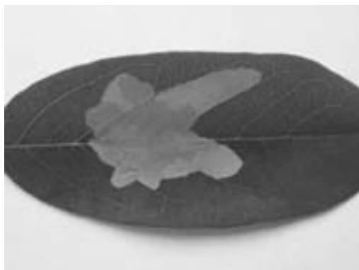
Slika 1 – Figure 1. Parectopa robiniella